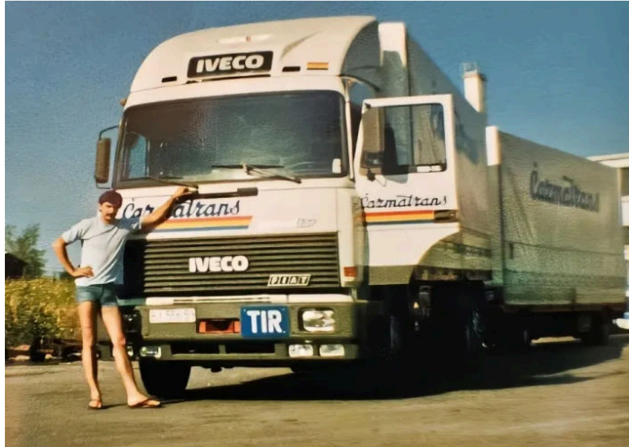
Ispred kamiona u Iraku

FROJ, Festivalu rada omladine Jugoslavije u natjecanju vožnje kamiona.