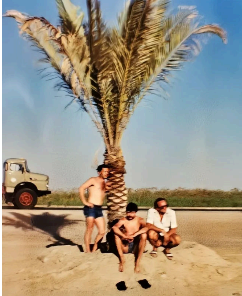
Odmor kraj palme u Iraku

S druge strane, vožnja kamiona bila je teška za privatni život. Znaš, rijetko sam bio kod kuće, a to je značilo malo vremena za ljubav. U to vrijeme bio sam u vezi s jednom djevojkom, kondukterkom brisati iz Daruvara. Bilo je ozbiljno, planirali smo se preseliti u Zagreb i osnovati obitelj.