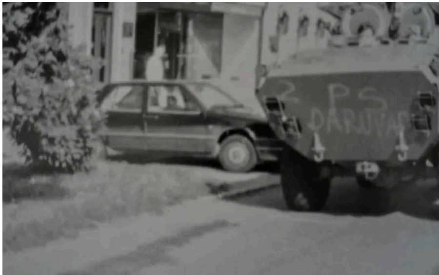
BOV (borbeno oklopno vozilo) 1991. godine

Kad sam se vratio, direktor Čazmatransa mi je ponudio da pređem u Čazmu, nudio mi je i stan, ali nisam htio. Rekoh, idem kući, tamo mi je mjesto, pa ću vidjeti što ću dalje.