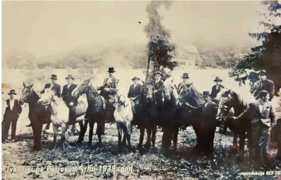
Ivančići, Krešimirovi preci, snimljeni na Petrovom vrhu 1939. godine

dobra osoba. Otac je također bio cijenjen u društvu, jako vrijedan čovjek.