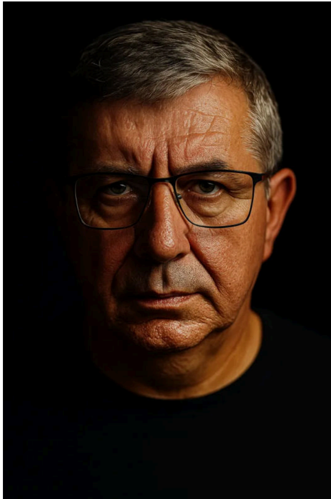
Krešimir Ivančić/Foto: MojPortal.hr

To je bio moj dječaćki san... Htio sam vidjeti svijeta. Znao sam da s kamionom mogu otići u druge države, upoznati druge kulture... Zato sam htio biti vozač kamiona, da mogu putovati.