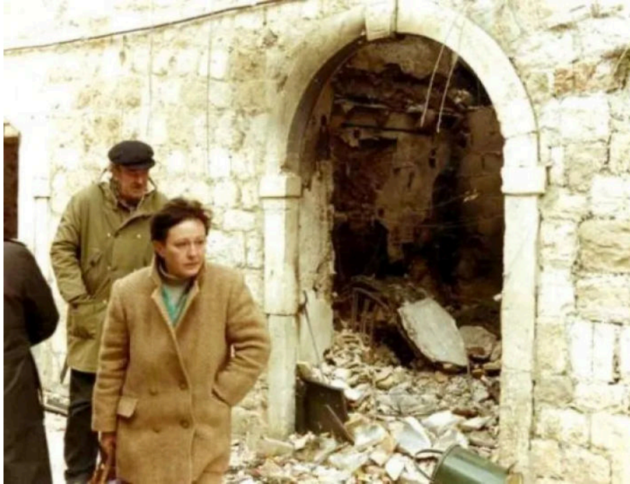
Dubrovnik tijekom Domovinskog rata

Dubrovnik je bio blokiran i onda su nas poslali u akciju deblokiranja Dubrovnika. Ti moji dečki i ja smo bili u Kuparima, to je bio najgori teren. Tamo se tuklo od jutra do mraka, cijeli dan garantiranje. Ne možeš spavati u krevetu jer je preopasno. Spavaš ili na podu ili pod krevetom. Poslije smo se vraćali za Zagreb, dio ovih mojih je rekao da će se razdužiti.