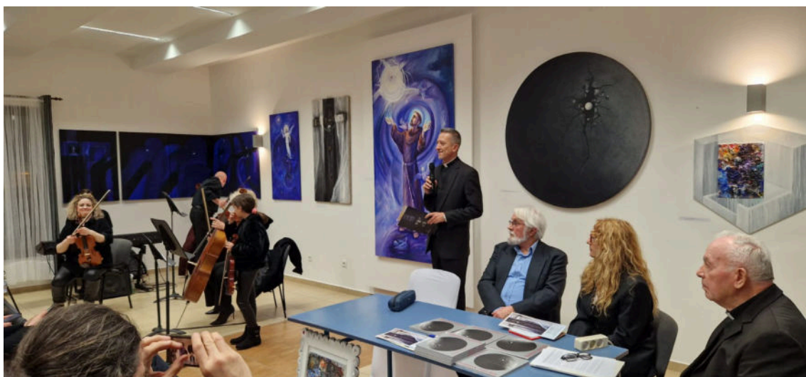
puno je dana u godini koji kulturnim sadržajem pune dvoranu Ekumena

„Svojim je aktivnostima i programima Župa otvorena ljudima različitih svjetonazora i vjera, ostvarujući osobitu vrstu pastoralnog i misionarskog djelovanja u gradu Zagrebu. Otvorenost svima i poštivanje njihovih prava uklanja predrasude prema Crkvi koja je ‚zatvorena‘ i ‚neprilagođena‘ duhu vremena, potvrđujući se kao živa zajednica u kojoj svi imaju jednake mogućnosti za sudjelovanje i razvoj“, kazuje nam dr. Horić koja umjetnost stavlja u službu slavljenja Boga. „Brojne likovne izložbe i koncerti duhovne i ozbiljne glazbe otkrivaju i potvrđuju da rad pozvanih umjetnika svoju inspiraciju crpi iz osobnog iskustva vjere u Boga što se očituje likovnim i glazbenim izrazom. Drago mi je da je papina enciklika Lumen fidei , kao teološki argument o ulozi vjere i poslanju vjernika kršćana u suvremenom svijetu, zaživjela i u našoj župnoj zajednici. Od tjednog informativnog glasila (župni listić) preko dvogodišnjeg biltena o životu i aktivnostima Župe, sve do nakladničkog niza Deodatus – svjedoči o vjeri koja ne želi ostati privatna stvar izolirana od stvarnosti suvremenog svijeta, već postaje poziv široj zajednici tiskanom građom među kojom nezaobilaznu vrijednost ima i monografija Svetionik milosrđa “ uz 30. obljetnicu Župe.