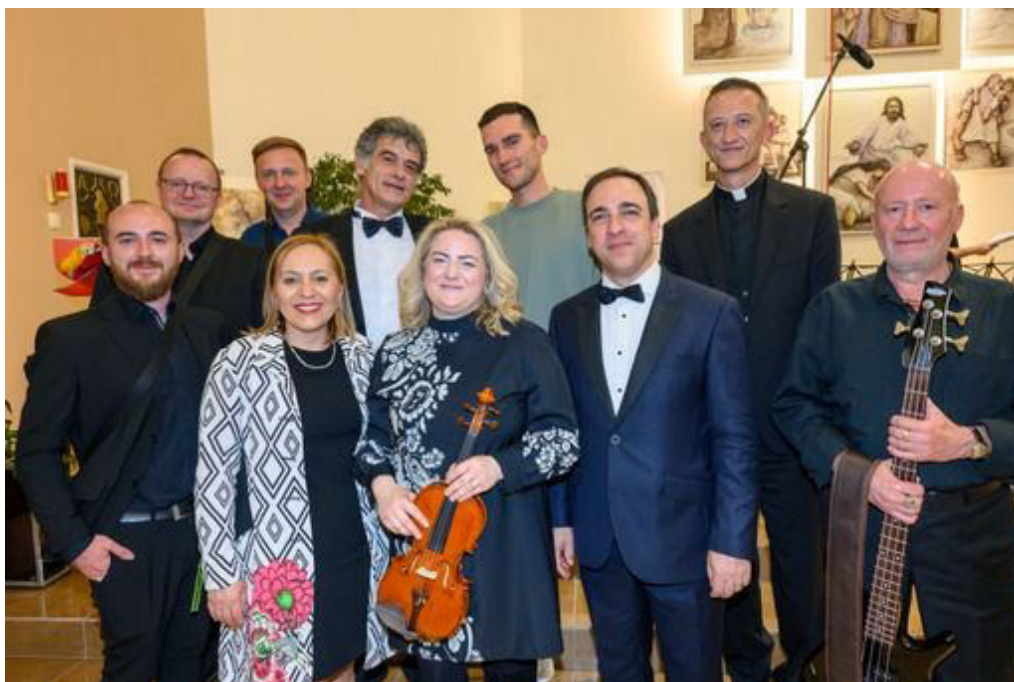
sudionici velebnog koncerta u župnoj crkvi

čarolije. Korisnici projekta doživljavaju osobne uspjehe koje nikada ne bi postigli bez ove prilike. U glazbenim radionicama mnogi su naučili izražavati se na načine koje nisu smatrali mogućima. Primjerice, neki su po prvi put osjetili radost nastupa pred publikom, dok su drugi razvili nove vještine koje su poboljšale njihovo samopouzdanje i međuljudske odnose. Ovi uspjesi ne samo da obogaćuju njihove živote, već i jačaju zajednicu, postaju inspiracija i motivacija za druge. Iako se suočavamo s izazovima, posebice u pogledu financijskih sredstava, župnik i župljani prepoznali su vrijednost našeg rada. Njihova podrška važna je za nastavak našeg projekta i ostvarenje zajedničkih ciljeva. Osmijesi na licima učenika potvrda su da smo na pravom putu“.