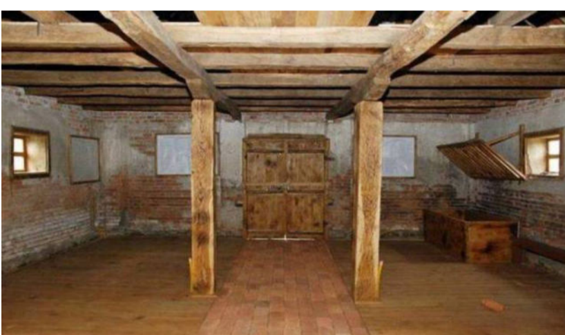
Burića štala u Garevcu

Grobovi koji su poslije ostajali na nepreglednim poljanama, bili su naprosto uobičajena pojava u svakom razaranju i krvoproliću. Ožiljke koje je zadobivao u tim stradanjima, ranjavanja, amputacije i zarazne bolesti poput tifusa, nerijetko su mu ostajali kao trajni suvenir na teške, ogladnjele i surove dane njegova težačkog života. A tek uciviljene udovice i majke, djeca, očevi, u dubokoj žalosti nosili su kroz pokoljenja tu gorku tugu, razočaranje i nepravdu.