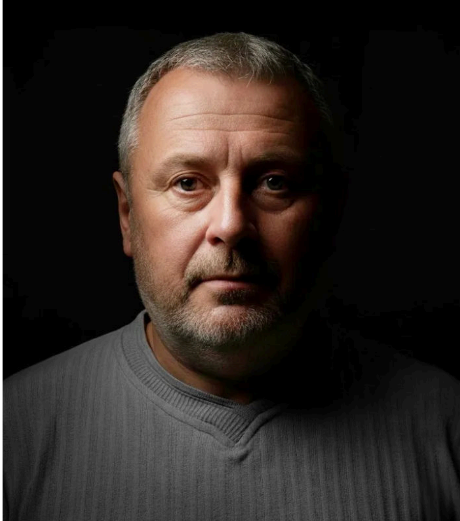
Alen Skender

Emotivna je bila i ispovijest Dinka Tandare , branitelja iz Bjelovara koji je sa svojim bratom Antom krenuo u obranu Hrvatske i potom ga 8. rujna 1991. izgubio u Kusionjama, u pokolju u kojem je živote izgubilo ukupno 20 branitelja. No, najgore je bilo to što je potom uslijedila Dinkova mukotrpa potraga za bratovim tijelom koje je na kraju pronađeno krajem siječnja 1992. u masovnoj grobnici.