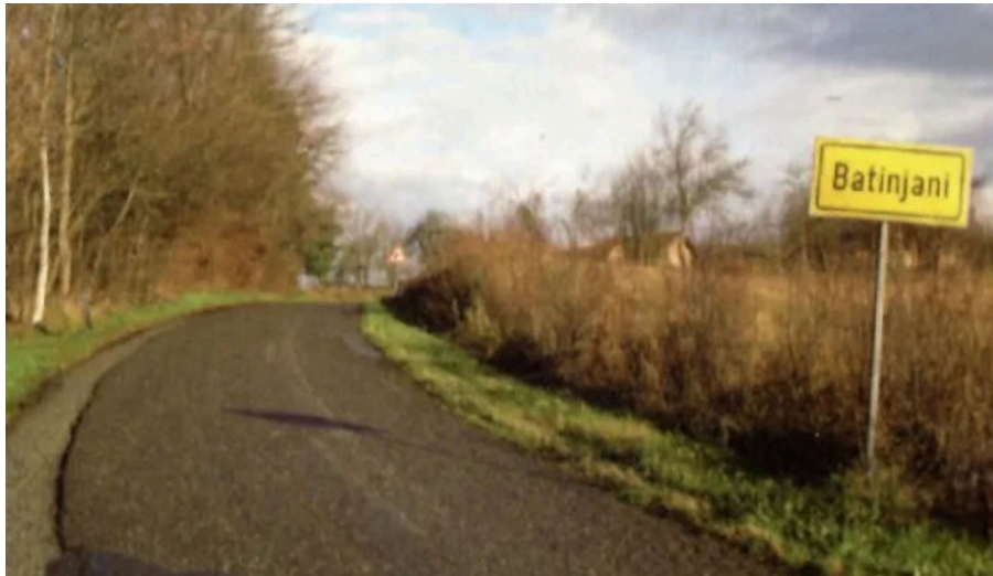
Cesta kroz Batinjane koja je jedno vrijeme bila jedini izlaz iz Pakraca

- Čekajte da ja prvo malo protrčim - kažem im.