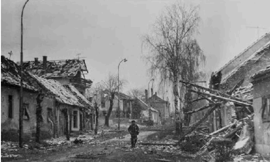
Pakrac 1991. godine

Krenulo se s osnivanjem straža, počelo se nabavljati oružje, vidjelo se da je vrug odnio šalu. Ja sam tad gradio kuću i nisam mogao vjerovati da moram novac potrošiti na oružje. Automat je koštao par tisuća maraka što je značilo da moram prodat kravu da bih ga kupio.