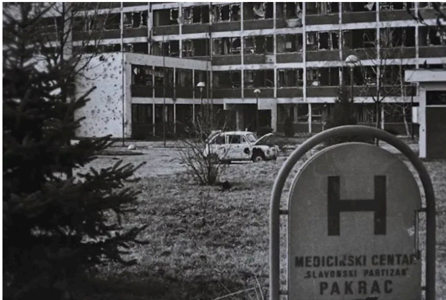
Pakračka bolnica tijekom Domovinskog rata

Srbi su tukli i po bolnici, a mi smo dobili zadatak da iz nje izvučemo anesteziološki aparat i lijekove. Rekli su nam kako je taj aparat jako važan. Organizirali smo grupu za taj zadatak, uspjeli izvući aparat i uzeti lijekove.