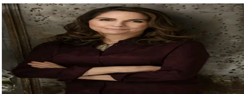
Mary Carr / Izvor:marycarr.com

Nagrađivana američka pjesnikinja Marry Carr proslavila se memoarima u kojima je opisala svoje djetinjstvo s dvoje roditelja – alkoholičara. U prvom memoaru „Lažljivica“ opisuje rano djetinjstvo s roditeljima pijancima, a posebno majku kao briljantnu i kreativnu osobu koja je patila od teških psihičkih problema i koja je bila notorna lažljivica i teška alkoholičarka. Prizori iz knjige uključuju majčino nestabilno ponašanje, vožnju u pijanom stanju i prijetnje: