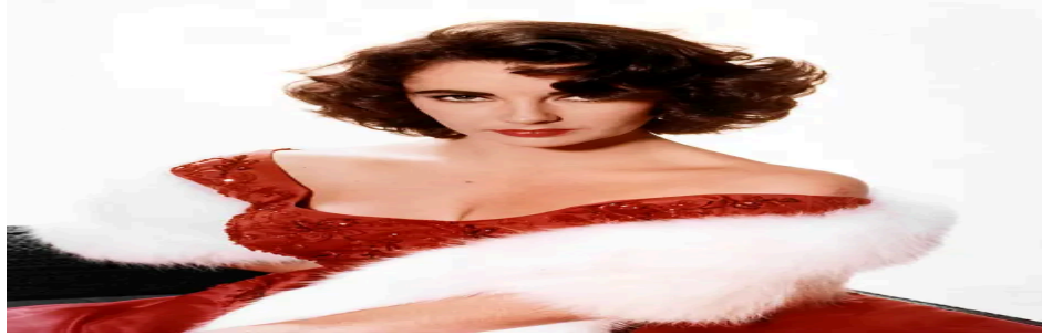
Službeni portret Elizabeth Taylor 1955. godine

Nakon izlaska s liječenja dala je intervju New York Timesu: