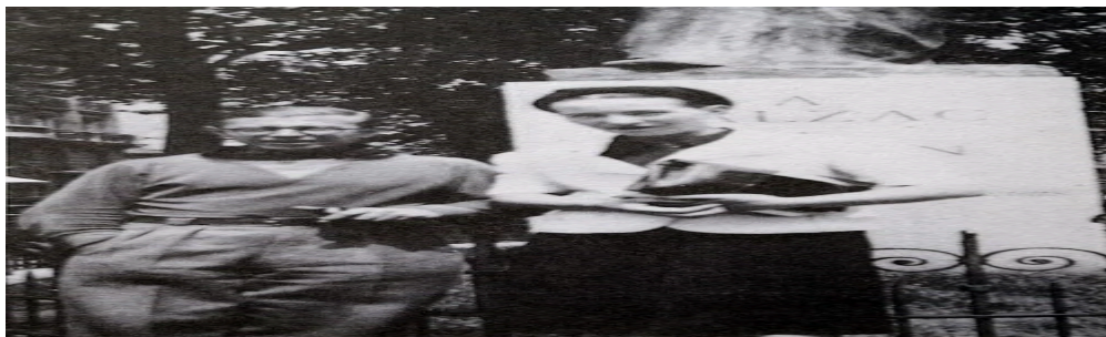
Simone de Beauvoir s dugogodišnjim partnerom Jean Paul Sartreom: oboje su uz alkohol uzimali i amfetamine

I njena suvremenica Simone du Beauvoir, francuska filozofkinja i spisateljica, autorica feminističkog klasika „Drugi spol“ bila je poznata po tome da voli piti alkohol. Često je bila u pariškim umjetničkim društvima u kojima se mnogo pilo, a netko je zapisao i da je „mogla popiti više od muškaraca za stolom“. Tijekom posljednjeg razdoblja života pila je sve više, a koristila je i amfetamine, slično kao i njen dugogodišnji partner, također filozof i književnik Jean Paul Sartre. De Beauvoir je smatrala da je konzumacija alkohola i amfetamina dio njezine slobode da živi kako je željela.