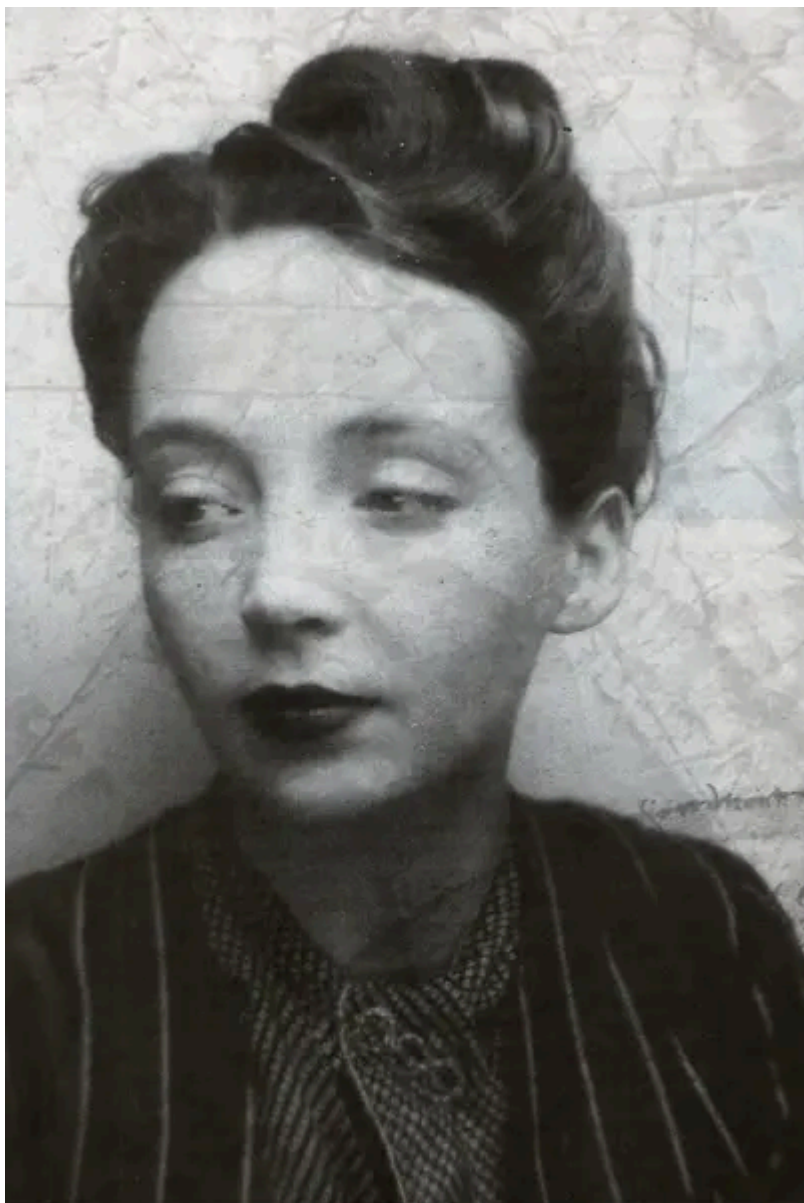
Mlada Marguerite Duras

Duras je smatrala da je postala alkoholičarka već s prvim pićem koje je popila. Ponekad je uspjela pauzirati na nekoliko godina, ali kad bi pila to je bilo bez granice. U intervjuu New York Timesu Duras je 1991. godine izjavila: „Pijem jer sam alkoholičarka. Ja sam istinski alkoholičar kao što sam i istinski pisac. Pijem crno vino da zaspim. Poslije konjak po noći. Svakog sata po češu vina i ujutro konjak poslije kave, a poslije toga pišem. Zapanjujuće je, kad pogledam unazad, kako sam uspjela pisati.“ A pisala je doista mnogo: od 1943. do 1993. napisala je 34 romana, a uz to je i režirala 16 filmova.