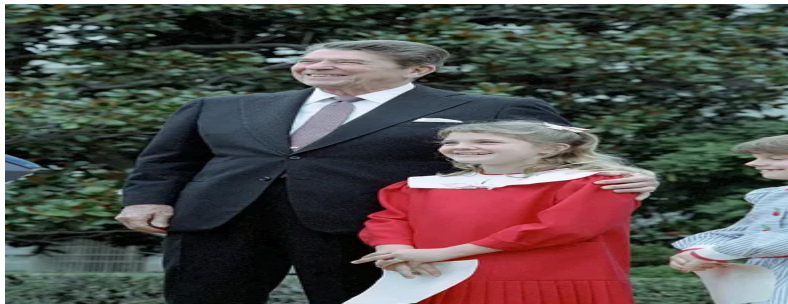
Dječja glumačka zvijezda Drew Barrymore s predsjednikom Ronaldom Reaganom

Počela je raditi još u pelenama, s 11 mjeseci je nastupila u reklami za pseću hranu. Roditelji su se razveli 1984. godine kad je imala 9 godina i postala svjetska zvijezda nakon glavne uloge u filmu Stevena Spielberga „E.T.“. Majka je postala menadžerica male glumice od čije su plaće živjele. Često su se svađale. Drew je napisala da ju je tijekom jedne svađe majka nazvala „gubitnicom, guzicom i kučkom“ pa ju je kćer iz osвете ošamarila. Djevojčicu je majka vodila na partyje u Studio 54 gdje je s drugim celebrityjima pila alkohol, pušila marihuanu i ušmrkavala kokain. S 12 godina Drew je postala ovisnica, a sa 13 ju je majka poslala u Behaviour Health centar za mentalne bolesti u Van Nuysu. Nakon dva mjeseca je napustila centar na svoju odgovornost i ukrala majčinu kreditnu karticu. Majka je angažirala privatne detektive da je nađu i prisilno vrate na odvikavanje. Tamo je ostala sljedećih 16 mjeseci. S 14 godina je pokušala počiniti samoubojstvo, a nakon toga je tri mjeseca provela u domu pjevača Davida Crosbyja i njegove supruge. Sud joj je sud priznao status odrasle osobe, legalno emancipirane od roditelja i s 15 godina je uselila u svoj stan.