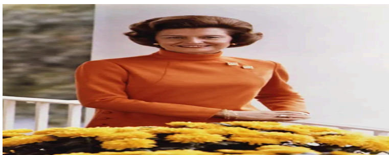
Betty Ford, službeni portret Prve dame iz 1974. godine

Dvije godine nakon svog oporavka, zajedno s prijateljem i susjedom ambasadorom Leonardom Firestoneom kojeg je i sama potaknula na liječenje suosnovala je Betty Ford Centar u Rancho Mirageu u Kaliforniji. Taj je centar postao jedan od najuglednijih centara za liječenje ovisnosti na svijetu, baziran na Minnesota modelu Dvanaest koraka. Centar je zamišljen kao sigurno utočište za sve – od običnih ljudi do slavni, gdje će svi biti tretirani jednako i bez posramljivanja. Kako je supruga američkog uglednog odvjetnika, kongresmena i potom predsjednika najmoćnije države na svijetu postala alkoholičarka?