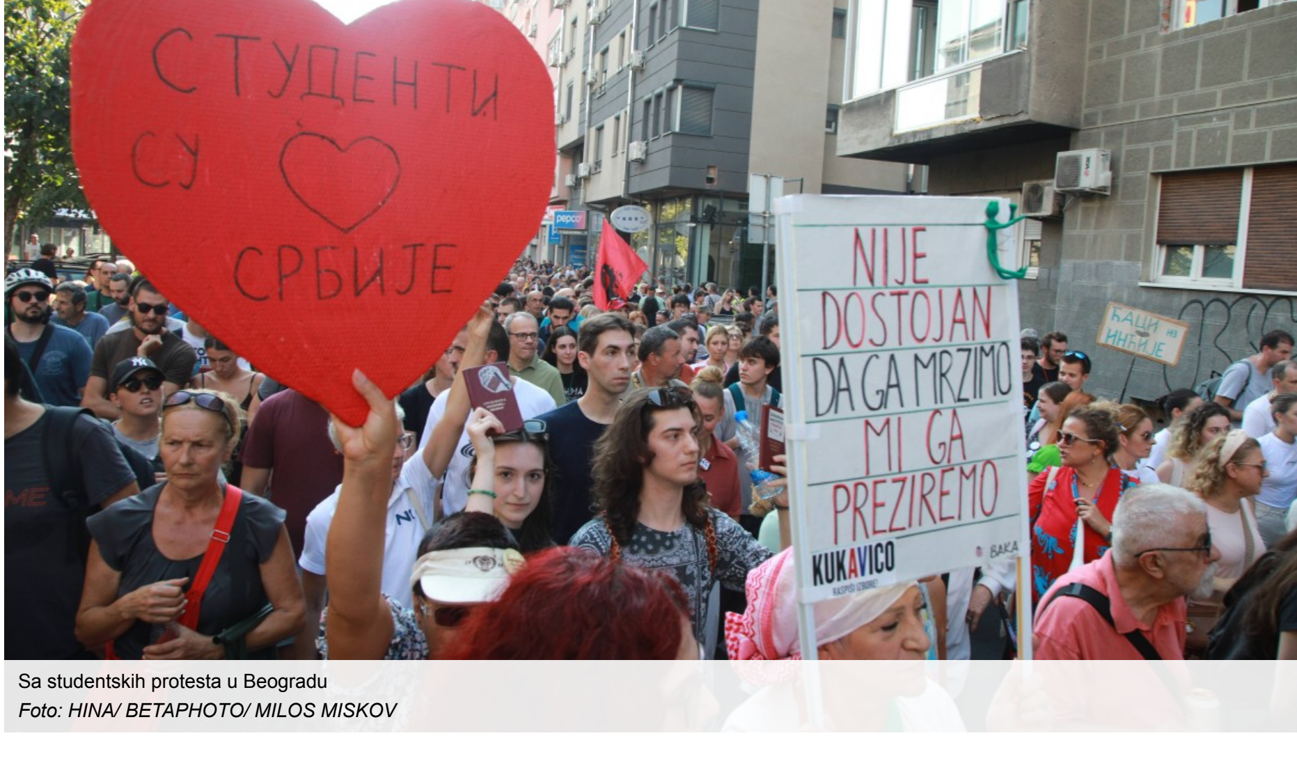
Sa studentskih protesta u Beogradu

Rade Dragojević | uto, 16/09/2025 - 15:08