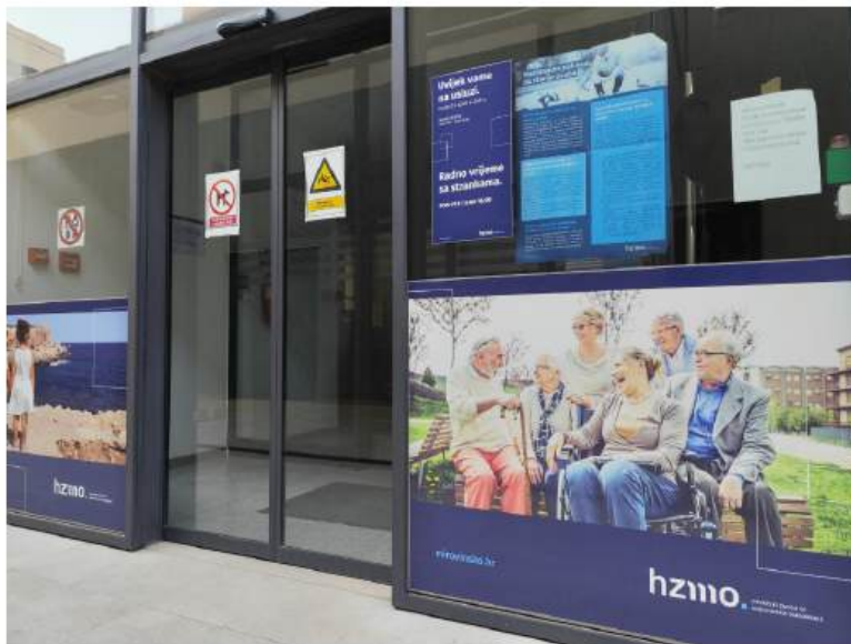
Senzorna vrata kao primjer univerzalnog dizajna. Hrvatski zavod za mirovinsko osiguranje, Područni ured Zadar

Cilj nije samo pomoći osobama s invaliditetom, nego ukloniti prepreke za sve moguće korisnike, neovisno o dobi, njihovim sposobnostima ili situaciji.