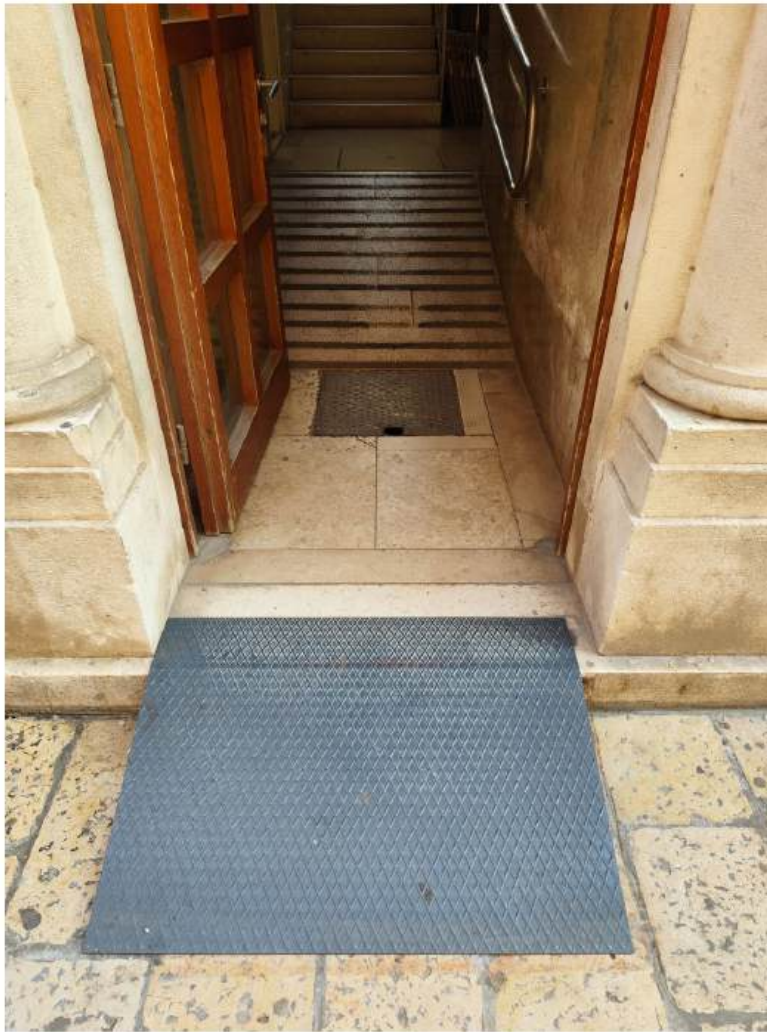
Razumna prilagodba: postavljanje kosine za svladavanje visinske razlike

Ova su dva načela predviđena i Konvencijom Ujedinjenih naroda o pravima osoba s invaliditetom . Ona je u Republici Hrvatskoj po svojoj pravnoj snazi iznad zakonskih i podzakonskih propisa, a ispod Ustava Republike Hrvatske. To je razlog više da se o tim načelima i takvim pristupima puno više zna nego što je sada slučaj.