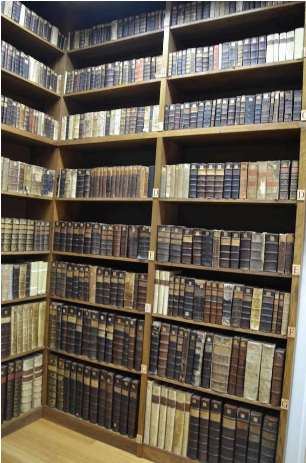
Knjižnica s vrijednim knjigama 16.-18.st.

Dio izložbenog fonda obuhvaća liturgijsko ruho i posude iz 18. i 19. stoljeća, kao i kipovi, slike, namještaj iz tog razdoblja. Samostan čuva i predmete iz kapele koju je plemićka obitelj Pejačević uredila u jednoj od kula virovitičke utvrde.