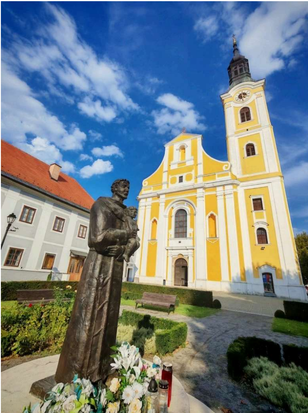
Crkva sv. Roka i franjevački samostan

Ne postoji točan podatak kada su došli, no pisani trag vodi u 1280. godinu. Riječ je o pismu koje je zagrebački biskup uputio mjesnom gvardijanu, pa tako možemo reći da su franjevci na ovim prostorima prisutni u kontinuitetu od 13. stoljeća, dakle praktično od početka franjevačkog reda. Tijekom burne hrvatske povijesti, zasigurno je najteži period bio onaj za vrijeme Osmanlijskih osvajanja od 1552. do 1684. U to vrijeme je ovim krajevima zavladao kuga. Ljudi pognani iz grada, kao i franjevci iz samostana spontano su dolazili do samostana kojeg su počeli rušiti i molili zagovor sv. Roka. Kada je kuga nestala, zavjetovali su se, da će sagraditi crkvu svecu u čast. Nakon normalizacije života, 1723. godine postavljen je kamen-temeljac za samostan, a 1746. za crkvu koja je sagrađena u gotovo rekordnu roku za to vrijeme, za svega šest godina. No, potres 1757. uzrokovao je velike štete, te se moralo pristupiti obnovi, te je nastavljeno unutarnje uređenje crkve.