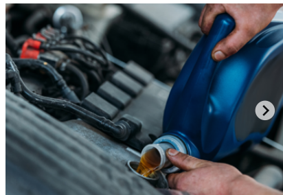
Datacol aditivi za gorivo