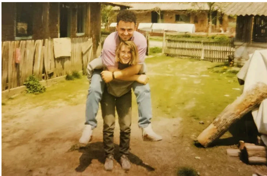
Bezбриžni dani mladosti, nisu ni sanjali da je rat opasno blizu

Tada sam volio heavy metal glazbu, bio sam metalac, nosio jaknu s bedževima AC/DC-a i Iron Maidena, obilazio koncerte i disco klubove. Kad bih s novim kazetama bendova došao za vikend u Zdence, bio sam glavna faca, ha ha! Prijatelji bi ih dolazili slušati, albumi su se presnimavali, svi zajedno bismo uživali.. Bila su to baš lijepa vremena, lijepa mladost.