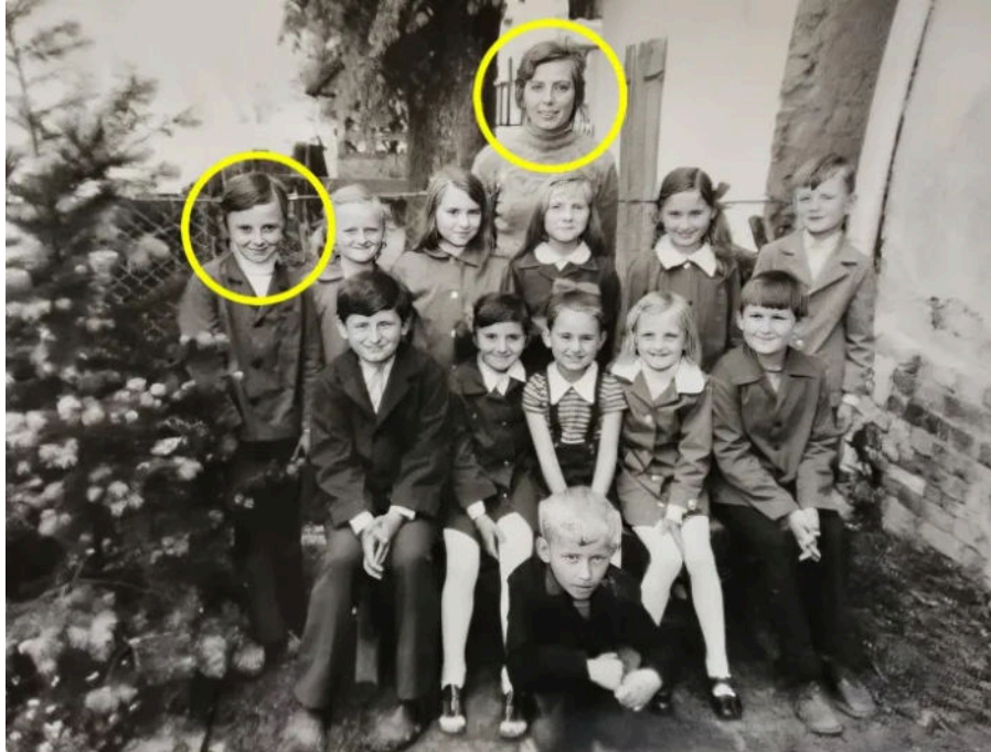
Fotografija iz osnovne škole u kojoj mu je majka bila učiteljica

Otac Milan je porijeklom iz Like, iz okolice Brinja. Radio je u Zdenki. Počeo je kao traktorist, a dogurao do vozača direktora. Zbog posla je često bio odsutan, putovao je po cijeloj bivšoj državi, ali i u Austriju i Švicarsku. Iako nije bio iz visokog društva, bio je pametan čovjek koji je upijao znanje od drugih. Od njega sam naučio bonton, kako se ponašati za stolom, čak i kako se jedu škampi i jastozi.