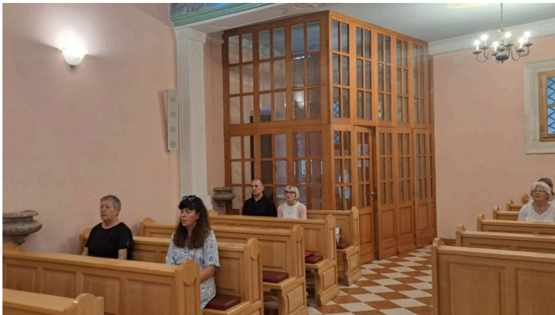
vjernici na nedjeljnoj misi u crkvi sv. Luce