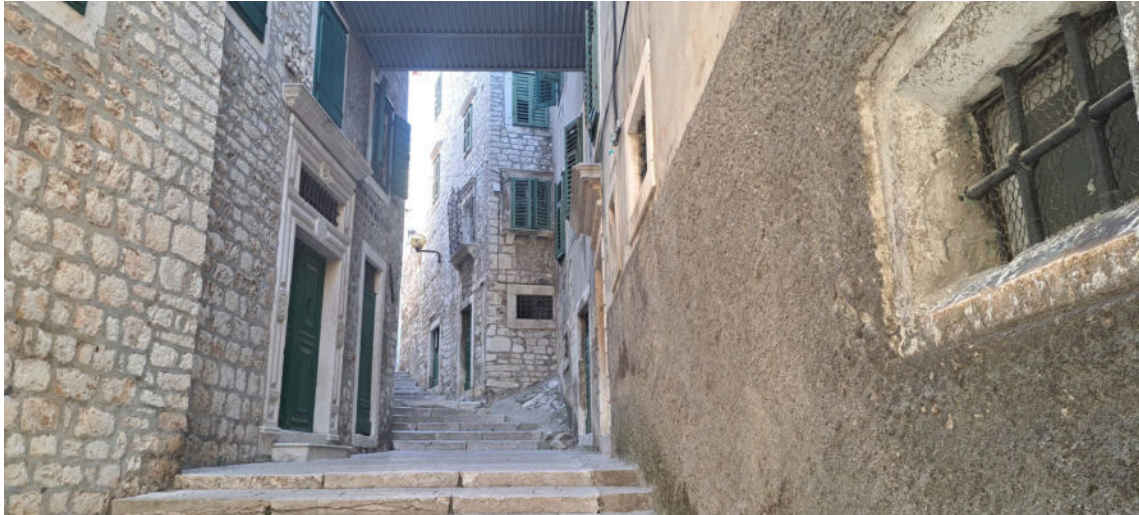
kompleks Samostana sv. Luce – ponos Šibenika

crkvi pjevao Lekcije, a nakon mise sestre su svećeniku i ministrantu poslužile čaj i prefine kolačiće.