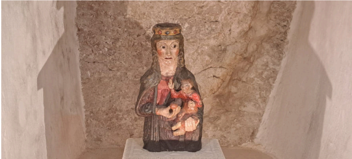
skulptura Bogorodice s Djetetom od terakote iz 13. ili 14. st.

našem velikom prijatelju i dobročinitelju. Zbog toga smo veoma blagoslovljene i sretne, kao i zbog ostalih vrijednih umjetnina koje se ondje nalaze.“