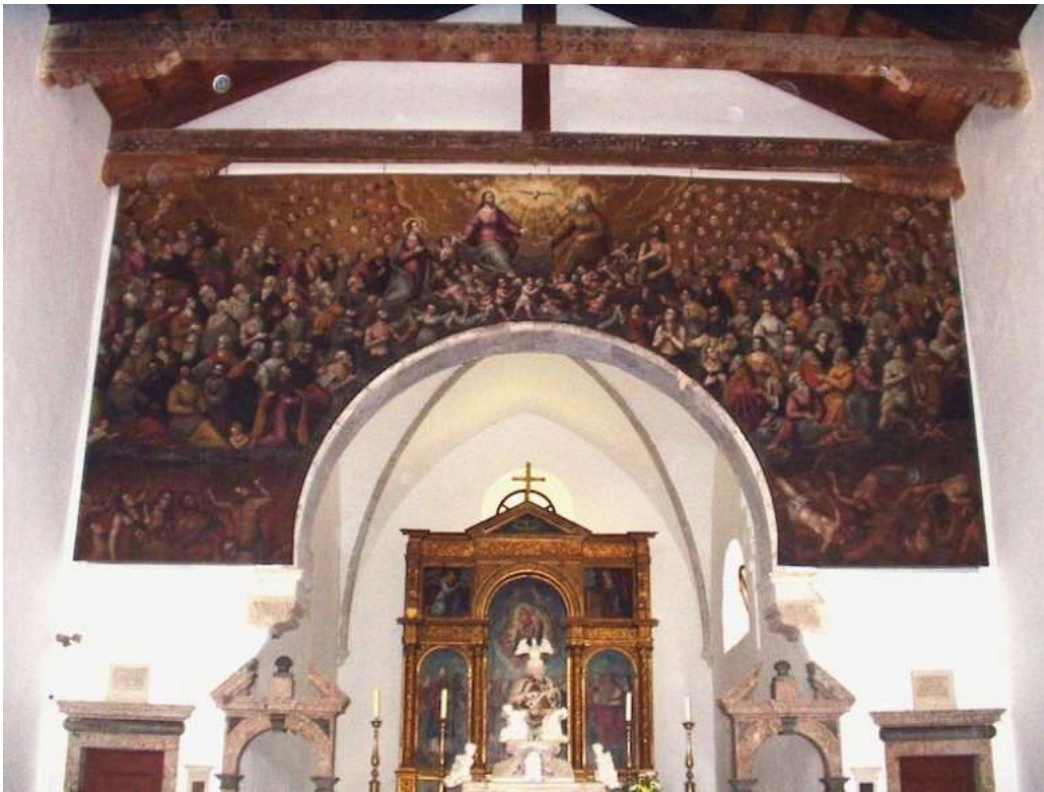
Glavni oltar u crkvi

Košljun čuva bogatu riznicu kulturnog i duhovnog nasljeđa. Samostanska knjižnica sadrži više od 30.000 knjiga i 100 inkunabula. Posebno valja istaknuti prvo izdanje latinskog prijevoda Ptolomejeva atlasa iz Venecije 1511. Knjižnica čuva jedan od ukupno tri sačuvana primjerka. Tu je i Strabonov atlas tiskan u Baselu 1571. Bogata je i glazbena zbirka s unikatima koji potječu iz 11. stoljeća.