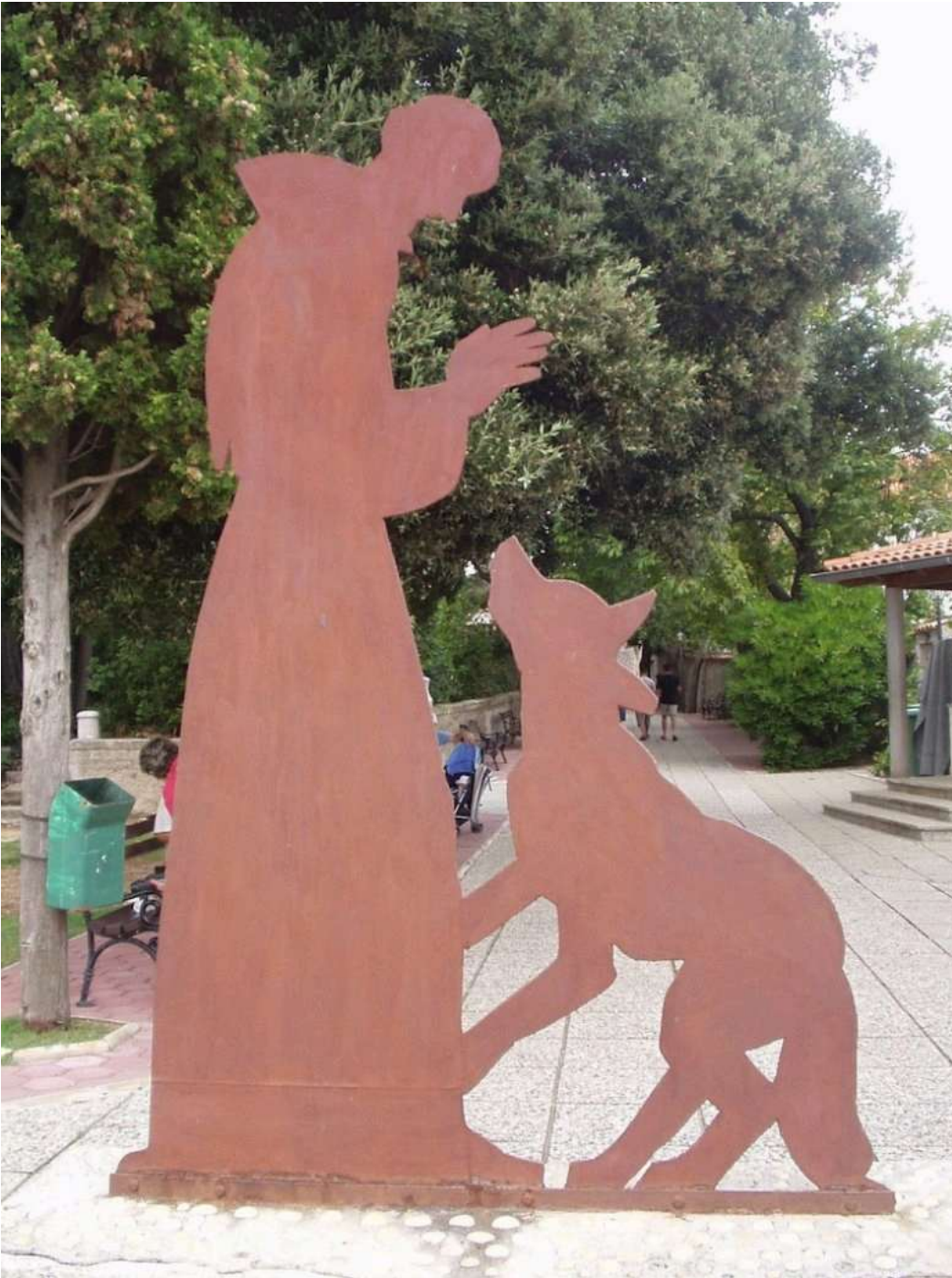
Sv. Franjo i vuk