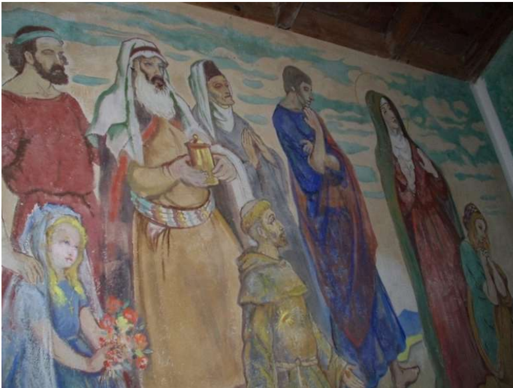
Kapela sv. Franje