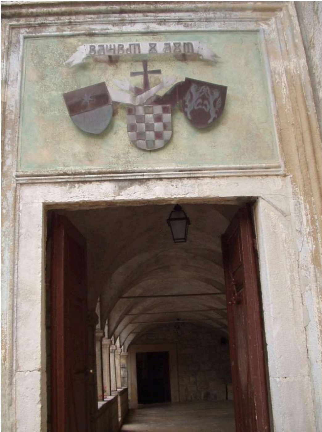
Ulaz u samostan

U crkvi Navještenja Marijina nad glavnim oltarom nalazi se djelo Francesca Ughetta (1653.). Riječ je o slici na platnu širokoj 10, a visokoj 4,6 m koja prikazuje raj, čistilište i pakao. Na samom oltaru je poliptih Girolama da Santacrocea (1535.). Uz crkvu, tu su i tri kapele. Prva od njih je Kapela Porođenja s jaslicama koje se prvi put spominju 1651. U njoj se nalaze jasllice, te su prve najstarije očuvane jasllice u Hrvatskoj. Hrvatska je pošta 1991. godine izdala prigodnu marku s prigodnom omotnicom s prikazom košljunskih jasllica. U kapeli Svetoga križa čašćeno je čudotvorno raspelo koje je proplakalo 25. ožujka 1723., a koje je nošeno u procesijama za kišu. Ono se danas čuva u sakralnoj zbirci. Kapela i križ prvi put se spominju 1579., a kapelu je 1976. oslikao freskama hrvatski slikar Bruno Bulić (7. prosinca 1903.-26. studenoga 1990.). Treća kapela je posvećena sv. Franji (1654.), koju je 1964. godine također freskama iz svečeva života, a među likovima je smjestio i franjevece koji su tada živjeli na Košljunu oslikao Bulić. Na otočiću je i Lurdska spilja podignuta 1914. godine. Autor Križnoga puta je Ivo Dulčić. Zanimljivo je posjetiti i groblje.