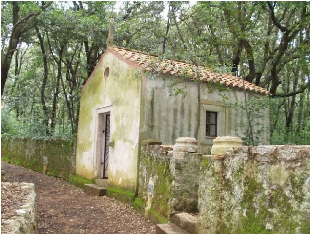
Kapela Svetoga Križa