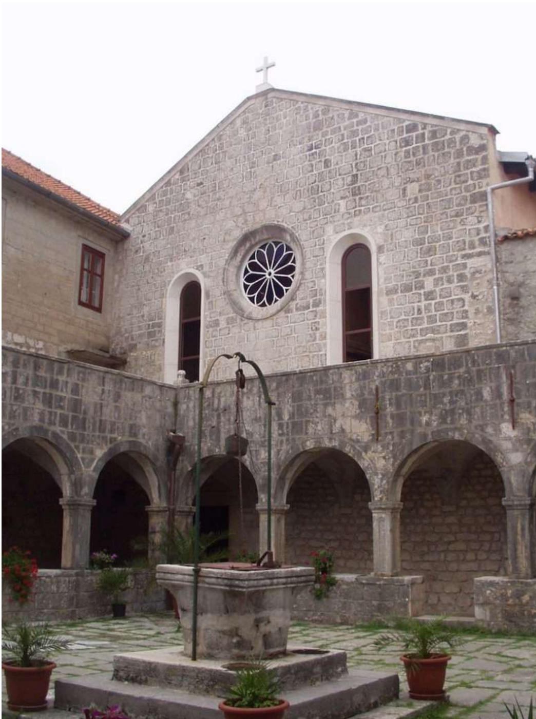
Klaustar s gušternom

Otok je gotovo u cijelosti prekriven šumom. U hladu hrastova, borova i mirisne mirte vode staze koje pozivaju na tišinu. Svaki korak postaje molitva, svaki dah - zahvalnost. More koje oplakuje Košljun mijenja boje ovisno o svjetlu, ali njegov mir ostaje isti. Ponekad je moguće vidjeti redovnika kako u tišini korača šumskim putem, s krunicom u ruci - prizor koji podsjeća na davne pustinske oce. Fra Bernard Antun Barčić (22. rujna 1910.- 3. svibnja 2016.), franjevac, prevoditelj, profesor prirodoslovnih znanosti zabilježio je ovdje 540 vrsti biljaka iz 111 porodica. K tome pronašao je i 151 vrstu gljiva iz 33 porodice.