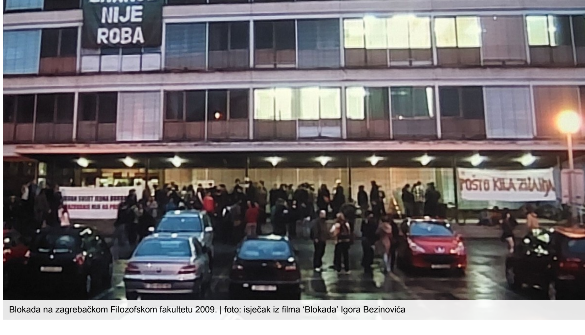
Blokada na zagrebačkom Filozofskom fakultetu 2009.

Rade Dragojević | čet, 13/11/2025 - 09:31