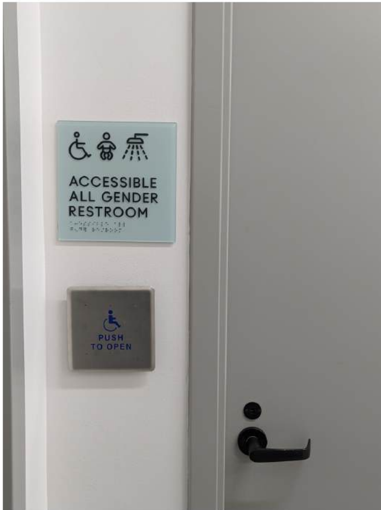
Toaleti u rekonstruiranoj zgradi LOVE u Detroitu, projekt američke arhitektonske tvrtke Quinn Evans

Praksa je dokazala kako, u najvećem broju slučajeva, rješenja koja omogućuju neku aktivnost osobama koje je ranije nisu mogle obavljati, zapravo olakšavaju istu aktivnost i većini ostalih korisnika, ili u najmanju ruku nude izbor različitih načina obavljanja aktivnosti. Recimo, pristupna rampa namijenjena korisnicima invalidskih kolica uvelike će olakšati kretanje i roditeljima s dječjim kolicima, putnicima s koferima ili osobama koje se vraćaju iz kupovine s torbama na kotače.