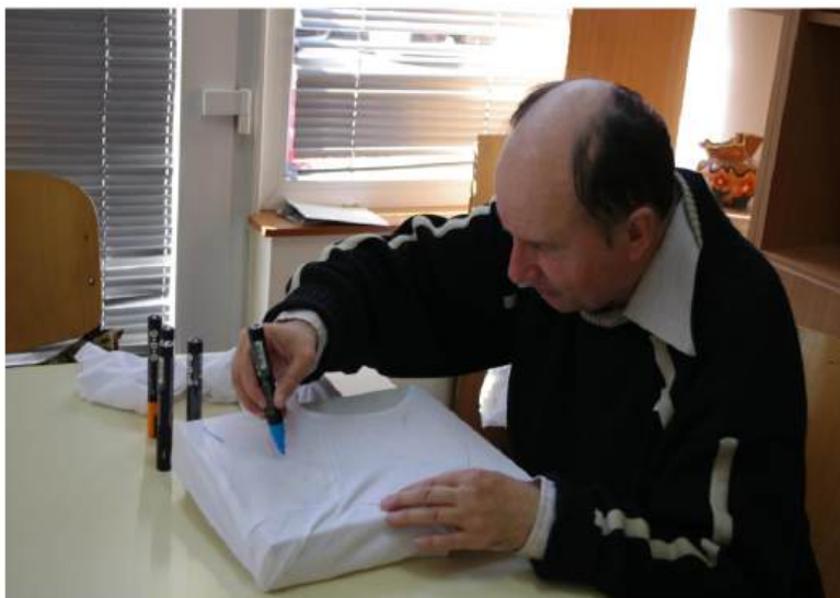
Razumijevanje i vrednovanje različitosti: međunarodna radionica inkluzivnog dizajna Extra/Ordinary Design

Odgojeni smo i živimo u kulturološkom kontekstu koji osobe drugačije od prosjeka vrednuje prvenstveno prema tom negativnom odmaku od prosjeka, odnosno prema invaliditetu, poteškoćama i nemogućnostima, a zanemaruje da ista osoba istovremeno ima i neke druge potencijale, talente i vještine. Meni osobno najdraži primjer koji to demonstrira je projekt Goodwill , koji je dokazao kako osobe s intelektualnim poteškoćama itekako mogu biti konkurentne na tržištu rada jer ponavljajuće aktivnosti izvode s daleko većom preciznošću od prosječnih osoba.