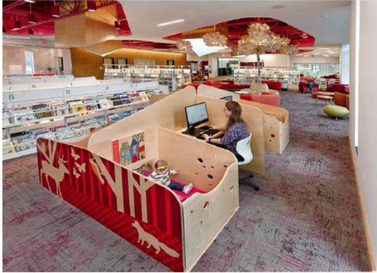
Radna jedinica koju su osmislili Quinn Evans tim i TMC Furniture olakšava odraslim korisnicima boravak i korištenje usluga Fairfield knjižnice u pratnji male djece

projektant samostalno projektira i donosi sve odluke, eventualno uključujući buduće korisnike u završnu fazu evaluacije i dorade rješenja. U inkluzivnom pristupu čitav proces je participativan – ljudi kao korisnici i zainteresirani sudionici sudjeluju u radu kreativnog tima kao stručnjaci.