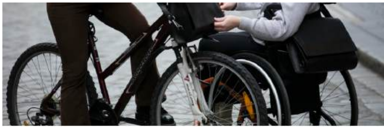
Torba 2u1, dizajn Sanja Bencetić, Irena Rački, Anica Korak

Identitet svake osobe zapravo je vrlo važan u inkluzivnom pristupu.