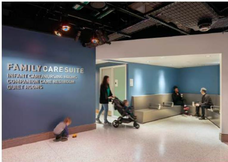
U sklopu Nacionalnog muzeja zrakoplovstva i astronautike Quinn Evans tim osmislio je prostorije za potrebe roditelja s djecom, "tihe sobe" za senzorno osjetljive osobe i toalet s pomagalicama za osobe s invaliditetom i smanjene pokretljivosti

Kao korisnu literaturu preporučila bih brošuru Design Council-a The Principles of inclusive design u kojoj su objašnjena načela inkluzivnog pristupa za arhitekta, dok su u svojoj drugoj brošuri Inclusion by design sjajno predstavili primjere projekata koji su nastali takvom metodologijom.