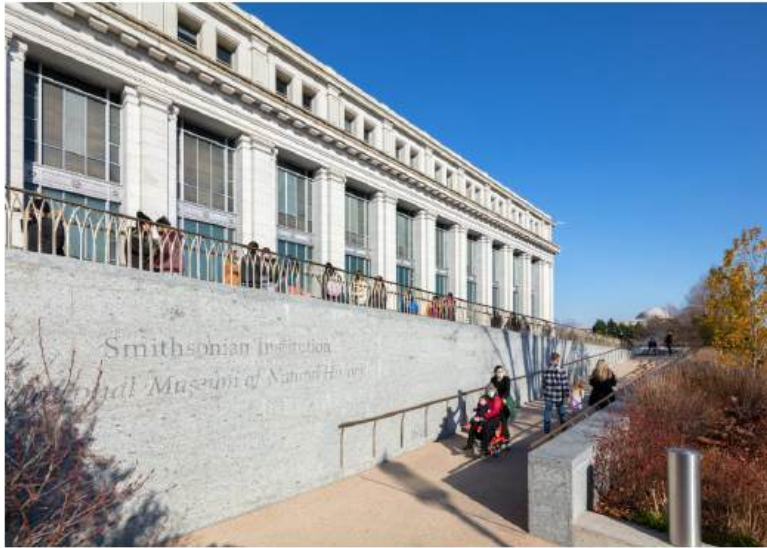
Dizajn za sve: južni ulaz u zgradu Nacionalnog prirodoslovnog muzeja u Washingtonu; dizajn Quinn Evans

posebne skupine korisnika, dok inkluzivni dizajn uzima u obzir sve isključene (tjelesno, senzorički, ekonomski, kulturološki...) i sve za koje rješenje može biti negativno ili opasno, odnosno ne dijeli ljude na skupine, već se bavi različitim načinima korištenja.