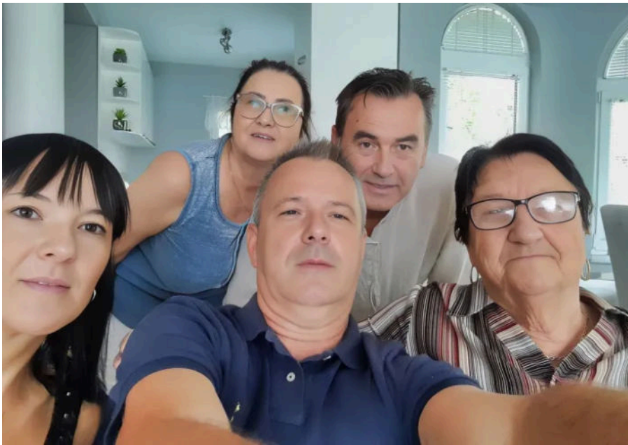
Edim s obitelji i suprugom

Jedan brat od moje majke ubijen je na kućnom pragu, bio je '49. godište. Drugi brat je bio direktor Privredne banke, on je odvezen u logore gdje je proveo 18 mjeseci. Stariji brat je bio ranjen prilikom napada na doboj 1993. godine. Od tetke dva sina i teta su bili godinu i dva mjeseca u zarobljeništvu. Dvije tetke su prognane iz Doboja gdje im je oduzeta sva njihova imovina. Tako da, bez razlike što sam tu svaki dan nosio glavu u torbi u Hrvatskoj, moje srce je bilo stalno s mojima, 18 mjeseci nisam znao za njih, tada nije bilo moguće uspostaviti komunikaciju. Nakon potpisivanja Dayton, prvi puta sam se sreo s njima nakon šest godina.