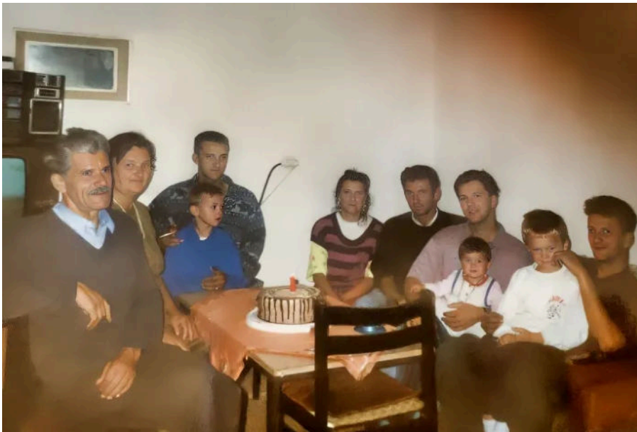
Edim s svojom obitelji (drugi s desna)

Dok smo bili djeca, osim igre smo i radili jer je bilo puno posla. S obzirom da nas je bilo troje braće brata, a otac je dolazio vikendom i imao poslove u građevini, mi smo kao djeca išli s njim raditi. Nismo morali, htjeli smo. I to nam je bio užitak jer bismo nešto i zaradili pa bismo na kraju školskih praznika od zarađenog novca kupili sebi nešto za školu, torbu ili knjige. Druga su to vremena bila, mi smo kao djeca voljeli sami sebi riješiti neke stvari, današnja djeca to sve očekuju od roditelja.