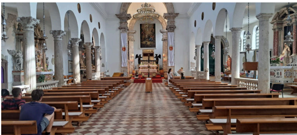
Unutrašnjost župne crkve i svetišta sv. Šime

Kršćanski muževi primjećuju potrebu svjedoka koji će ih oblikovati u današnjem vremenu: strpljivošću i slušanjem Božje Riječi, ali i aktivnom prisutnosti onih vrijednosti koje žele živjeti u svom životu.“