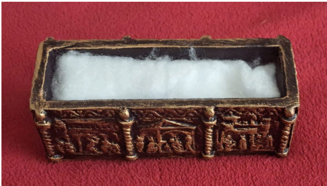
mini replika škrinje sv. Šime i pamuk prethodno položen na relikviju svečeva tijela

„Sve što je našem životu važno, zapravo je blizu. Doći i vidjeti tijelo sv. Šime i dobiti opipljiv predmet, a to je pamuk kojeg položimo na relikviju tijela. Ta uspomena čovjeka vraća, da susret ne prestane. Čovjek vjeruje da će ga svetac uslišiti.