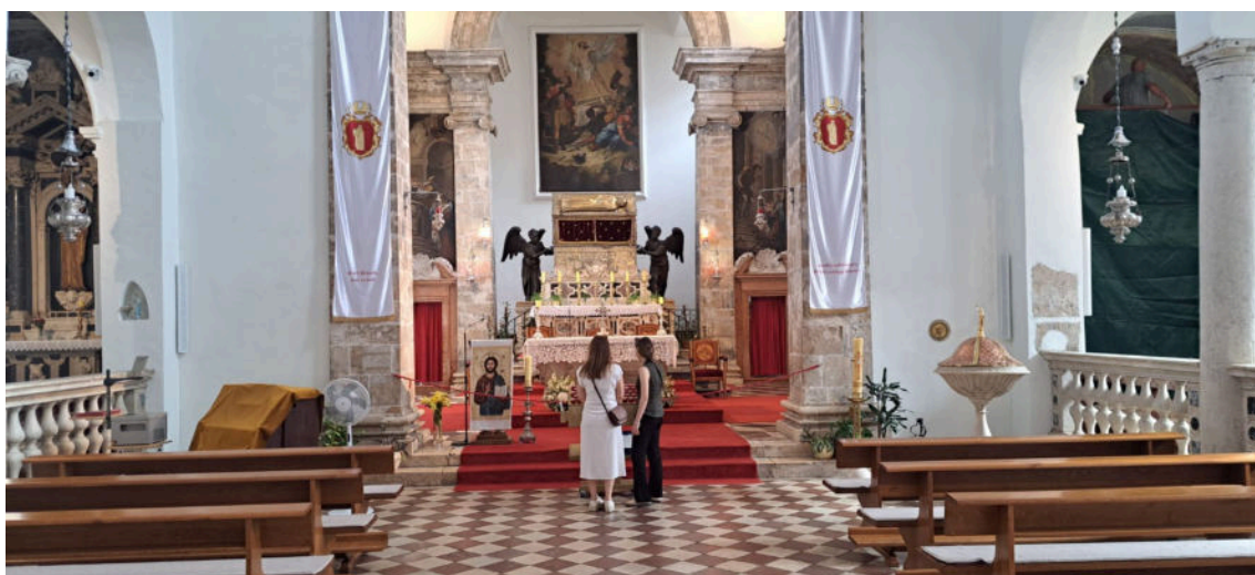
Oči posjetitelja uprte u sarkofag sveca zaštitnika

Jesu li potrebe hodočasnika koji dolaze izvana i domaćeg puka jednake? Koliko su i župni suradnici otvoreni prema hodočasniciima?