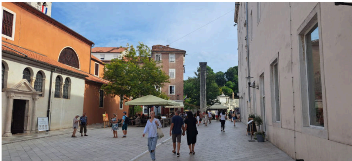
na zadarskom Forumu, pored rimskog stupa sramote, crkva sv. Šime kao ponos

Čime ova župna zajednica pokazuje svoju otvorenost za svakoga? Treba li pokrenuti poseban pastoral, odgoj, kako ljudi ne bi tvrdili da vide Boga, a okreću glavu od bližnjega svoga?