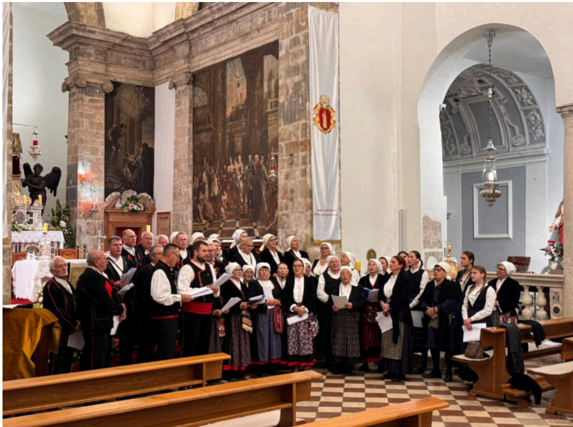
KUD-ovi iz Rtine, Ražanca i Radovina

„Valja znati da sveti Šime ovdje predstavlja osamstoljetnu tradiciju. Da ga nema, izostali bi trenutci dolaska hodočasnika, ne bi se pamtio dolazak vladara i knezova koji su se zaklinjali pred relikvijom. Izostale bi mnoge umjetničke djelatnosti. Izostao bi svetac okrunjen najljepšom relikvijom na Jadranu, a vjerojatno i na Mediteranu. Izostalo bi svjedočanstvo pobožnosti vladara koji su se u povijesti zagledali u likove svetaca od kojih su se nadali uslišanju ili spasenju.