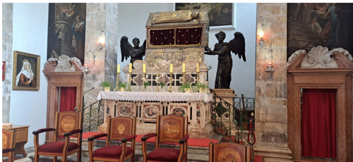
sv. Šime i sv. Hedviga – moćni zagovornici

Biti čuvar tijela svetog Šimuna nadilazi dosadašnje iskustvo koje sam kao župnik i profesor na fakultetu i kao tajnik nadbiskupa stjecao kroz protekle godine. Moram priznati da ovo mjesto i ovo poslanje budi u egzistencijalnom smislu čovjekovu čežnju za onim temeljnim poslanjem, a to je biti blizu Gospodinu. Šušur Jeruzalemskog hrama stvarnost je koja se preslikava na ovo mjesto, a poslanje moje kao i mojih suradnika je prepoznati u tom mnoštvu Mesiju i njegovo djelo.“