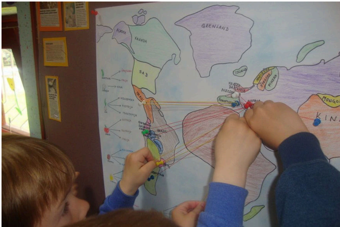
Važna je pravilna edukacija od malih nogu