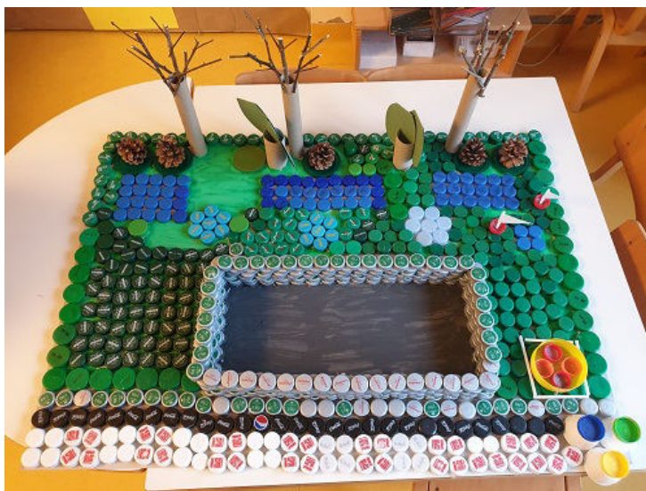
Rad djece iz Dječjeg vrtića En ten tini iz Sesveta

Sve aktivnosti moraju biti dokumentirane u online aplikaciji i verificirane od strane nacionalnog koordinatora. Kada škola pokaže da je u potpunosti provela program, dodjeljuje joj se povelja i međunarodno priznati simbol zelena zastava sa znakom Ekoškole. Status vrijedi dvije godine, nakon čega slijedi obnova. U postupku obnove škola mora dokazati da je otišla korak dalje, razvila nove projekte, proširila teme i uključila širu zajednicu.