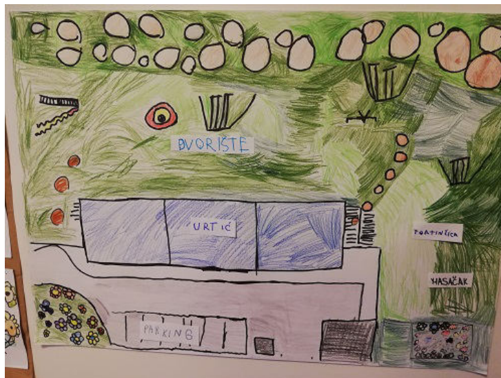
Jedan od dječjih radova na temu održivosti

Unatoč svemu, iskustva pokazuju da kada se odgoj i obrazovanje za zaštitu okoliša i održivi razvoj uključi u svakodnevni život škole kroz školske vrtove, eko patrole i obilježavanje eko datuma djeca rado sudjeluju i razvijaju trajne navike koje prenose i izvan škole", pojašnjavaju nam iz Udruge.