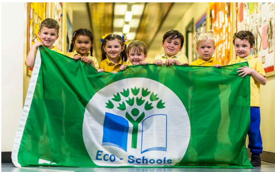
Djeca kopiraju navike odraslih

“U Hrvatskoj imamo 170 osnovnih škola i 39 srednjih škola s aktivnim statusom Ekoškole što pokazuje da su značajno više uključene osnovne škole. Osnovne škole imaju više prostora za izvanastavne aktivnosti i projektni rad, dok su srednje škole snažnije usmjerene na predmetni program i pripremu za državnu maturu ili struku, pa je teže pronaći dovoljno vremena za dodatne sadržaje”, pojašnjavaju nam iz Udruge.