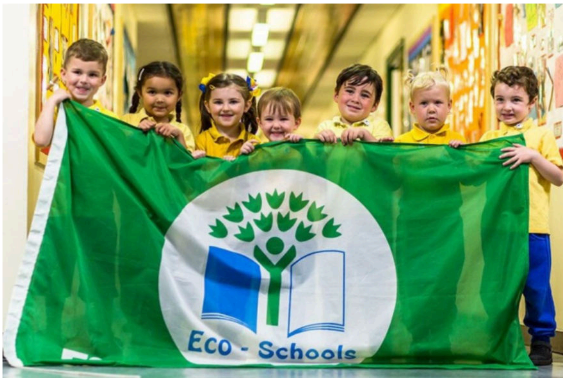
Djeca kopiraju navike odraslih

Objavio Daniela Delale - Utorak, 30. rujna 2025. u 11:31