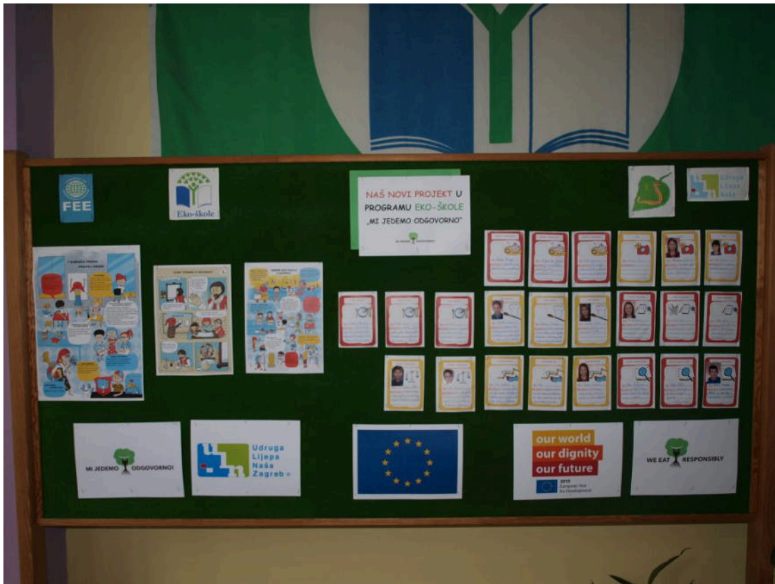
Izložba dječjih radova na temu održivosti