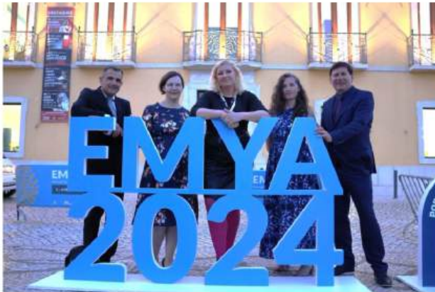
Na dodjeli nagrade Europski muzej godine

Tako je. Bila su dva suca. Prvi je došao anonimno, kao posjetitelj, i mi nikada nismo saznali o kome se radilo. Druga sutkinja koja nas je posjetila je bila gospođa Agnes Aljas iz Estonije i s njom smo proveli čitav radni dan. Održali smo razgled muzeja, prezentaciju edukativnih radionica koje radimo s djecom..., došla je s brdom pitanja na koje je trebalo odgovarati, a presudan za finale bio je upravo naš angažman u lokalnoj zajednici i socijalna uključivost.