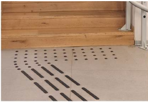
Na prijelazu iz suvenirnice prema kafiću nalaze se stepenice na koje je ugrađena podizna rampa kako bi se posjetiteljima s poteškoćama u kretanju omogućio pristup