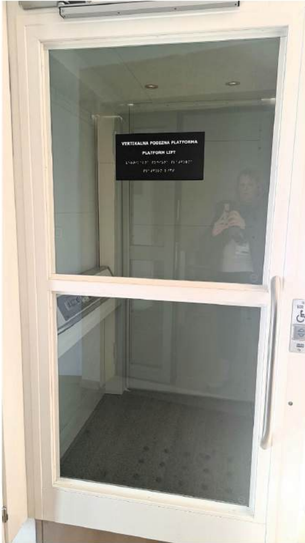
Za lakše kretanje unutar muzeja ugrađen je lift za četiri osobe kojim se mogu služiti svi posjetitelji s poteškoćama u kretanju