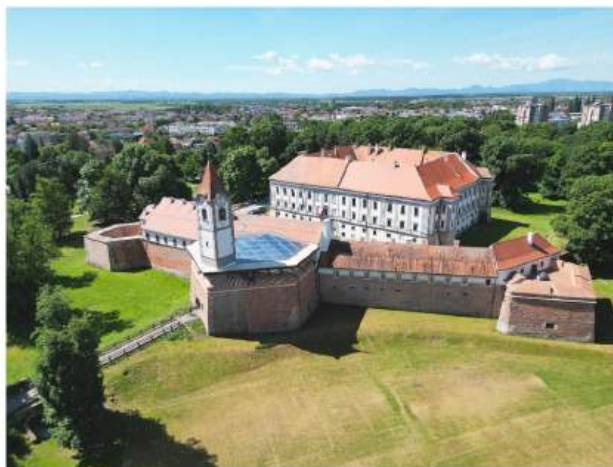
Riznica Međimurja djeluje kao muzejska jedinica Muzeja Međimurja Čakovec, a nalazi se u sklopu fortifikacije Stari grad Čakovec

Riznica Međimurja djeluje od 2021. kao muzejska jedinica u sastavu Muzeja Međimurja Čakovec. Nastala je u sklopu EU projekta "Rekonstrukcija i revitalizacija fortifikacije Starog grada Čakovec u Muzej nematerijalne baštine". U svom radu orijentirana je na očuvanje, interpretaciju i promociju međimurske baštine, obuhvaćajući nasljeđe, tradiciju, usmenu predaju, znanja i vještine.