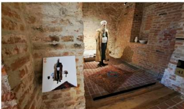
Lik Mustaj-bega Hasumovića u reljefno-taktilnom prikazu s oznakama za audiovođač

Mi i dalje svake godine šaljem naše muzejsko osoblje k njima na edukacije. I dalje se usavršavamo, a od prošle godine sudjelujemo u programu „Pristupačnost za sve“ koji se provodi na nacionalnoj razini.