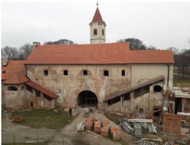
Radovi na rekonstrukciji fortifikacije