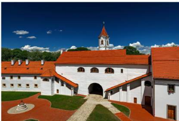
Riznica Medimurja 2021. po završetku radova

Na projektu se izmjenjivo nekoliko projekatana, a samonja je ona intenzivna i zahtjevna. Tijekom trajanja projekta od 2017. – 2021., jednom tjedno smo se sastajali kao tim koji razvija koncept stalnog postava i jednom tjedno kao koordinacijski tim gradilišta s izvođačima radova i konzervatorima.