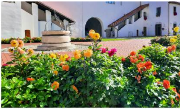
Riznica Međimurja