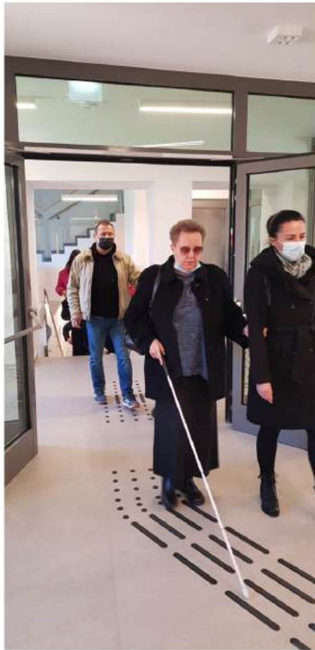
Članovi Udruge slijepih Međimarske županije u prvom posjetu Riznici Međimurja

Fascinirala nas je činjenica koju smo saznali u hodu, a to je da vrlo mali postotak slijepih i slabovidnih čita Brailleovo pismo! Mi smo mislili da smo upotrebom brajice riješili problem s opisom muzejskih postava, no ipak nismo bili u pravu. Kako je većina njih izgubila vid u drugoj polovici života i nisu kao djeca učili brajicu, oni je nikada niti nisu naučili.