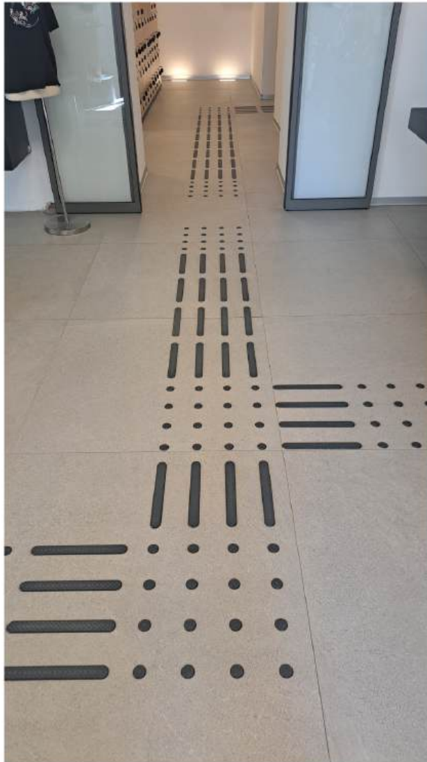
Po cijelom kompleksu i muzeju postavljene su linije vodilje koje vode slijepce i slabovidne posjetitelje predviđenim smjerom kretanja

Puno puta smo nakon posjete bili žalosni i konstatirali smo da ćemo te greške ispraviti ako se ukaže prilika. Prilika se ukazala, kompletna fortifikacija išla je u sanacijsku obnovu i shvatili smo da smo u poziciji kada možemo isplanirati sve naše želje i pogodnosti za buduće posjetitelje. Tako je i bilo.