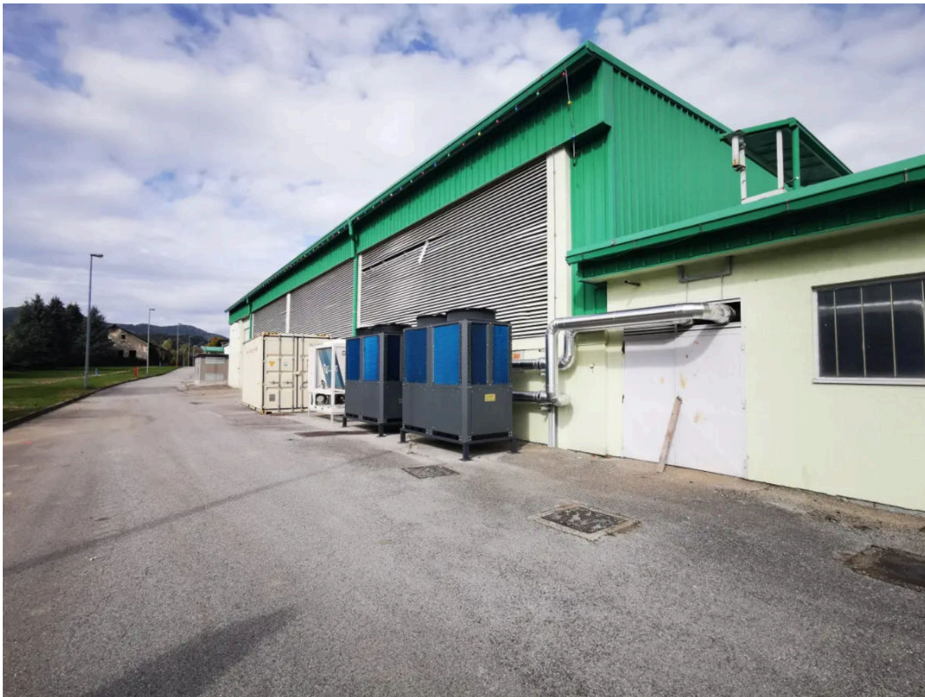
Jozinović negira tezu da se u Podrutama radila rekonstrukcija postrojenja