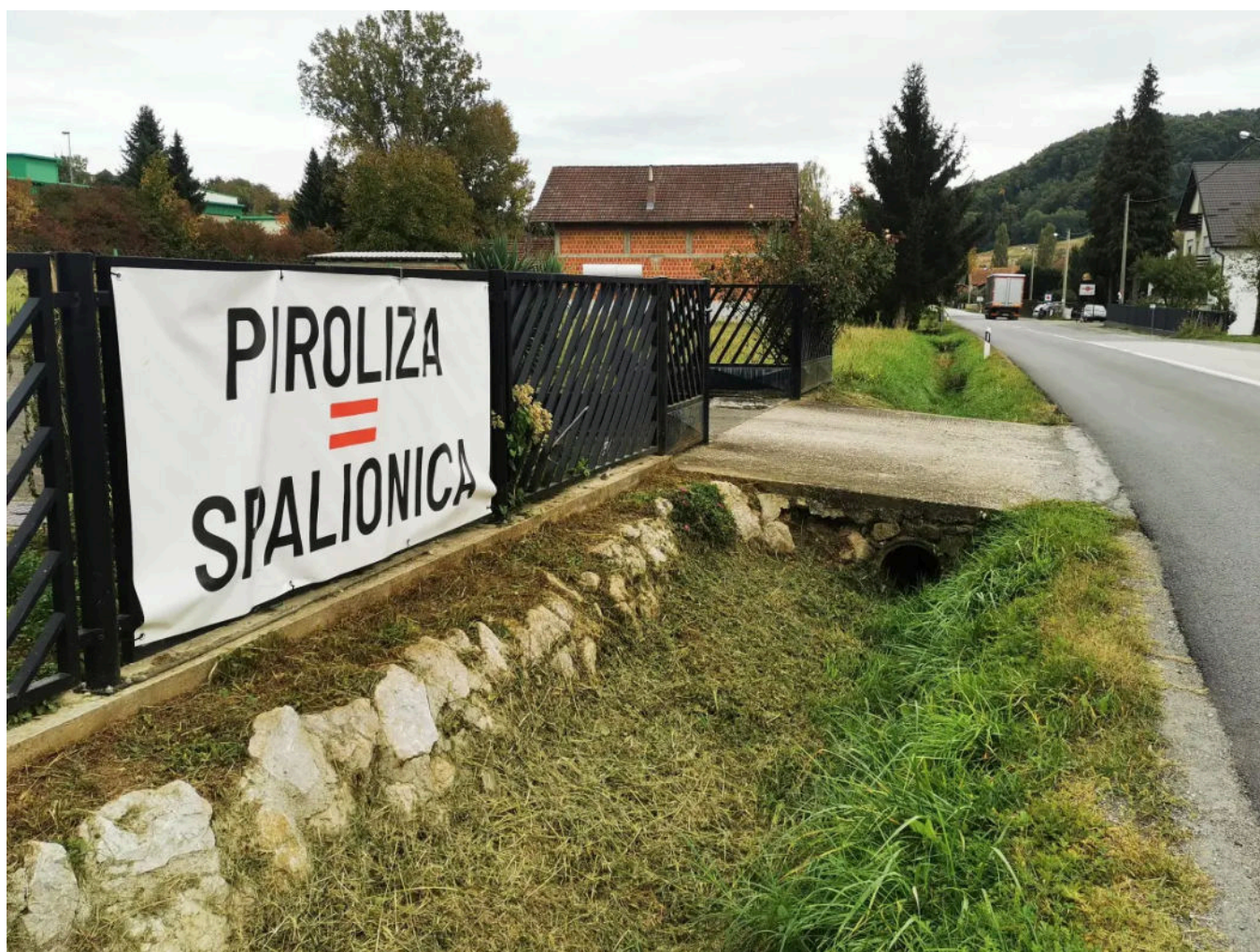
Podrute su pune transparenata protiv najavljenog postrojenja

– Nije to neka nakupina... Nije to neka sirotinja... To su izrazito ozbiljni ljudi. Iza njih stoji američka vlada – dao je, u spomenutoj emisiji na Radiju Novi Marof , Jenkač svoje viđenje tvrtke koja investira u Podrutama. Pridodao je i zanimljiv detalj: – Jedan od suvlasnika je obitelj Hunt , po kojoj je snimana serija Dallas .