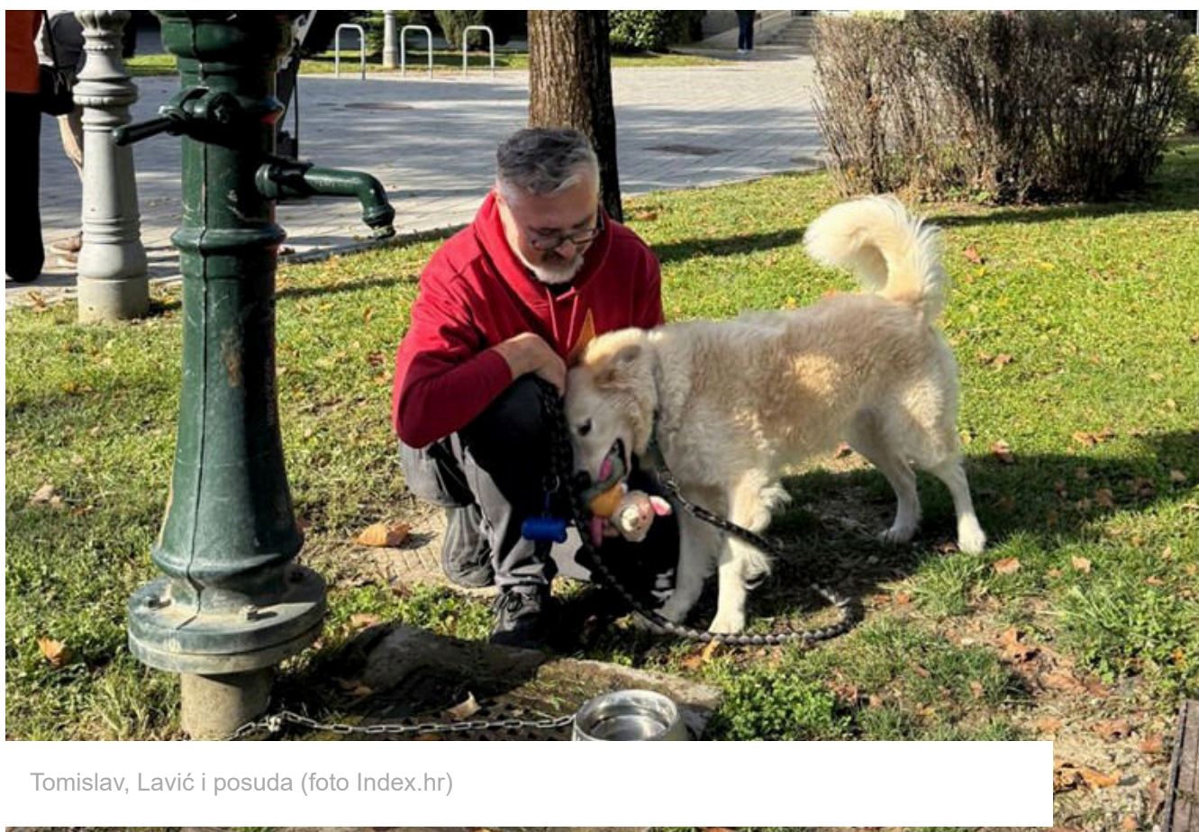
Tomislav, Lavić i posuda

Uglavnom, ideja je da svaka posudica nosi ime nekog lokalnog ljubimca, pa trenutačno na području Zagreba ima 36 zdjelica: 35 nosi ime jednog psa, a 36. je dobila ime po zasad jedinoj mački .