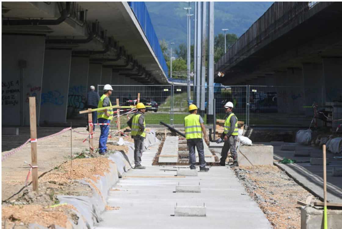
Radovi na Sarajevskoj

Na internetskoj stranici ove udruge postoji i obrazac putem kojeg građani mogu prijaviti svoj problem, a također i vidjeti s kojim se sve problemima suočavaju njihovi sugrađani pa u slučaju da misle kako su sami „ludi“ jer im smeta neki oblik buke , jasno mogu vidjeti da nisu jedini i da je normalno da im tako nešto smeta. Tako se može vidjeti da su građani prijavljivali susjedsku buku, buku crkvenih zvona, kao i buku prometa, kafića, zvučne signalizacije te ostale oblike buke.