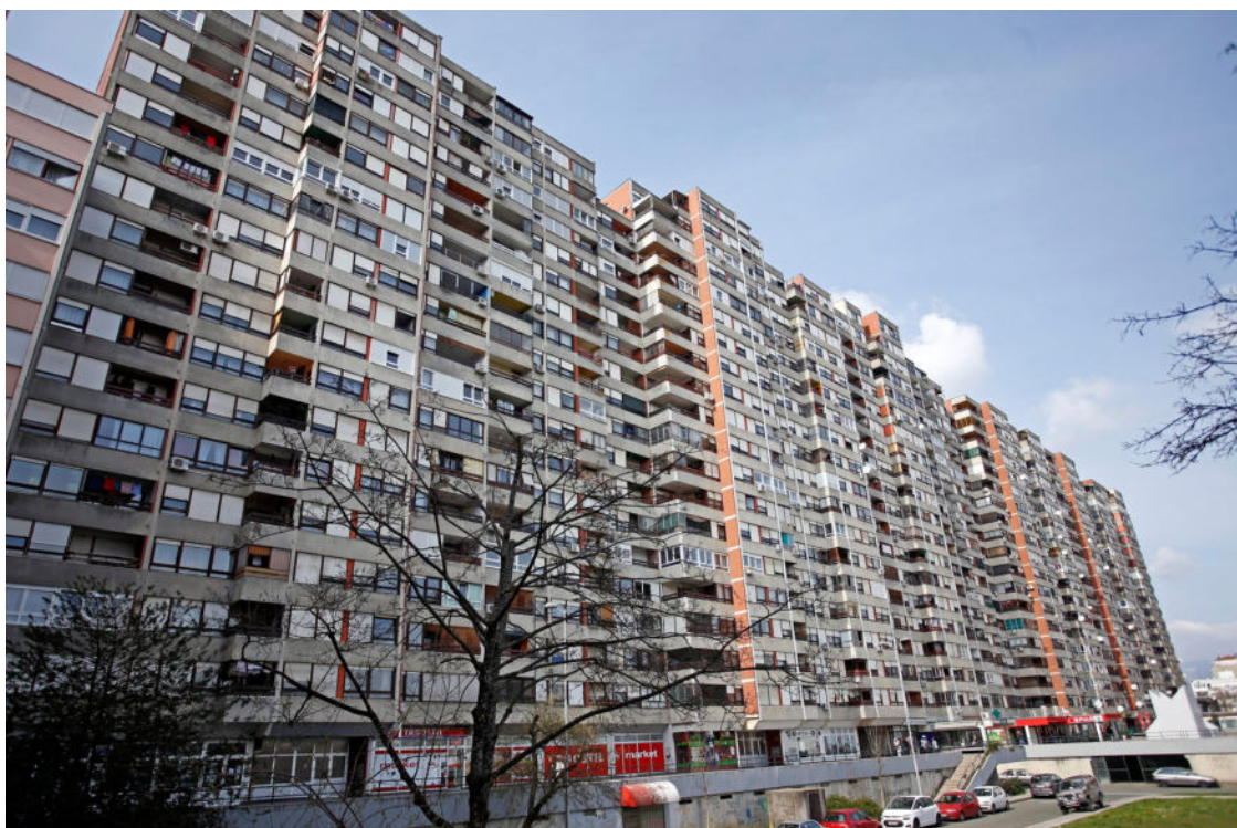
Mamutica, ilustracija

“Za život u zgradama potrebna je ogromna količina tolerancije prema susjedima jer inače taj suživot vodi u stres, a to nikako nije dobro za naše zdravlje”, tvrdi naša sugovornica. A da je tako, pokazuje i činjenica kako nam se tijekom neželjene buke aktiviraju hormoni stresa, raste nam krvni tlak, a to sve utječe na čitav niz povezanih bolesti koje mogu znatno ugroziti naše zdravlje.