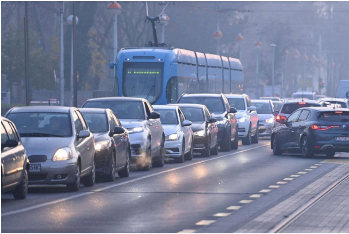
Promet u Zagrebu