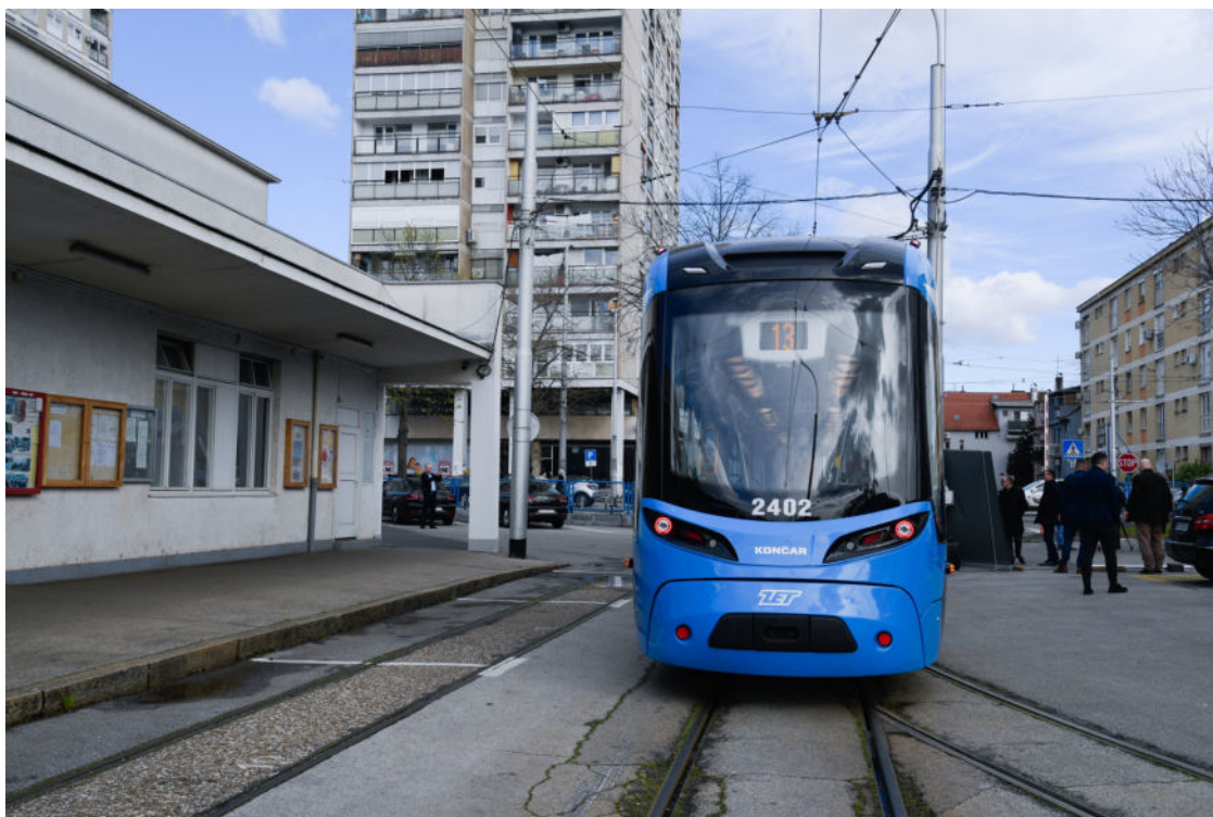
ZET ilustracija

Buka gradilišta česta je u stambenim zonama. Dopusštena razina je 65 dB(A) danju i navečer, s mogućim kratkotrajnim prekoračenjem, dok su noćni radovi strogo ograničeni. Buka iz susjedstva odnosi se na buku uzrokovanu ljudskim aktivnostima u stanovima (glazba, uređaji, zabave). Uređena je Zakonom o prekršajima protiv javnog reda i mira, a nadzor provodi policija.