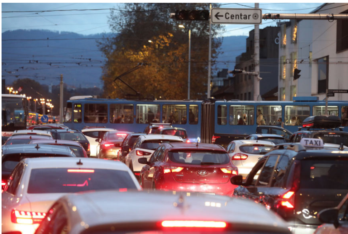
Promet u Zagrebu

Osim toga, zvučne vibracije mogu utjecati na organizme u tlu, poput bakterija i gljiva, a promjene u njihovim zajednicama dugoročno se odražavaju na plodnost tla i zdravlje biljaka.