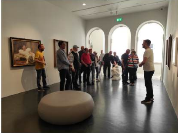
Članovi udruge i njihovi prijatelji iz Šibenika u obilasku izložbe u Providurovoj palači

„Prvi put kada sam u nekom nepoznatom prostoru, to je strašno. Stojim i čekam da mi netko pomogne. Ali onda, ako se nekoliko puta ponovno zateknem u tom istom prostoru, polako se već mogu kretati po nekom osjećaju. Tu sam zapela prvi put, ovo mi je ondje..., počnem se polako privikavati.“