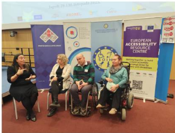
Prevoditelji znakovnog jezika omogućuju osobama oštećena sluha ravnopravno sudjelovanje u društvu te pristup informacijama na hrvatskom znakovnom jeziku

Uz svu modernu tehnologiju koja im donekle olakšava komunikaciju, njima je bitna živa osoba pored njih, bila ona tumač, prevoditelj, ističe.