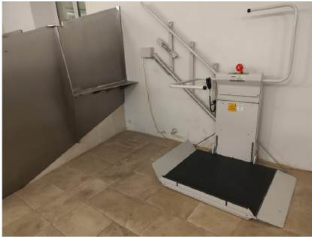
Podizna platforma u Providarovej palači