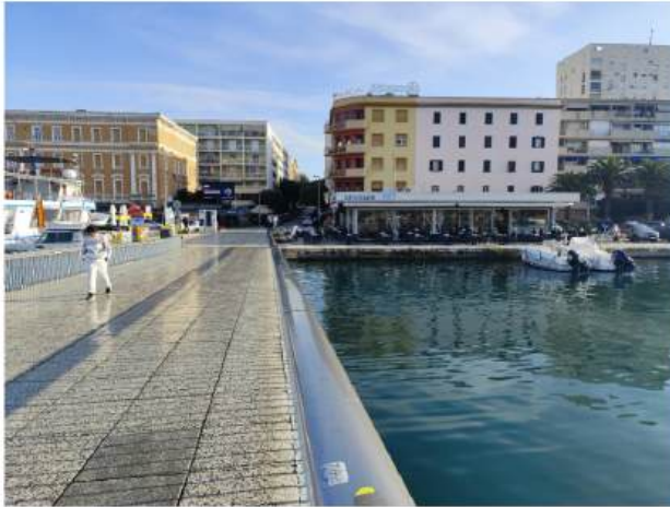
Na prijelazu s Branimirove obale na most nužna je taktilna linija vođenja za sigurno kretanje osoba s oštećenjem vida

Posebno im je važno osigurati traku vodilicu za slijepe koja bi išla od ulice Branimirova obala prema mostu. Općenito im je za sigurnost kretanja potrebno što više taktilnih oznaka na javnim površinama , pješačkim prijelazima pogotovo.