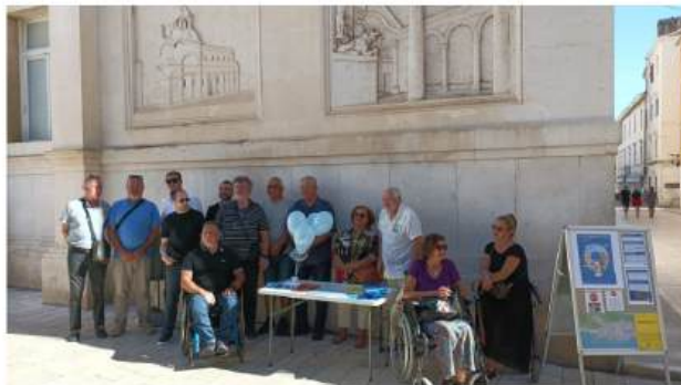
Udruga svake godine u suradnji s građanima provodi akciju mapiranja arhitektonskih barijera na području Zadra

Dodaje kako sama udruga proaktivno radi na poboljšanju pristupačnosti javnog prostora te svake godine u suradnji s građanima provode akciju mapiranja arhitektonskih barijera radi njihovog brzog i učinkovitog uklanjanja.