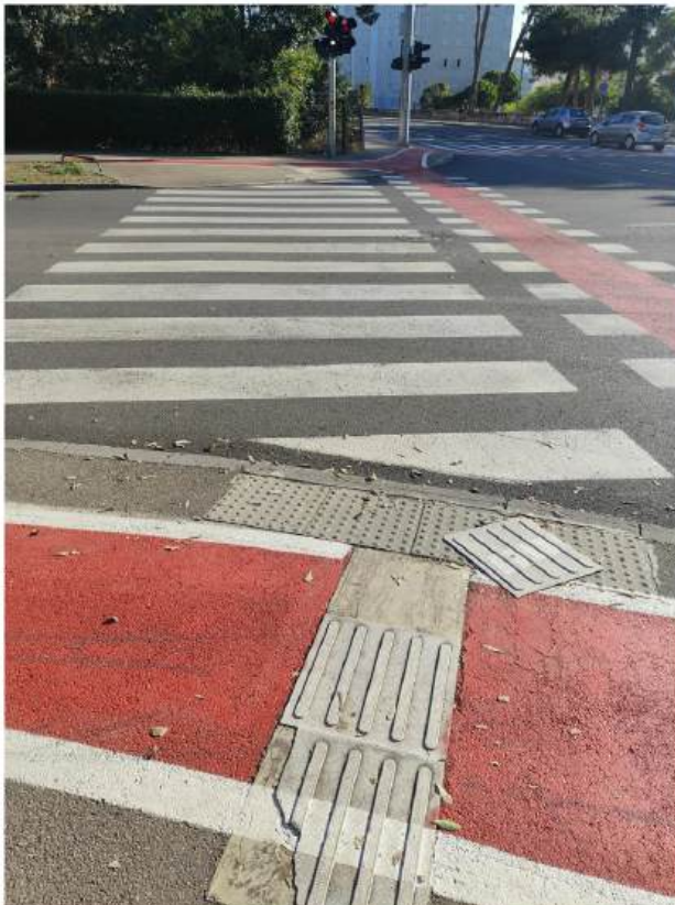
Pohvalno je što na nizu pješačkih prijelaza postoje taktilna polja upozorenja, ali bi trebalo posaditi i na njihovom održavanju

„Jednom sam se našla u situaciji da sam išla sama sa štapom. Došla sam do pješačkog prijelaza, ali nisam znala jesam li stala točno na zebru ili nisam, a s jedne i druge strane auti. Jedan je stao, drugi nije. Srce mi je skoro iskočilo od straha koliko sam bila u panici. Mislim si: Samo me pustite da prodem.“