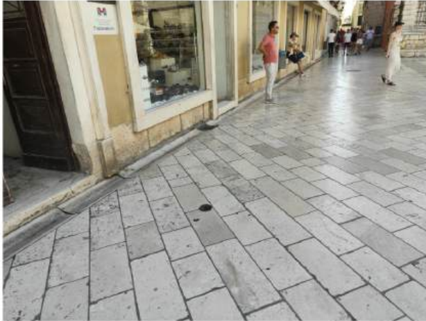
Na ulazu u većinu trgovina na Poluotoku postoji prepreka u obliku jedne stepenice