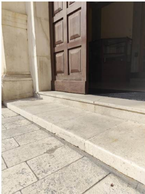
Ulaz u zadarsku gradsku upravu

„Što reći, jedan Rim koji je stariji od Zadra je maksimalno obilježen za osobe s invaliditetom. Jedna Akropola u Ateni, starija od Zadra ne znam koliko, ima na svojim zidinama postavljen lift. A mi smo kao pametni i čuvamo nešto pa nećemo dopustiti malo piture, niti ćemo osigurati pristupačnost u zgradama kao što je ona Gradskog poglavarstva jer se radi o starij kućama pod zaštitom.“