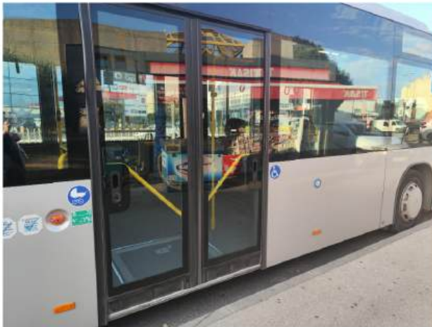
Udruga podsjeca Grad na nužnu prilagodbu autobusnih stanica za niskopodne autobuse

„Kada smo prije nekih pet, šest godina bili pozvani na predstavljanje prvih osam komada, rekao sam im u Gradu: Gospodo, ovo je lijepo, divno, bajno, ali vi imate jedan problem – nemate niti jednu prilagođenu stanicu. Oni su rekli da će pokušati to riješiti u što skorijem roku, međutim, osim stanice na Autobusnom kolodvoru, ništa nije napravljeno. Postoji još par stanica koje bi se mogle uz neke minimalne zahvate prilagoditi, ali to je to.“