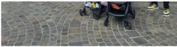
Članovi udruge na jednom od izleta

Uz svu modernu tehnologiju koja im donekle olakšava komunikaciju, njima je bitna živa osoba pored njih, bila ona tumač, prevoditelj, ističe.