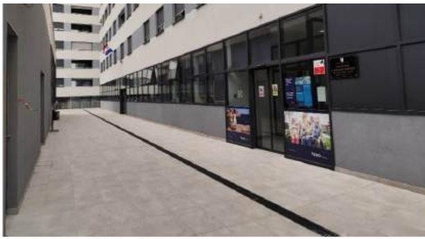
Pristup i ulaz u zadarski Zavod za mirovinsko osiguranje dobar je primjer primjene univerzalnog dizajna, no nedostaje parkirališnih mjesta