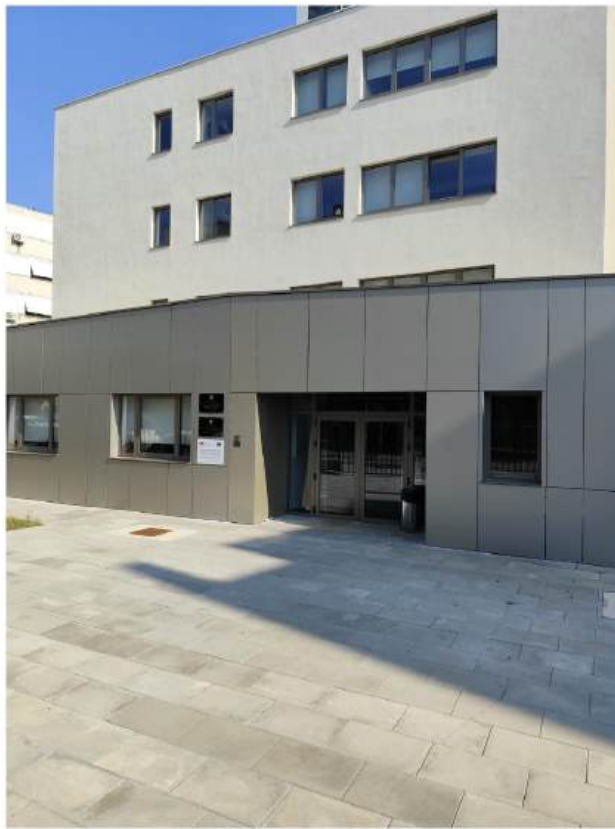
Nova zgrada Hrvatskog zavoda za socijalni rad, Područni ured Zadar

Općenito je u većim gradovima situacija bolja, u onim ruralnim puno slabija.