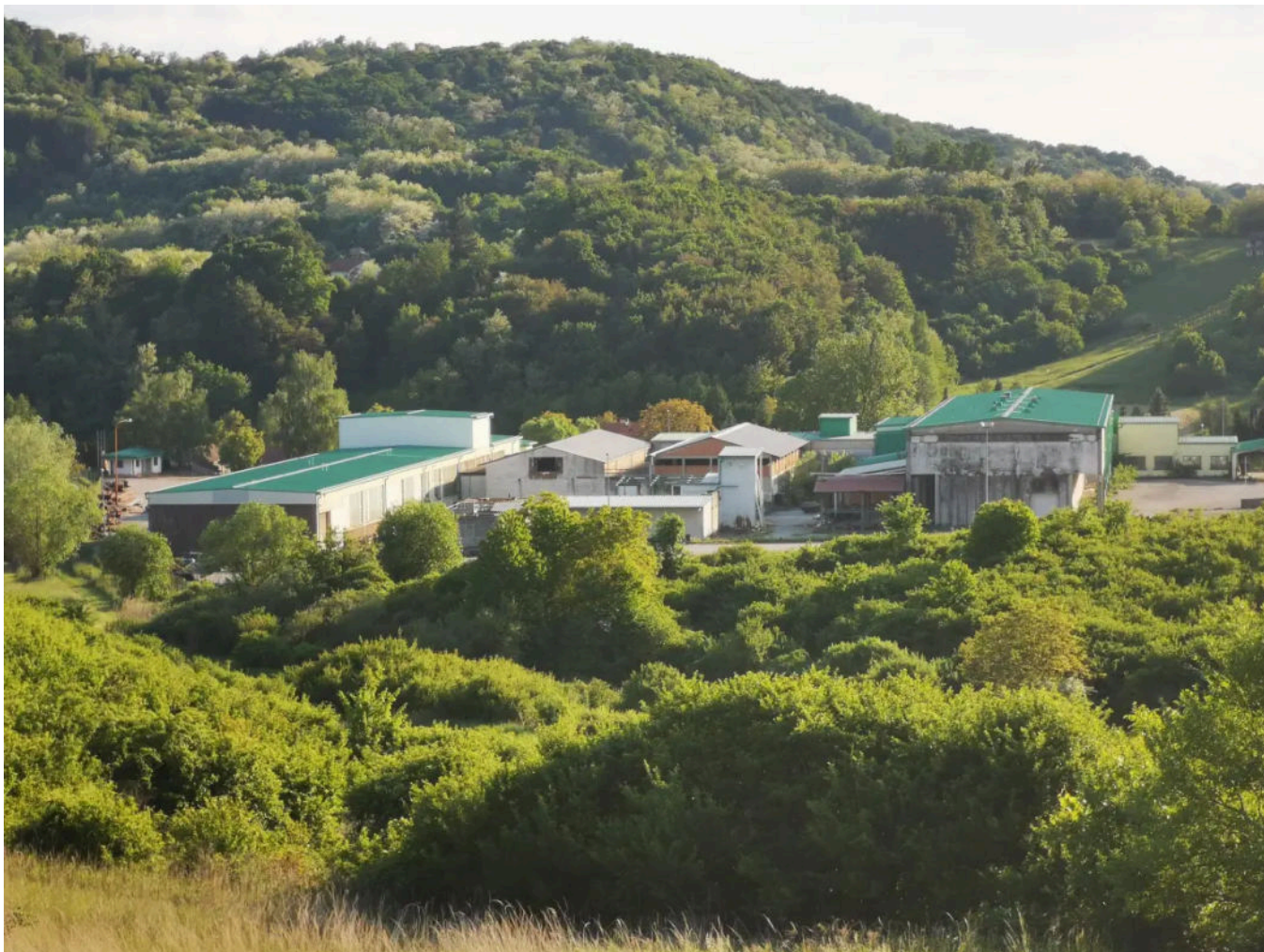
Pogon za obradu otpada planirna je u kotlini između pitomih brežuljaka