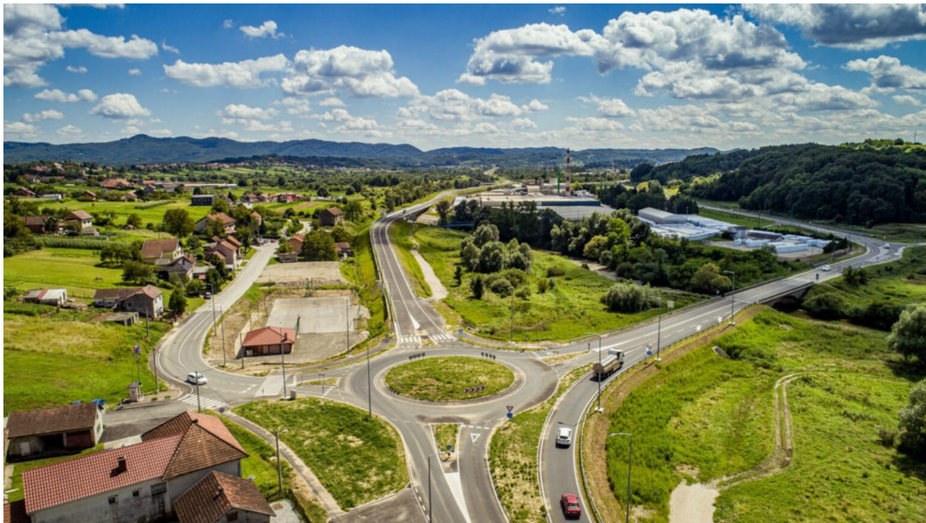
Ulaz u Novi Marof sa sjeverne strane

– Da je namjera zakonodavca bila omogućiti gospodarenje otpadom u svim gospodarskim zonama, ne bi bilo potrebe za posebnim propisivanjem jedne konkretne lokacije u planskom aktu – piše udruga u svojoj žalbi nadležnim tijelima.