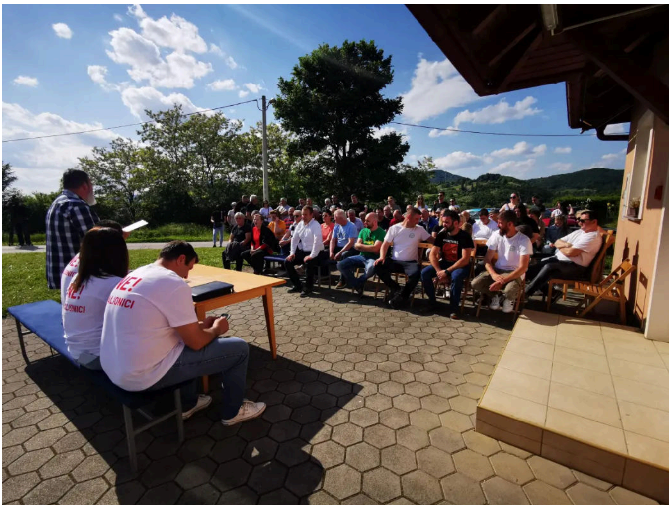
Građani se okupljaju, ali bez predstavnika politike i bez predstavnika investitora

– Javna rasprava nije predviđena u fazama u kojima nije propisana studija utjecaja na okoliš – tumači Jozinović, napominjući da je postrojenje dimenzionirano na način da studija utjecaja na okoliš nije potrebna.