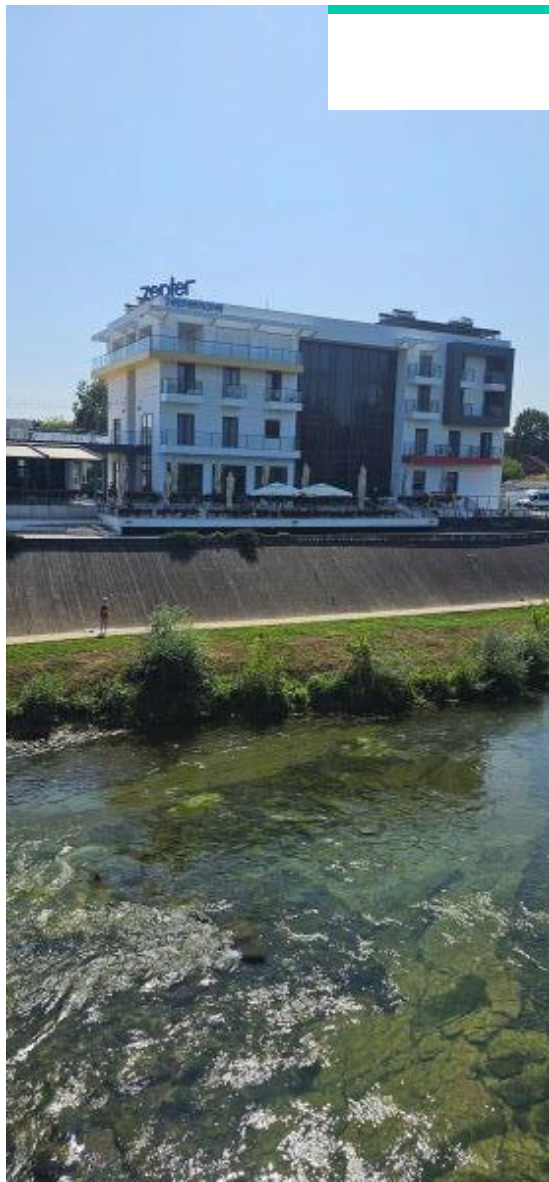
Zepter hotel u Kozarskoj Dubici