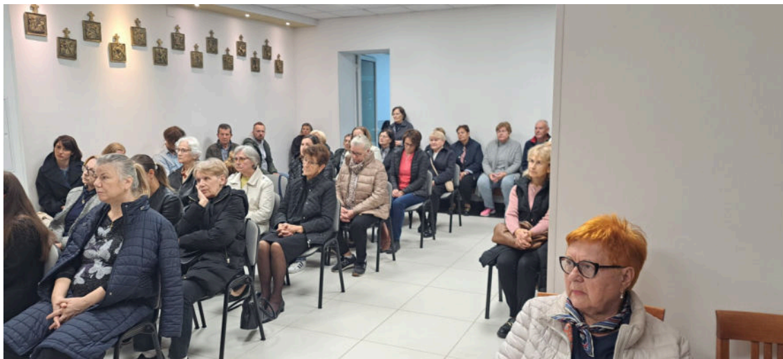
Crkvu ne čini građevina nego ljudi