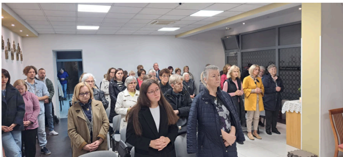
vjernici svakodnevno ispunjaju privremeni bogoslužni prostor

„U vrijeme prijašnjeg župnika, vlč. Vjekoslava Jakopovića, 2011. godine Nadbiskupija je uredila župni Pastoralni centar u prizemlju stambene zgrade u Rogozovoj ulici, te je nakon 12 godina postojanja Župa konačno dobila svoj prostor za svakodnevno okupljanje: kapelu, vjeronaučnu dvoranu i Župni ured. Time se zapravo počela profilirati zasebna župna zajednica. Kad sam došao 2012. godine, Zagrebačka je nadbiskupija s Gradom Zagrebom već dogovorila