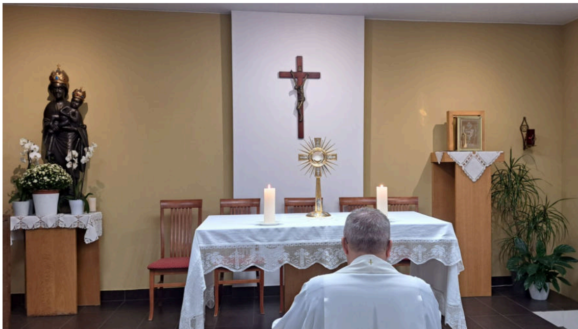
klanjanje pred Presvetim svakoga petka

Pozivanje i hrabrenje ljudi na zajedničku molitvu kroz razne molitvene kampanje, redovne i izvanredne, na srcu mi je dugo vremena, a uz otvorenost našeg župnika svjedočimo velikim i lijepim plodovima koji su vidljivi kako nama tako i svima koji dođu sa strane.