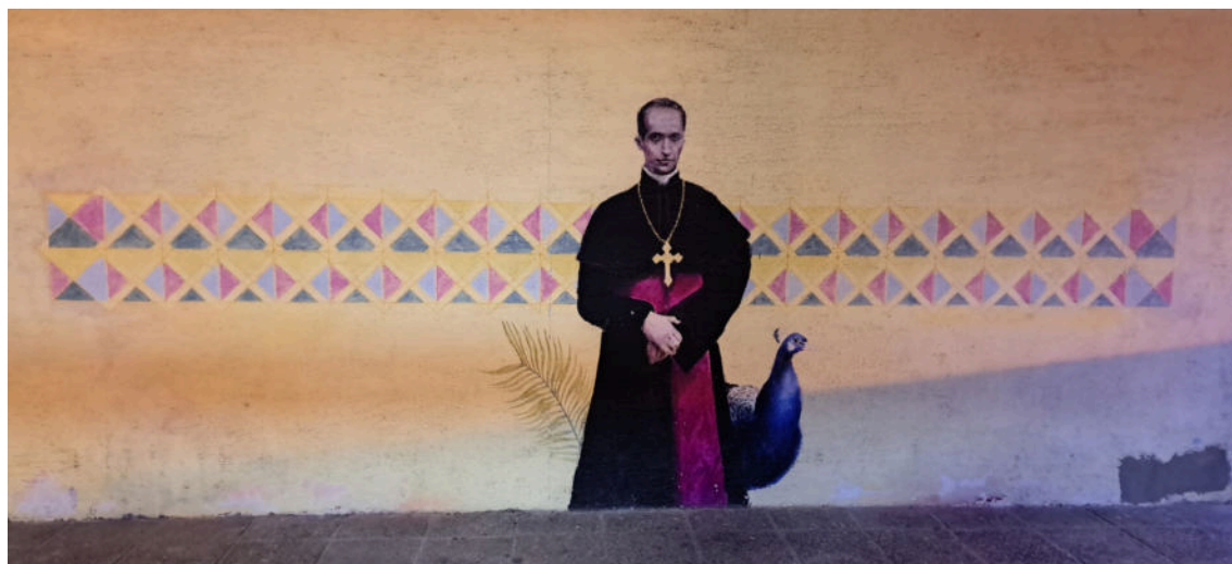
Stepinčev lik na fasadi ispred vjeronaučne dvorane u Ulici Z. Rogoza