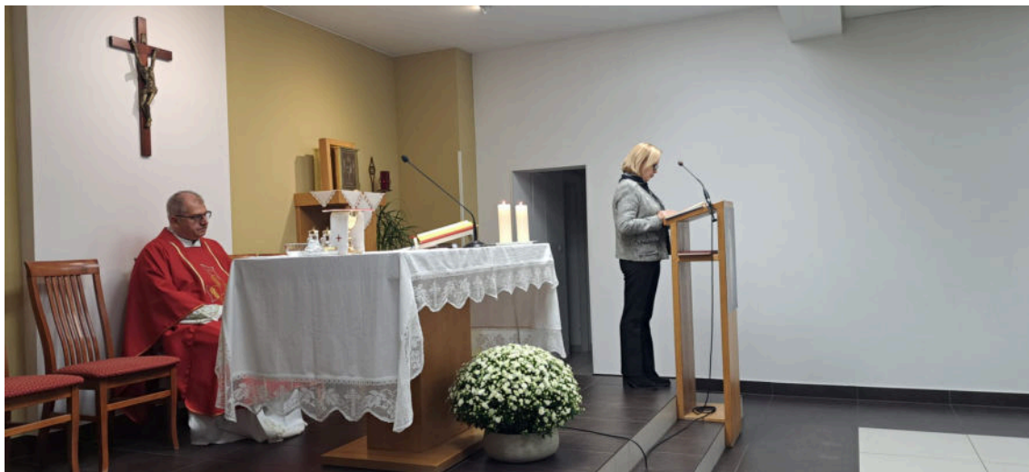
svatko je na svoj način uključen u život žive zajednice