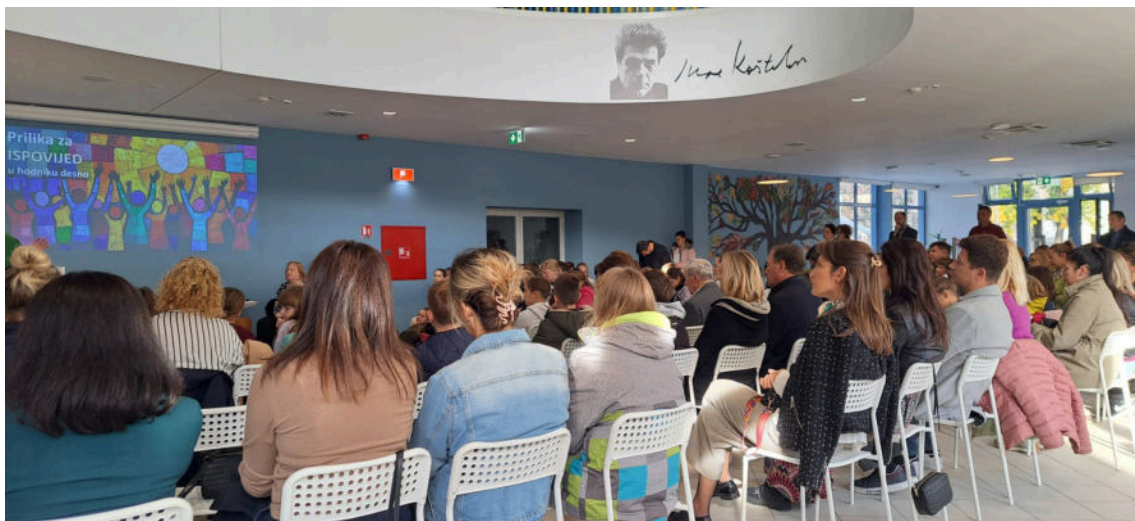
župljani na misi u predvorju školske zgrade

I danas smo u prostoru Osnovne škole Jure Kaštelana, književnika i, zajedno s. prof. dr. sc. fra Bonaventurom Dudom, glavnog urednika Biblije. Iako je škola prije dvije godine obnovljena, ovaj prostor budi uspomenu na prvu obljetnicu Stepinčeve beatifikacije, 3. listopada 1999. godine, kada je u njezinu predvorju misno slavlje predvodio zagrebački pomoćni biskup Josip Mrzljak .