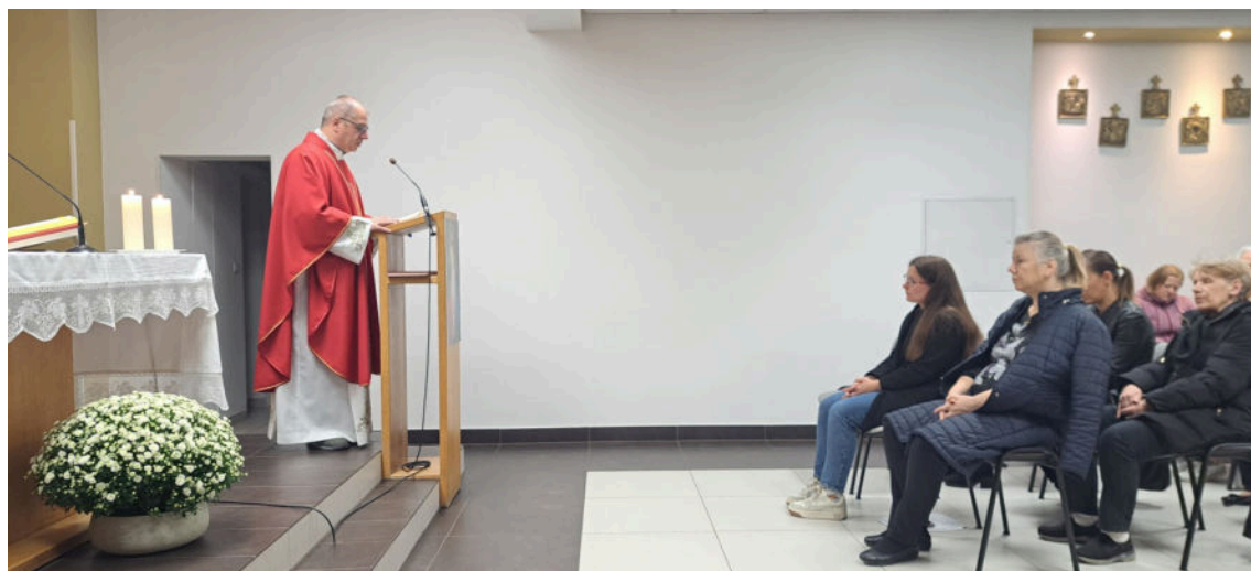
na večernjoj misi

Mladi pak, okupljeni u Zajednicu mladih i Zbor mladih Corfiduciae , pronalaze svoje mjesto, na primjer ponudom instrukcija za osnovnoškolsku djecu i uključivanjem u pripremu prvopričesnika i krizmanika.“