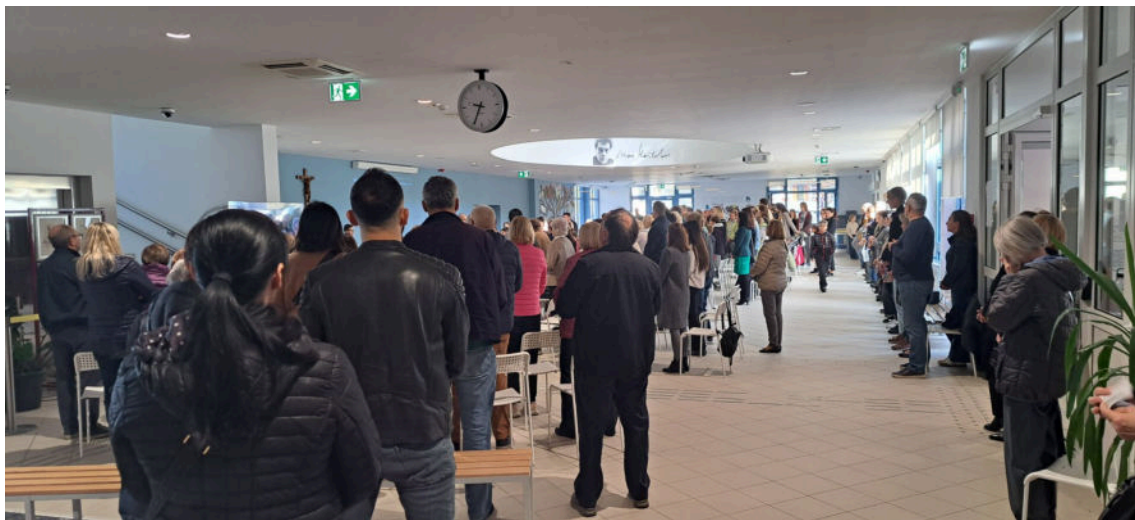
mnogima do jučer škola učenja, danas škola molitve