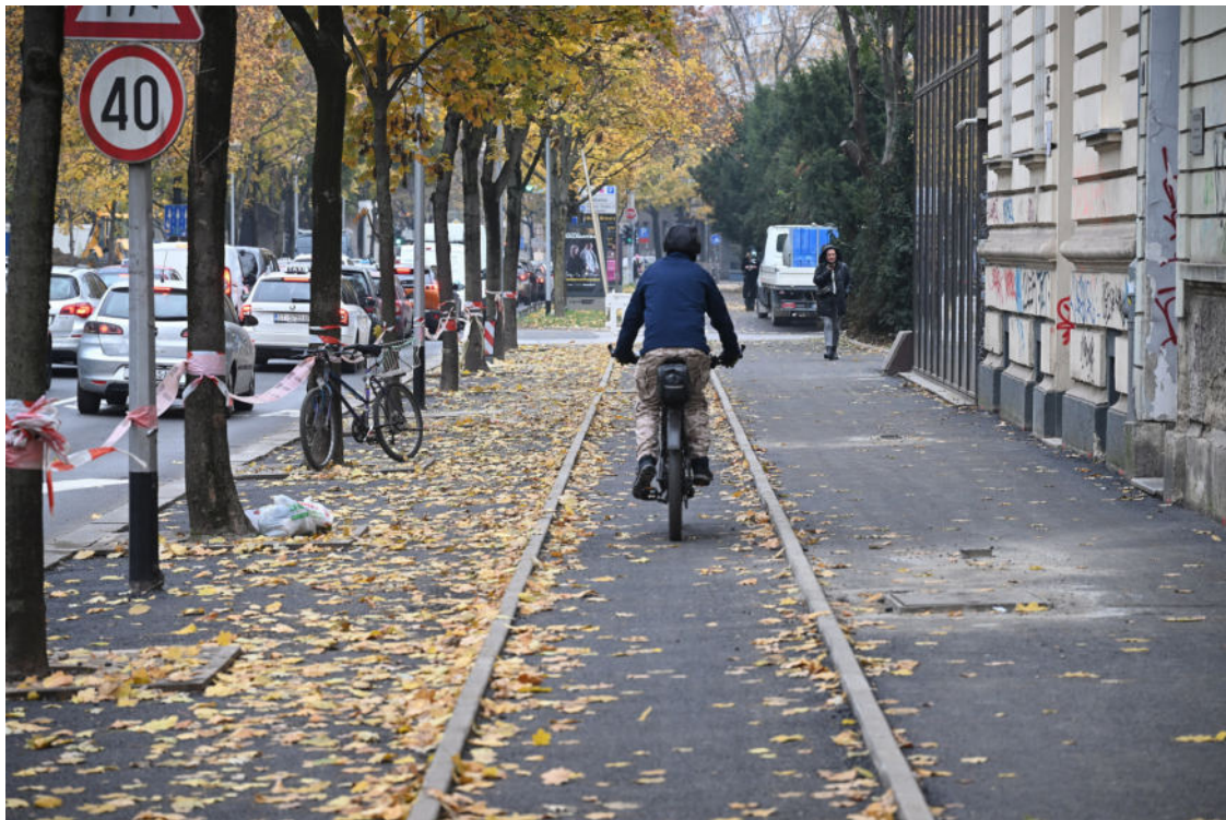
Biciklistička staza

Velik problem su uske površine po kojima biciklisti mogu voziti, a na kojima je sve više i romobilista, uz već postojeće pješake. U tim uvjetima po stazama se danas mogu kretati izuzetno spretni biciklisti, a nikako netko tko ima bilo kakvu poteškoću s kretanjem u prostoru. O zagrebačkim prometnicama da i ne govorimo. Biciklisti su tek na njima ugroženi jer je, uslijed prometnih gužvi, sve više nervoznih vozača koji često nemaju strpljenja pa ne paze na ostale sudionike u prolazu. Kako bi se tek na prometnicama snašao netko s poteškoćama u kretanju, uključujući i usporenije starije sugrađane, i to na biciklu.