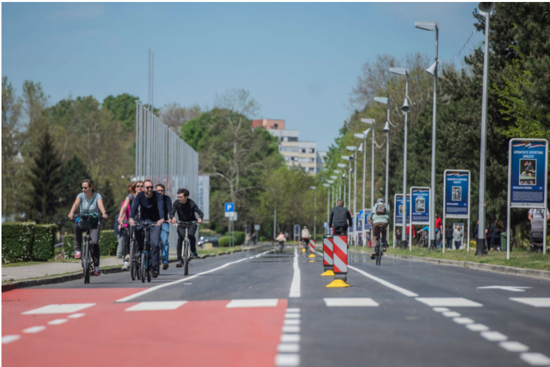
Gradonačelnik sa suradnicima na biciklističkoj stazi

Objavio Daniela Delale - Subota, 18. listopada 2025. u 19:23