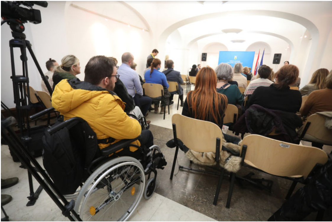
Osobe s invaliditetom rado sudjeluju u raznim inicijativama