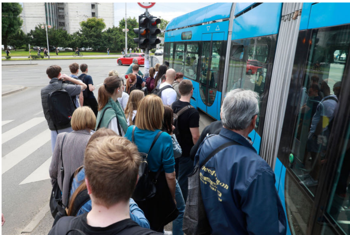
Zagrepčani čekaju tramvaj

Kako je to pokazao okrugli stol koji je Pravobranitelj za osobe s invaliditetom organizirao u studenom 2023. godine vezano uz pristupačnost javnog prijevoza osobama koje se kreću uz pomoć invalidskih kolica , velik je problem nepostojanje taksi vozila u koja bi se moglo ući s kolicima, nedovoljan broj kombi vozila za prijevoz od vrata do vrata, neprilagođena stajališta i ponekad loša komunikacija s vozačima ZET-a . Važnim su tada istaknuli uvođenje nastavka za kolica koji ih pokreće na električni pogon na listu ortopedskih pomagala što do danas nije napravljeno.