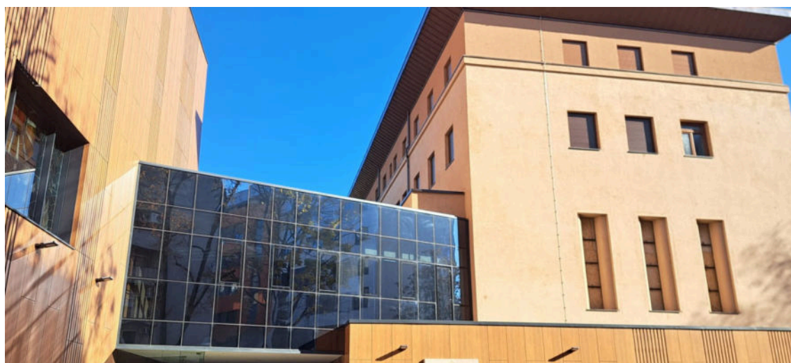
Preuređeni samostan fizički je povezan s crkvom