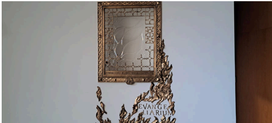
Časno mjesto za Riječ Božju

na drugim zagrebačkim visokim učilištima. U njemu su redovito odsjedali članovi provincije koji su u Zagreb dolazili radi potrebe liječenja.