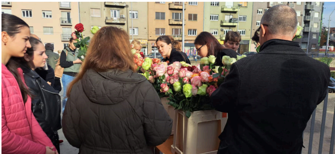
Članovi Frame odazivaju se na svaki poziv