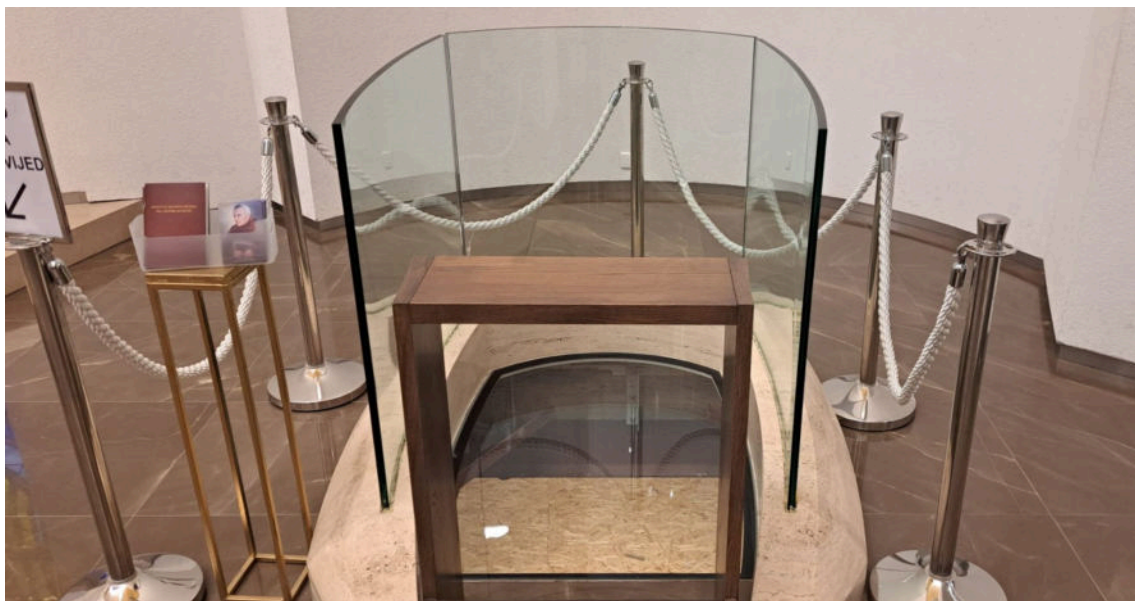
Pristup krecalu ponad kripte u kojoj počiva Časni sluga Božji