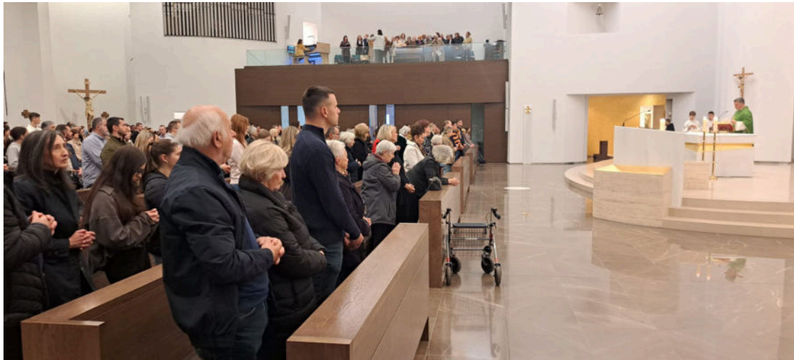
Župljani u školi liturgijskoga i župnoga zajedništva

doživljeno kao ‚iskustvo neočekivanoga‘, iskustvo dara koji izvire iz Božjega otajstva, iz Božjega spasenjskog darivanja po sakramentima Crkve.“