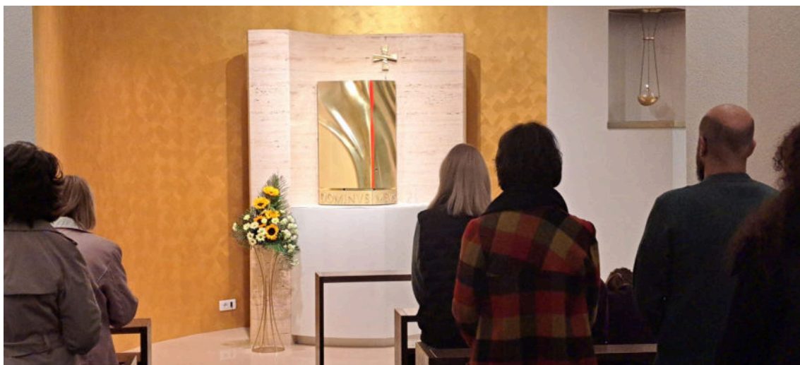
Tijekom mise vjernici zagledani u svetohranište

„Od 2019. u Župi Majke Božje Lurdske živi Molitvena zajednica „ Službenici Božji “ koja broji 20-ak članova. U jesen 2023. godine duhovnik joj postaje fra Ante Bešlić. Molitveni susreti se sastoje od kateheza, molitve, slavljenja i euharistijskog klanjanja. Članovi zajednice aktivno su uključeni u pastoralne aktivnosti, te sudjeluju u raznim inicijativama.