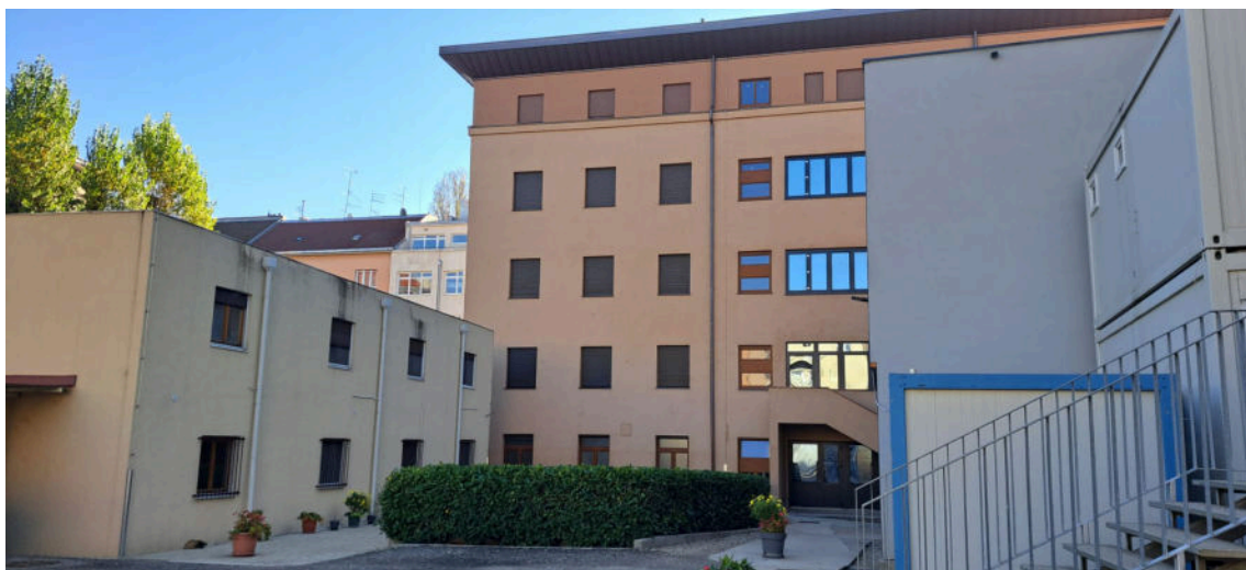
Uz drevni samostan privremeni stambeni prostor

Na godišnjoj razini nastojimo potpomoći neki humanitarni projekt i izvan župe, poput donacije Zakladi Sv. Dominik Savio , Specijalnoj bolnici za kronične bolesti dječje dobi u Gornjoj Bistri, misionarkama ljubavi – sestre Majke Tereze u Zagrebu i sl.