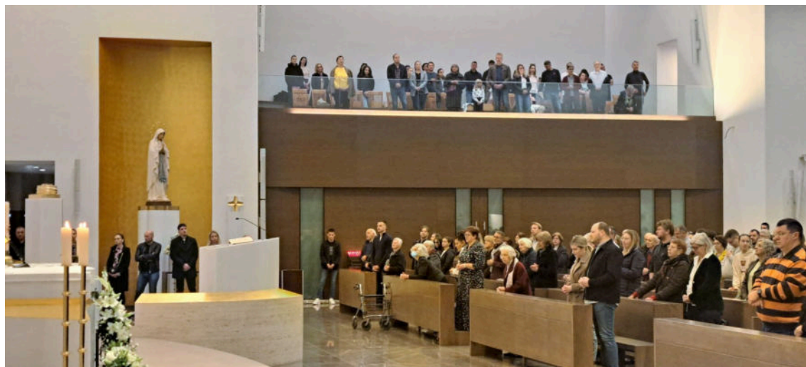
Majka Božja Lurdska magnet koji privlači

„Atmosfera je intimna i vrlo osobna i to je ono što me osobito privlači. Prošlogodišnja tema ‚Od samoće do Boga‘ vodila nas je kroz niz vrlo konkretnih i stvarnih životnih područja – od odgovornosti i granica, preko strahova, krivnje i opraštanja, pa sve do skrivenosti i naših iskrivljenih slika o Bogu. Župnik, zajedno sa svojim ‚dopisnicima‘, hrabro je dijelio iskustva koja se rijetko čuju naglas – konkretna i duboko osobna.