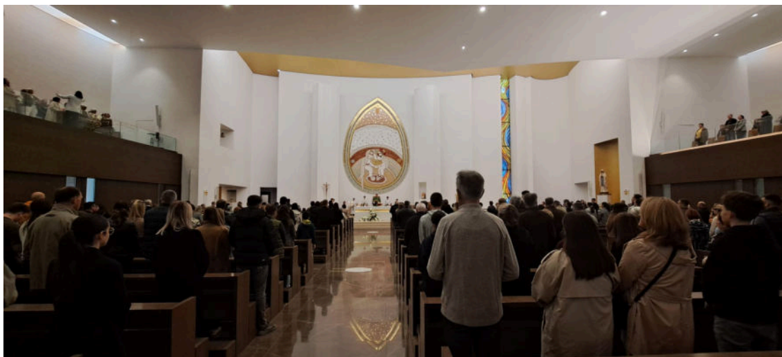
Nakon kripe vjernici su rado prihvatili „gornju crkvu“

„Crkva kao građevina potrebna nam je za održavanje liturgijskih čina, ali i kao mjesto susreta jednih s drugima i mjesto susreta s Bogom. Bogu dragom hvala, nakon dugih desetljeća od posvete kripe, zagrebački nadbiskup Dražen Kutleša 19. studenoga 2023. posvetio je toliko iščekivanu ‚gornju crkvu‘ Majke Božje Lurdske.