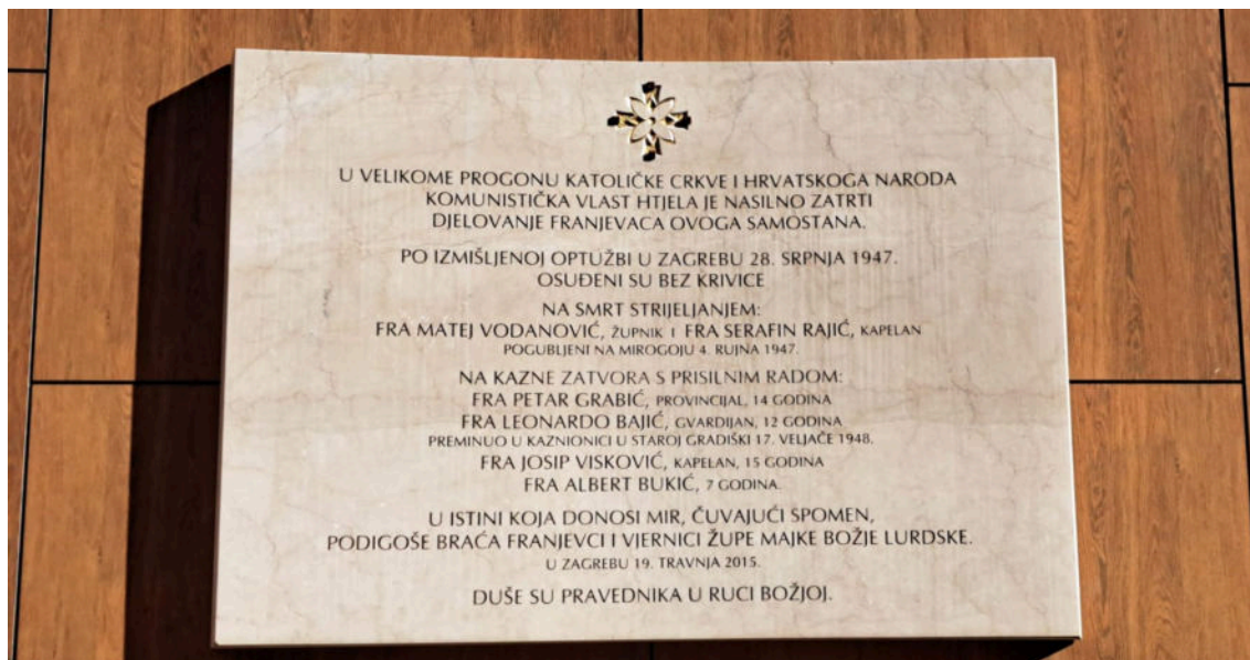
Spomen-ploča svjedoči o stradalim redovnicima

Završetkom Drugoga svjetskog rata franjevcima u Vrbanićevoj nije podaren mir. Komunistička vlast zabranila im je sabiranje milodara za gradnju crkve, provodeći zastrašivanja i uznemiravanja. U zoru 19. travnja 1947. pripadnici Udbe upali su u samostan, uhitili i na ispitivanje odveli mnogu braću. Nakon doslovnoga mučenja podignuta je izmišljena optužnica za podmetanje eksploziva u tvornici „Gaon“ koja se nalazila u samostanskome susjedstvu.