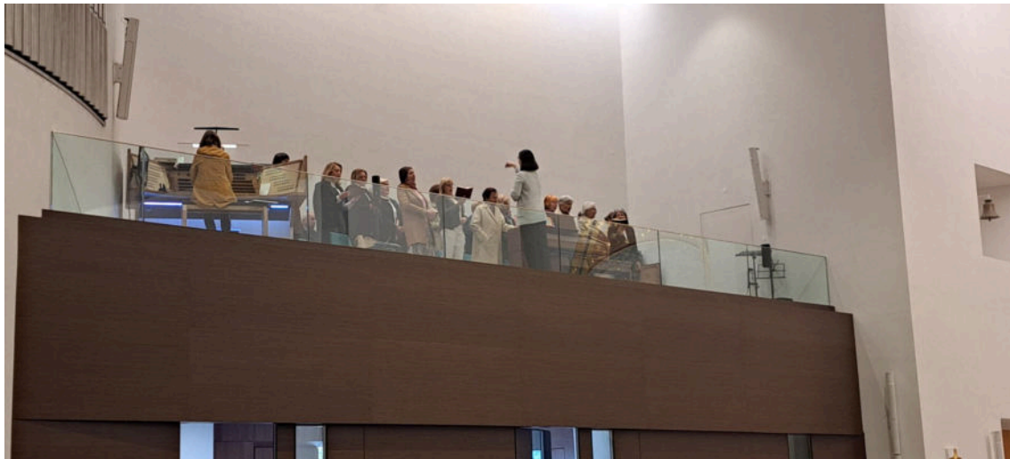
Na koru jedan od pet zborova

„Zbor otac Ante Antić vodim od studenoga 2015. godine. Došla sam među njih nakon preseljenja iz Župe Dubrovačke, gdje sam također vodila župni i dječji zbor u Župi sv. Ilara u Mlinima. Ovaj me zbor na samom početku oduševio svojom profesionalnošću, skladom i ljepotom glasova. Njihovo suvereno, sigurno, skladno i milozvučno četveroglasno pjevanje predstavljalo je izazov jer mi je odmah bilo jasno da tu razinu treba makar održati, ali po mogućnosti i podići.