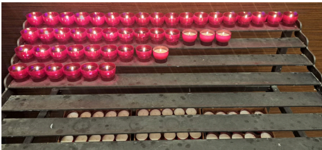
Koliko zapaljenih lučica, koliko uslišanih molitvi