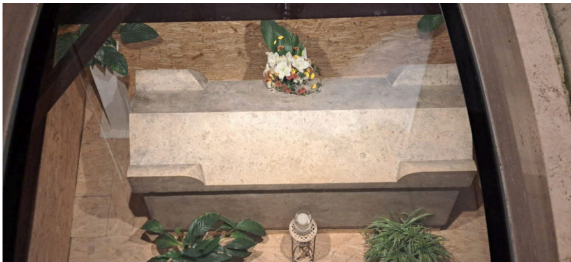
Sarkofag u kripti s posmrtnim ostacima oca Antića

Koliko su urodili plodom dosadašnji napori za Antićevo uzdignuće na čast oltara?