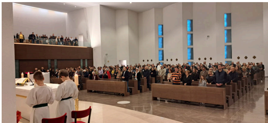
Iz žive Crkve rađaju se novi članovi za budućnost

„Svake subote sve pršti od radosti i dječjih glasova. Desetak animatora iz tjedna u tjedan drži radionice za djecu od 10 do 13 godina koja se na taj način uključuju i postaju aktivni dio župne zajednice. Prije svega, sa svojim vršnjacima grade kvalitetna prijateljstva i zajedno se približavaju Bogu.