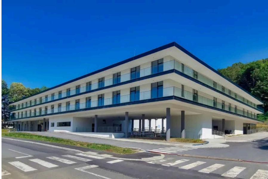
Veteranski centar u Daruvaru

Vodio sam i projekt Digitalizacije arhivskog gradiva MUP-a i MORH-a s čime smo bitno olakšali pronalaženje ratnih puteva branitelja.