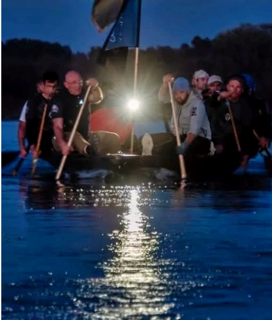
Veslanje s lađarima

Te 2010. godine je Miljenko Miloško Glasović, koji je osmislio Maraton lađa, spomenuo kako bi htio da se jedne godine vesla i u New Yorku, oko Manhattana.