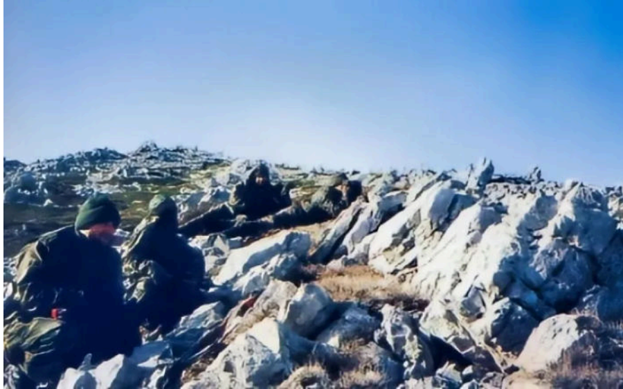
Na prvoj liniji bojišnice na Velebitu (prvi s lijeva)

Oluja je bila doista velika stvar za nas iako će meni Bljesak ostati u posebnom sjećanju.