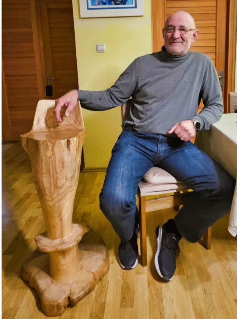
Voli raditi s drvom pa je tako napravio i ovu barsku stolicu od jednog komada drva