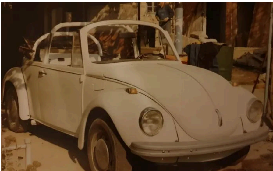
Dinko Tandara je od VW "bube" sam napravio kabriolet