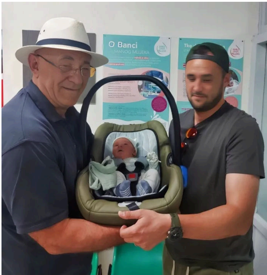
Najveće veselje, dolazak na svijet unučice

Postao sam prijatelj sa svojim sinovima. Znali su mi se povjeriti, reći u čemu je problem i razgovarati. Posvađamo se mi ponekad, naravno. Posvađam se i sa svojom starom majkom, ali onda je zagrlim i izljubim. Obitelj se treba držati zajedno jer nemamo nikog drugog, imamo samo sebe.