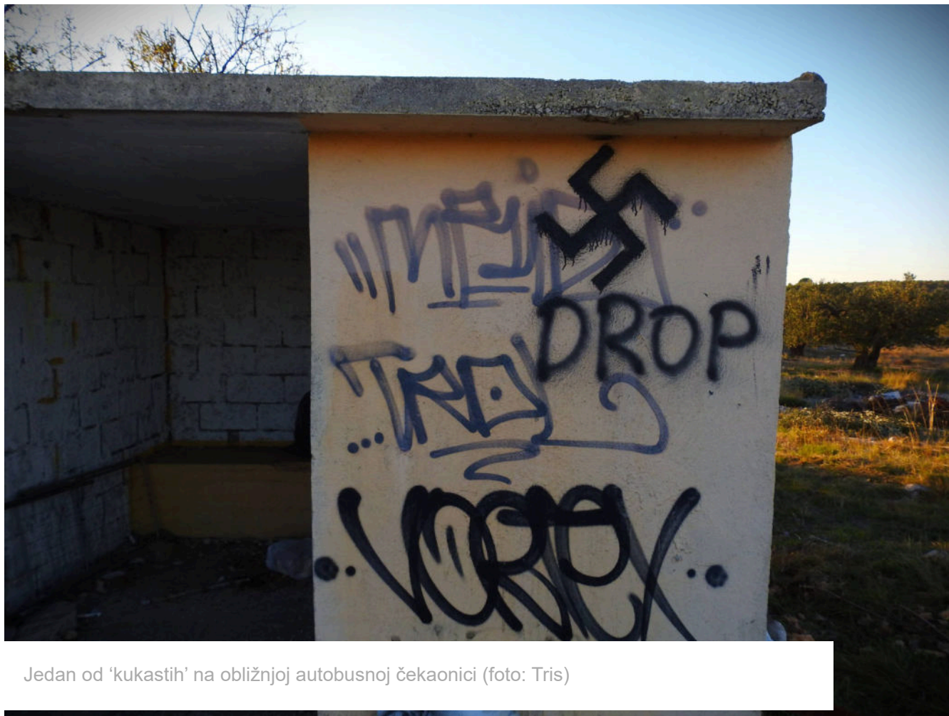
Jedan od 'kukastih' na obližnjoj autobusnoj čekaonici

Možda je vrijeme da podsjetimo i na Zakon o prekršajima protiv javnog reda i mira koji u članu 5. ističe: Tko na javnom mjestu izvođenjem, reproduciranjem pjesama, skladbi i tekstova ili nošenjem ili isticanjem simbola, tekstova, slika, crteža, remeti javni red i mir kaznit će se za prekršaj kaznom od 700 do 4000 eura ili kaznom zatvora do 30 dana .