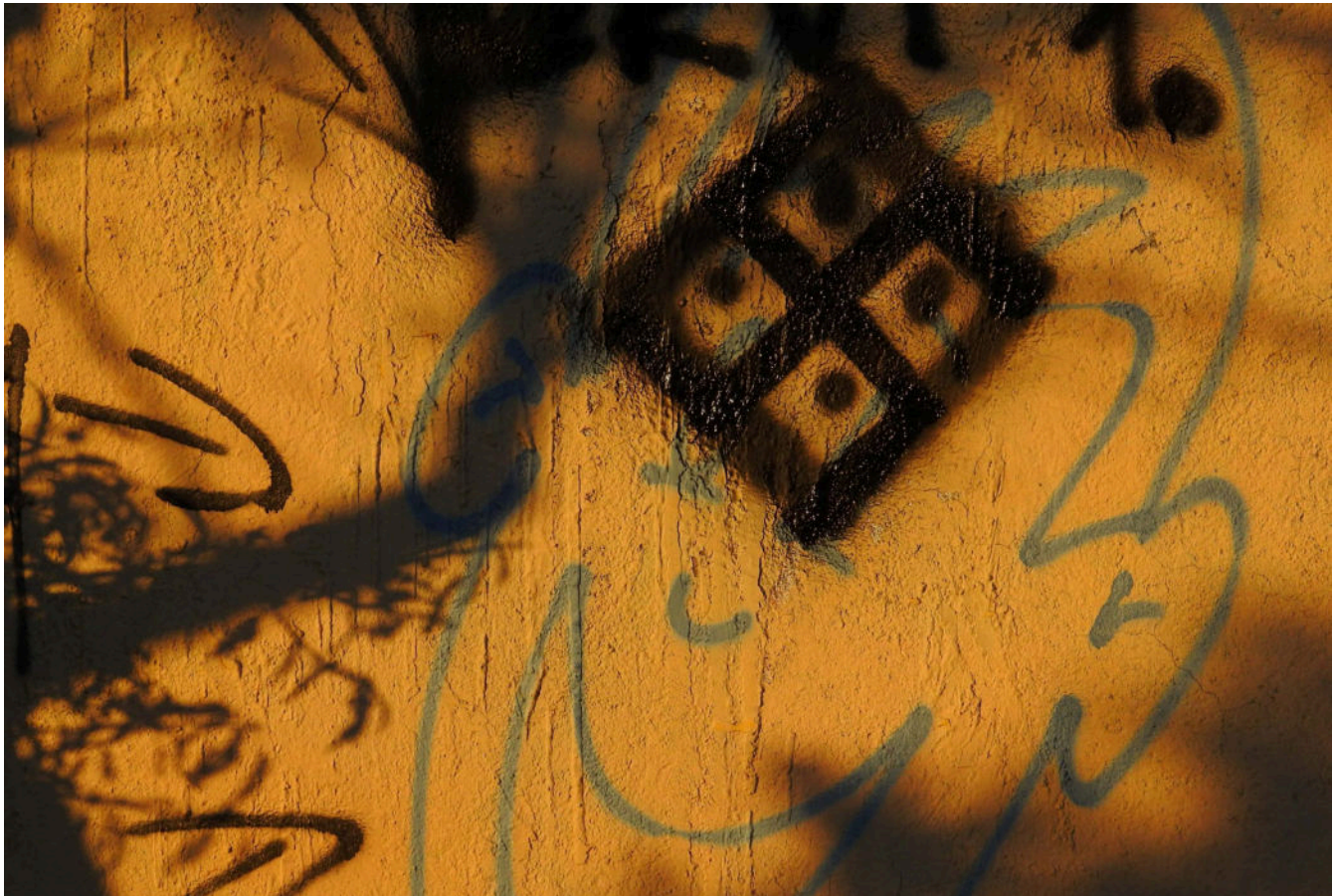
Jedan od prepravljenih 'kukastih' na obližnjoj autobusnoj čekaonici

Obje reakcije, kako one primoštenskog načelnika, tako i ona spomenutog građana, daju nadu kako se može efikasno i odvažno pružiti otpor zabrinjavajućim pojavama i događanjima u društvu, a ne ih samo šutke promatrati sa kauča u dnevnom boravku i praviti se mrtav .