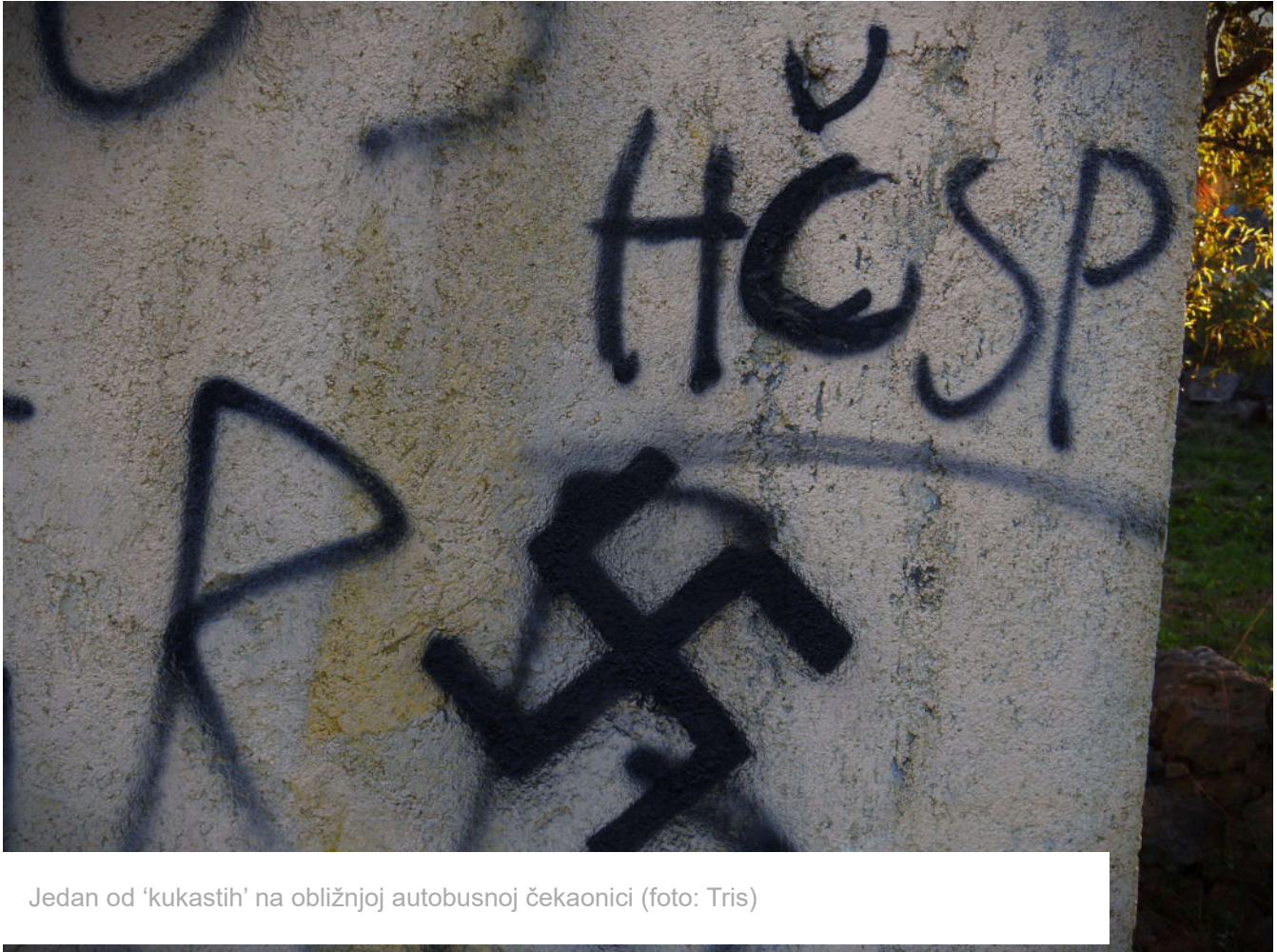
Jedan od 'kukastih' na obližnjoj autobusnoj čekaonici

Nije isključeno da je u većem broju slučajeva nakazna ideologija labilnom maloljetniku usađena iz kućnog dnevnog boravka ili pak od starijih protuha u navijačkim i sličnim nakupinama.