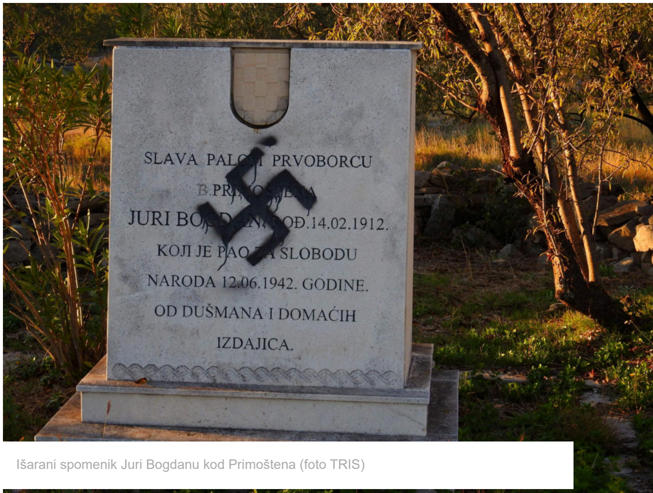
Išarani spomenik Juri Bogdanu kod Primoštena

Nevjerojatno, ali osamdeset i tri godine poslije smrti Jure Bogdana , iz crnih rupa zla opet su se pojavile aveti fašizma, utjelovljene u spodobe koje po noći po istoj zemlji i spomenicima šaraju simbole pod kojima su uzrokovale nesagledive patnje i stradavanja, simbole nacizma koji obilježavaju jednu od najgorih poznatih razdoblja u nesretnoj povijesti čovječanstva.