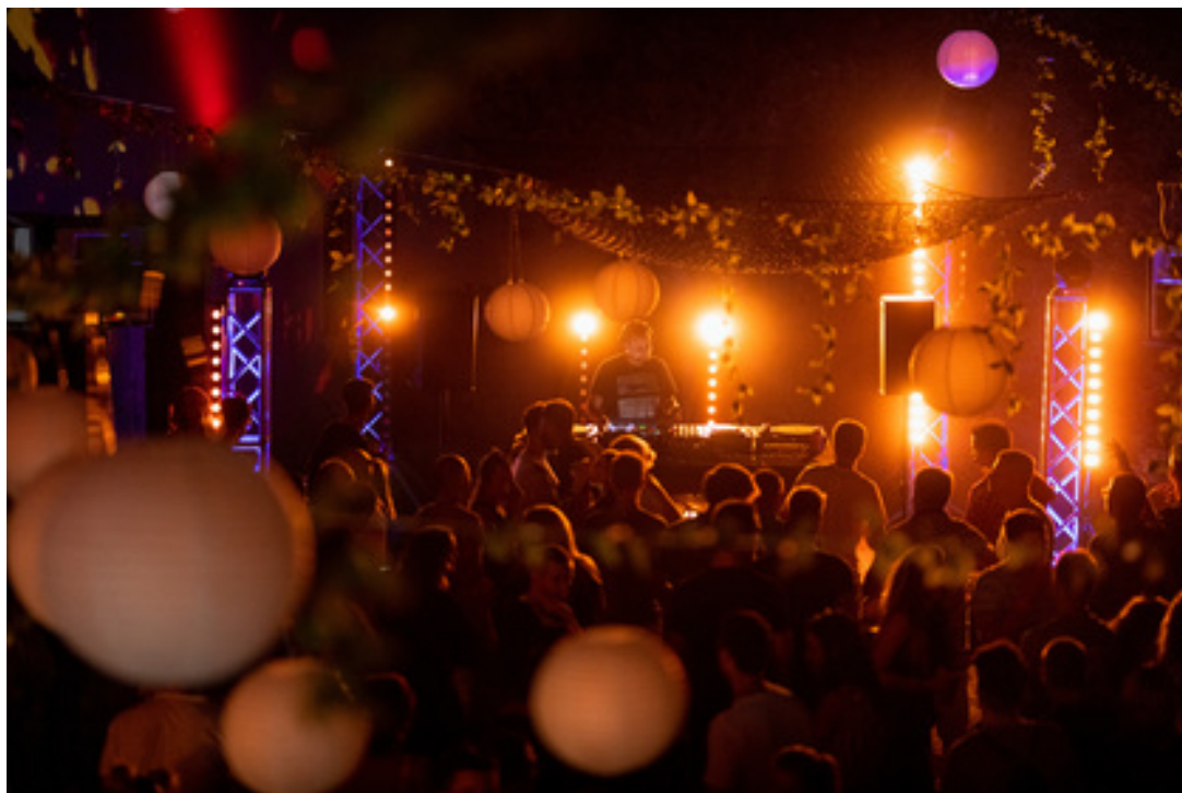
Gardence Festival, Kaštel Grobnik, (foto: Pavle Kaplanec)

Dok traje zabava sve mora funkcionirati. Na publici je samo da uživa u finalnom produktu tih, često u pravilu, turbulentnih priprema i daje motiva za nastavak istih. Sljedećeg jutra, kada se gužva razide i klub utihne, kreće faza demontiranja. Oprema se pakira, papiri se sređuju i priprema se novi ciklus za sljedeći vikend. Iako publika možda nikada neće vidjeti što se događa iza zatvorenih vrata, upravo to je tajna iza magije na plesnom podiju.