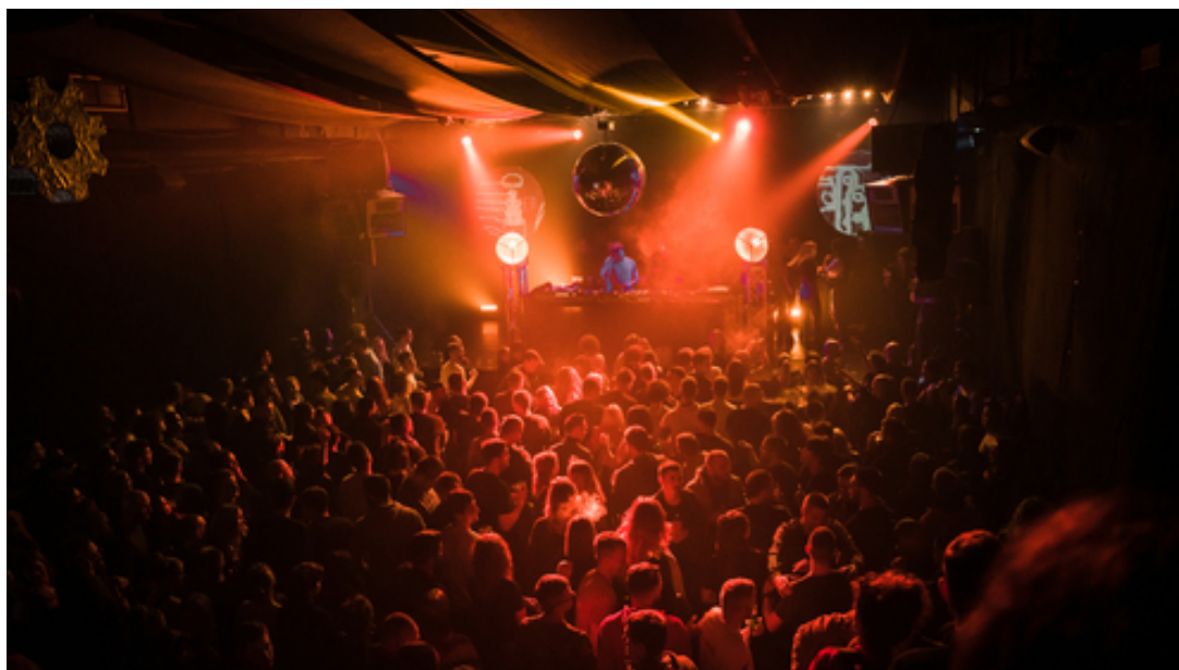
Traumer, Pogon kulture

Ako i nemate problema s birokracijom, biznis vam mogu uništiti nepredviđene nevolje. Tehnički problemi su nevidljiva sila koja može prekinuti čaroliju u sekundi. U klupskim uvjetima, gdje se troši puno energije, i nestanak struje je realna opasnost. Oprema koja prestane raditi, zvuk koji ne funkcionira savršeno zbog akustike, izvođač koji ima prekomjerne zahtjeve — sve to može uzrokovati kaos, ističu u klubovima. A sve navedene poteškoće stvaraju domino efekt stresa.