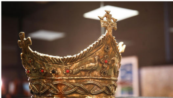
IDEJNA REKONSTRUKCIJA KRUNE KRALJA TOMISLAVA