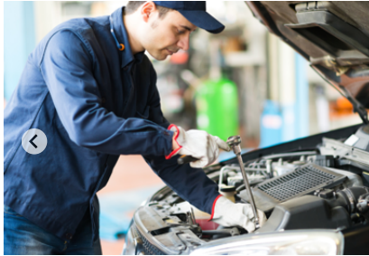
Datacol aditivi za gorivo