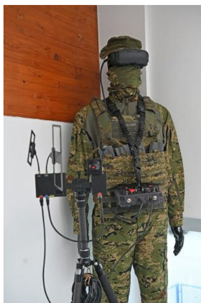
Oprema operatera drona

„Činjenica da su naša tehnološka rješenja tražena diljem zapadnih tržišta od velikog je značaja, ne samo za Orqu, već i za cjelokupan razvoj hrvatske industrije robotike. Naš tim mladih inženjera i stručnjaka za razvoj besposadnih i robotičkih sustava predstavlja najvrjedniji resurs koji tvrtka ima. Iako je Orqa među vodećim proizvođačima besposadnih sustava, valja istaknuti da se i druge hrvatske tvrtke uspješno pozicioniraju u ovom sektoru“ ,