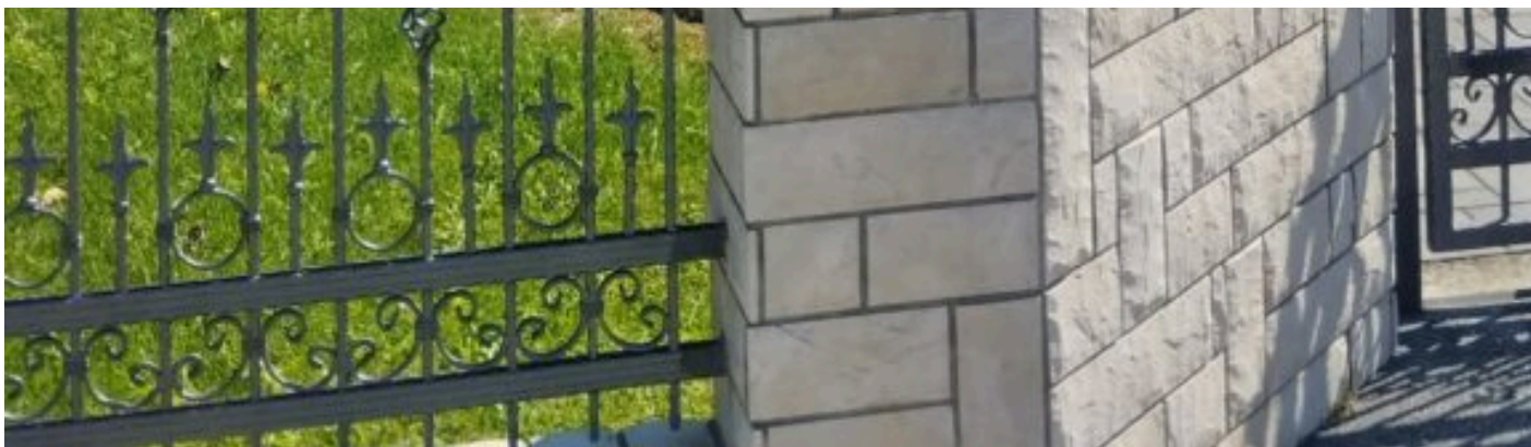
BBB zastava na verandi u Dubravi

U dvorište crkve ulazim kroz kapiju te na savjet gđe. Marije koja kupi korov na travnjaku zvonim na vrata Župnog ureda. Brzo uspostavljamo zajednički jezik, s Jukićeve, Varšavske i Svetog Duha poznaje moju tetu Mariju, moguće je da zajedno dijele hranu beskućnicima. U uredu nema nikoga. Savjetuje mi da se vratim u pola 1, kada se župnik vraća s terena.