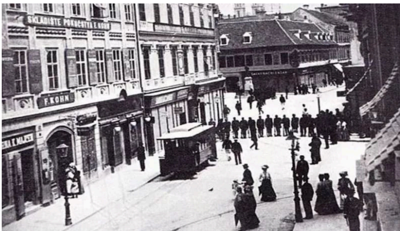
Javna rasvjeta u Ilici oko 1930-tih.j

No, spomenuta prva javna demonstracija električne rasvjete u Zagrebu prilikom Sokolskog plesa u Hrvatskom glazbenom zavodu poslužila je građanstvu kao reklamni uzorak koji je trebao pokazati sve njene prednosti.