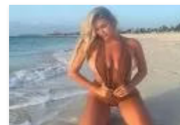
FOTO: "NAJ" ODBOJKAŠICA – Seksi Kayla Simmons ponovno u centru pažnje