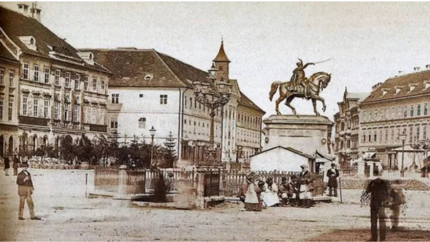
Zagreb, Trg bana Josipa Jelačića s plinskom rasvjetom u 19. stoljeću