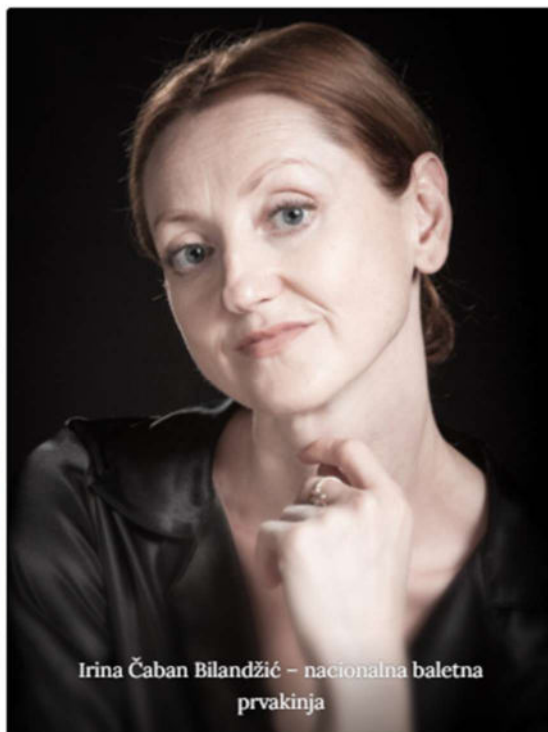
Irina Čaban Bilandžić – nacionalna baletna prvakinja