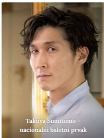
Takuya Sumitomo – nacionalni baletni prvak