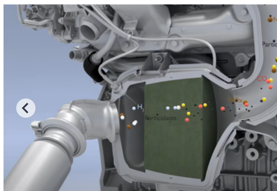
Datacol aditivi za gorivo