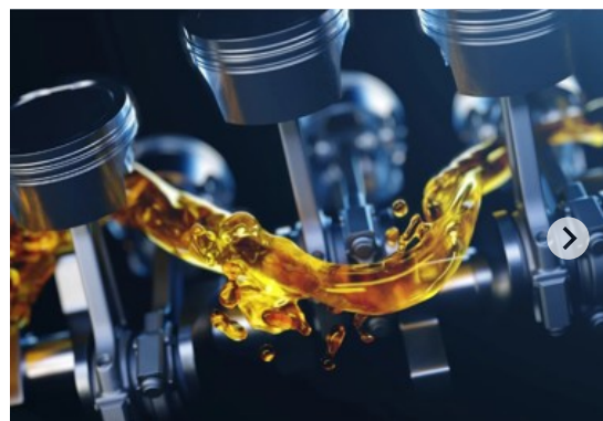
Datacol aditivi za gorivo