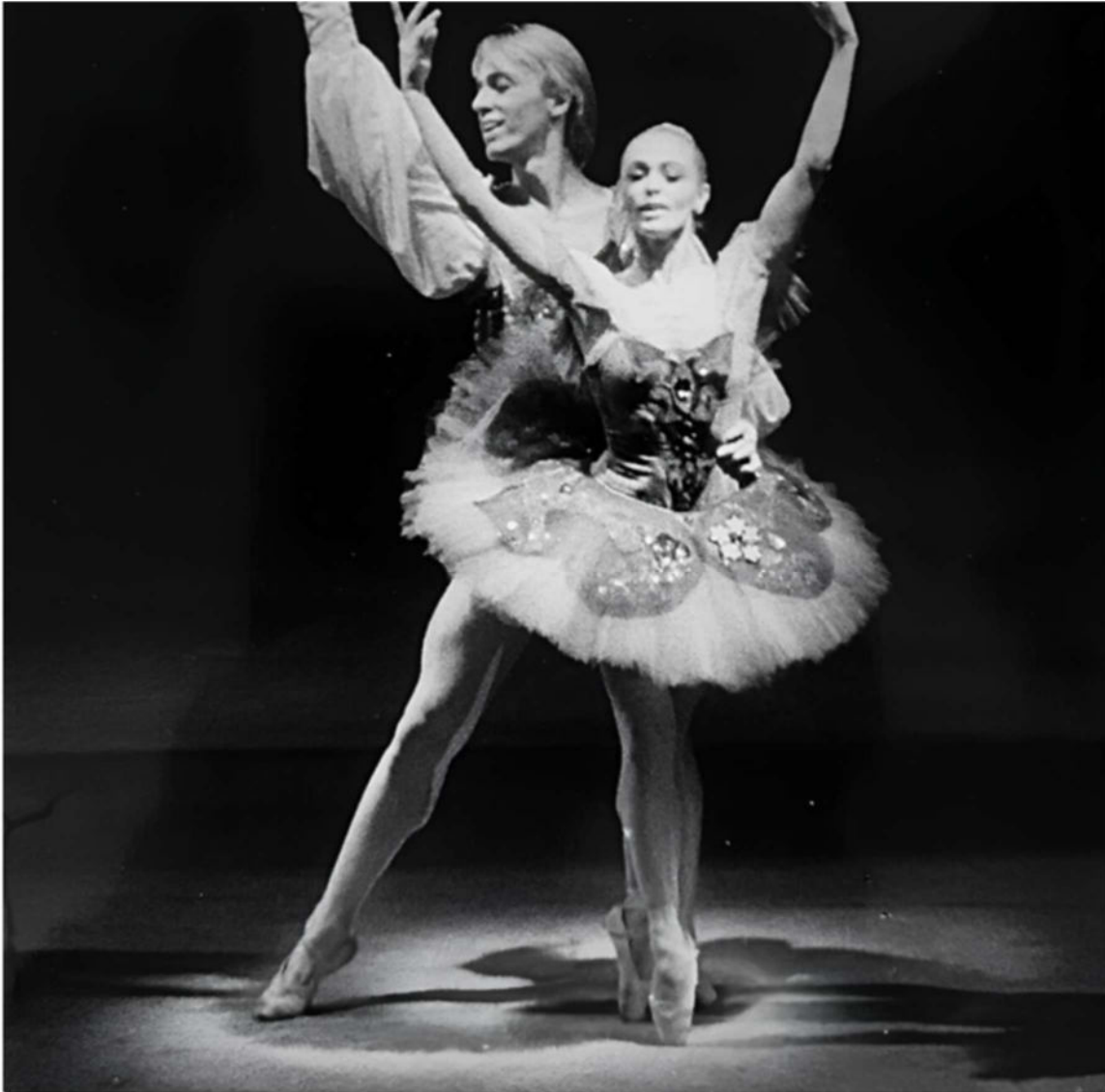
HNK u Zagrebu, Orašar, Svebor Sečak i Lidija Milovac

Vrijedno je razjasniti i kontekst citiranog teksta Svebora Sečaka. Iza tih misli ne stoji tek komentator, nego jedan od značajnijih baletnih umjetnika i djelatnika na prostoru Hrvatske i Slovenije s četrdesetogodišnjm karijerom, nacionalni prvak s međunarodnim iskustvom, dugogodišnji predsjednik Hrvatskog društva profesionalnih baletnih umjetnika, jedan od suautora studija baletne pedagogije pri Akademiji dramske umjetnosti, sveučilišni profesor, prvi doktor znanosti u baletnoj struci u Hrvatskoj te dekan Akademije za ples u Ljubljani i član Europske akademije znanosti i umjetnosti. Riječ je o umjetniku i pedagogu koji se više od dvadeset godina aktivno bavi upravo problemima o kojima se ovdje govori.