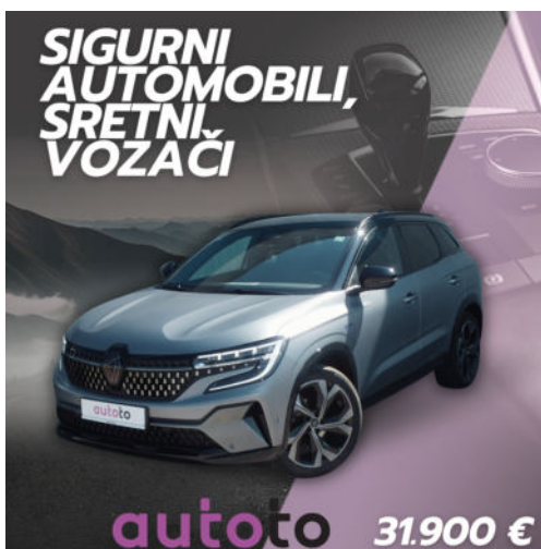
RENAULT AUSTRAL →