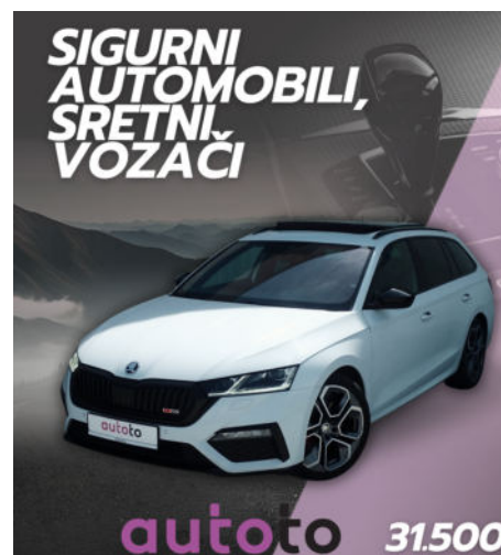
ŠKODA OCTAVIA COMBI -

"Imala sam pomoćnika da mi nosi municiju", govori s osmijehom koji, u istom dahu, skriva bolna sjećanja.