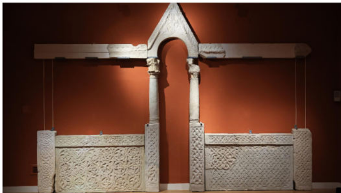
SVEČANO OTVORENA IZLOŽBA 'U POČETKU BIAŠE KRALJEVSTVO - IZLOŽBA U POVODU 1100 GODINA HRVATSKOGA KRALJEVSTVA'