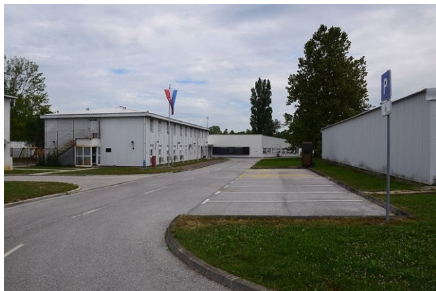
Prihvatni centar za strance Ježevo

Formalno, to su dva različita svijeta: istražni zatvor pripada kaznenom pravosuđu, centar za strance migracijskom režimu. U praksi, za čovjeka koji ne govori jezik i koji je mjesecima izložen prevarama, razlika je minimalna. U oba slučaja gubi dokumente, slobodu i mogućnost razumjeti što mu se događa.