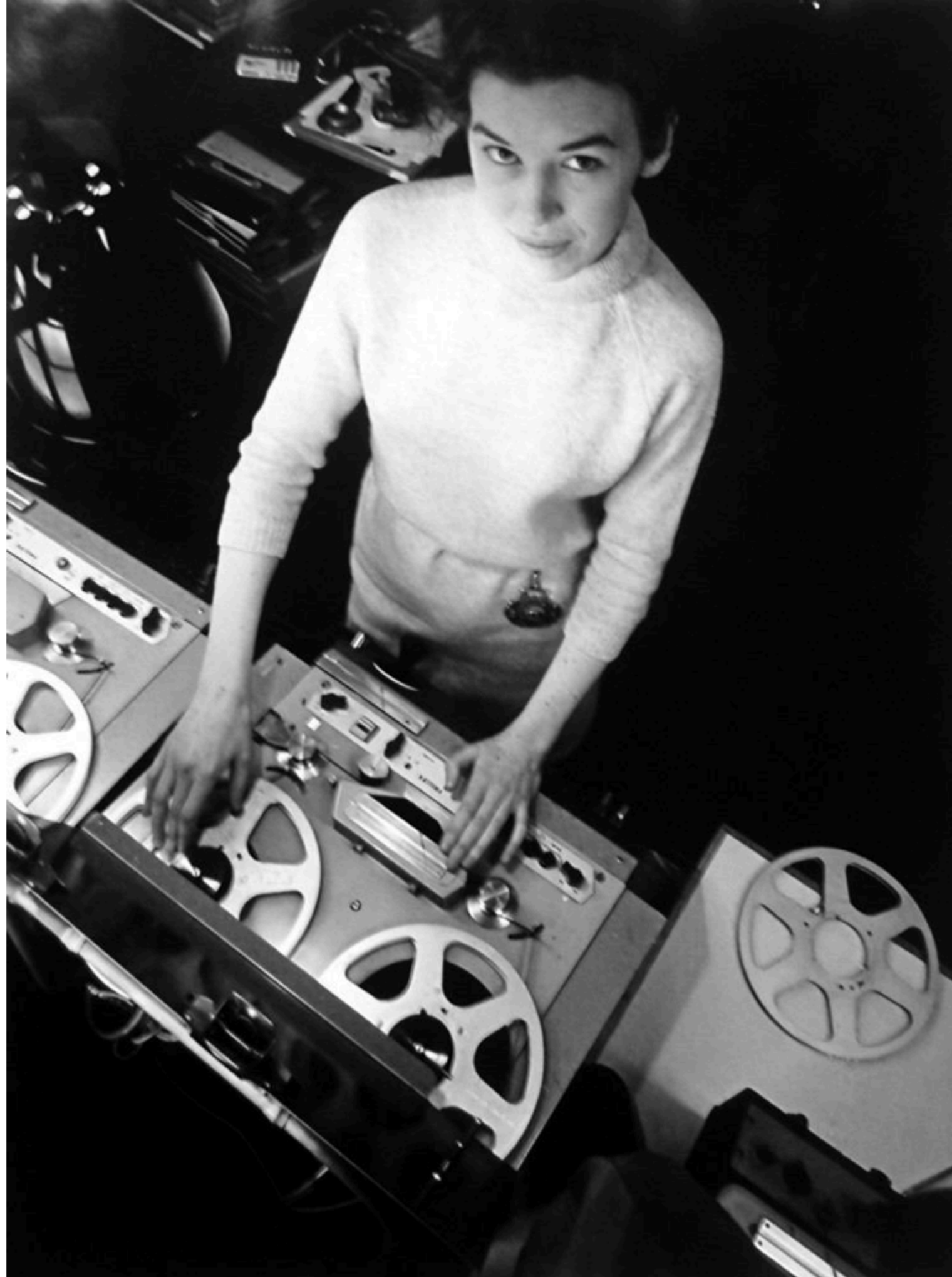
Delia Derbyshire, BBC Radiophonic Workshop, 1965.

[1] Ovdje ću spomenuti jedan od važnijih recentnih projekata analize zastupljenosti autorica u medijskome prostoru, a koji se bavio slučajem BBC Promsa, „najvećega svjetskog festivala klasične glazbe“ i jednoga od ključnih projekata britanskoga javnog servisa, a čiji programi i narudžbe novih djela uvelike određuju repertoar koji (kasnije) emitira BBC Radio 3.