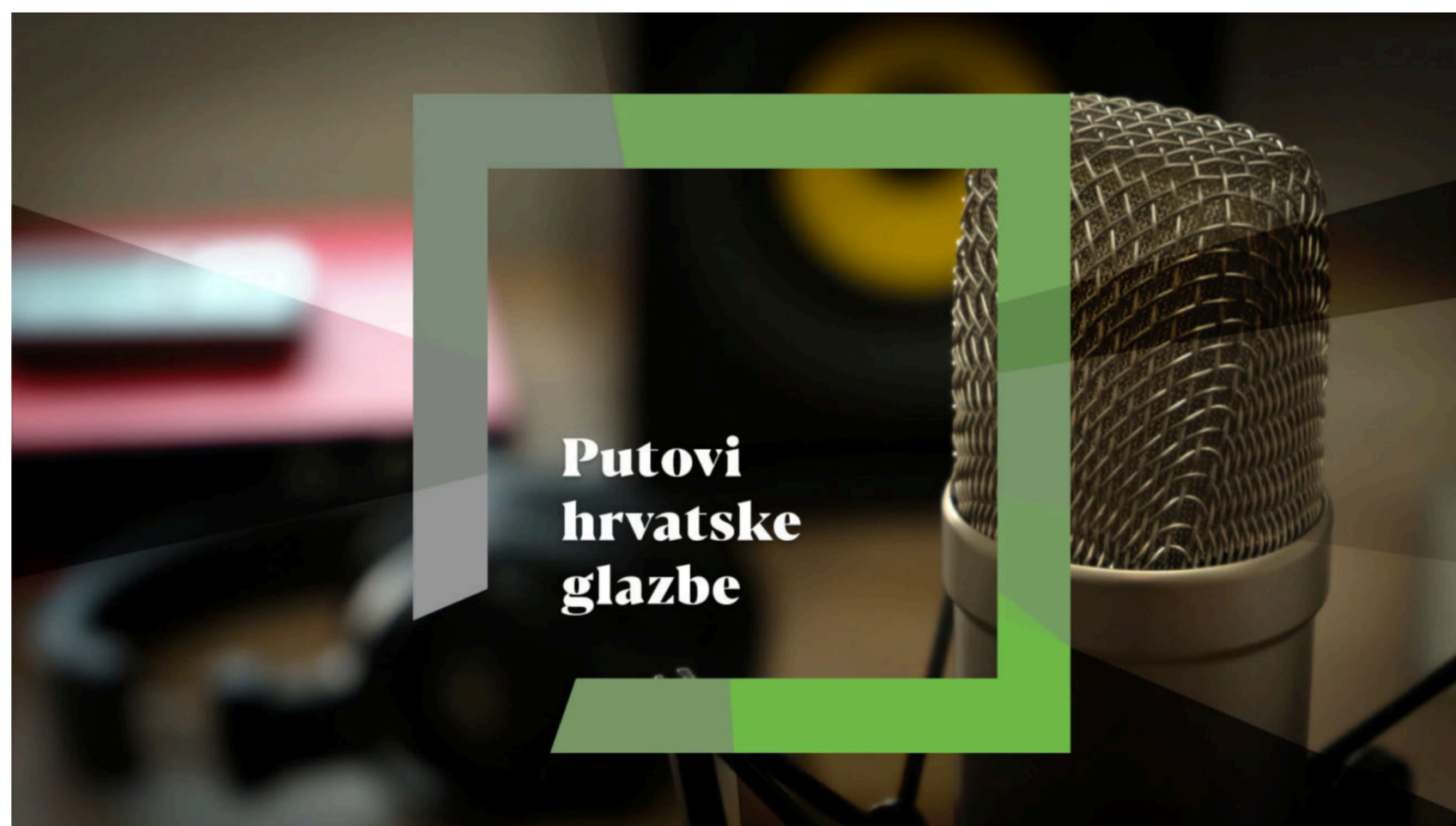
Putovi hrvatske glazbe

U njezinoj se slici povijesti ističe perspektiva protoka vremena: dotakla se izoliranoga slučaja Dore Pejačević , čije se značenje unazad par desetljeća profiliralo kao neizmjereno uspješan glazbeni nacionalni brend, „do pojave trojke S.O.S.“ – Sande Majurec, Olje Jelaska i Sanje Drakulić – s kojima otpočinje i sustavnija prisutnost skladateljica u glavnim produkcijskim tokovima domaće glazbe, pa sve do novih, mlađih generacija, koje bilježe iznimne domaće i napose inozemne uspjehe.