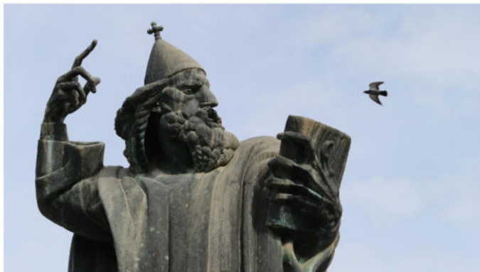
KIP GRGURA NINSKOG