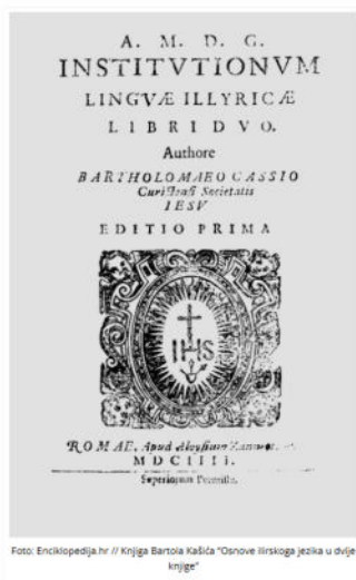
Knjiga Bartola Kašića "Osnove hrvatskoga jezika u dvije knjige"

Konačno, nadbiskup blaženi Alojzije Stepinac (1898.–1960.) postao je najsnažniji simbol moralnog otpora i otpornosti hrvatskog naroda u 20. stoljeću. Stepinac je svoju vjeru manifestirao kao nepokolebljivu obranu ljudskog dostojanstva pred svim totalitarnim režimima, kako onim koji su djelovali u vrijeme Drugog svjetskog rata, tako i onim komunističkim. Njegovo mučeništvo i zatvorska kazna, koje je podnio u ime vjere i obrane prava Katoličke Crkve i hrvatskog naroda, trajno su ga ugradili u nacionalnu svijest kao predstavnika patnje i nadanja naroda (usp. Benigar, 1993, str. 10).