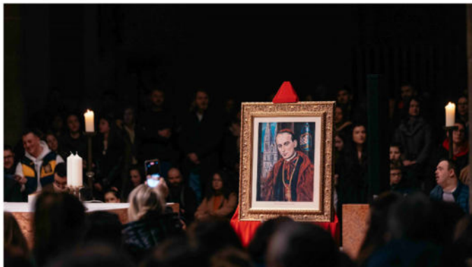
PROSLAVA STEPINČEVA U HRVATSKOJ KATOLIČKOJ ŽUPI U MÜNCHENU