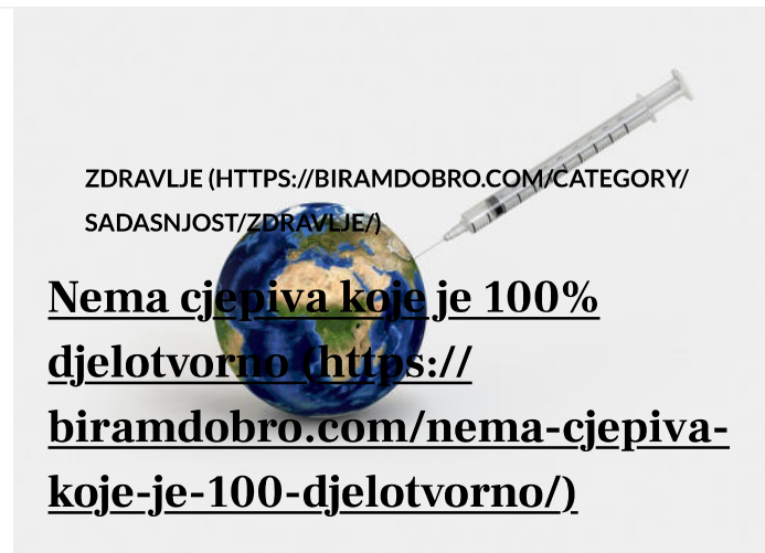
Biram DOBRO (https://biramdobro.com/author/aaa/) (https://biramdobro.com/nema-cjepiva-koje-je-100-djelotvorno/) 11. prosinca 2020.