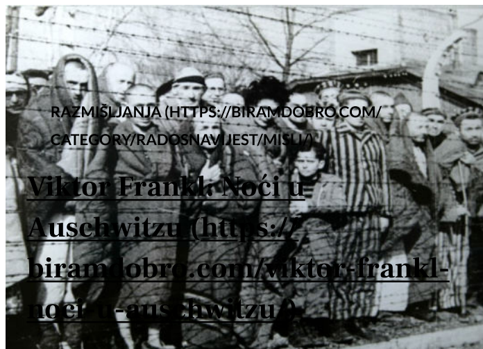
Biram DOBRO (https://biramdobro.com/author/aaa/) (https://biramdobro.com/viktor-frankl-noci-u-auschwitzu/) 6. prosinca 2023.