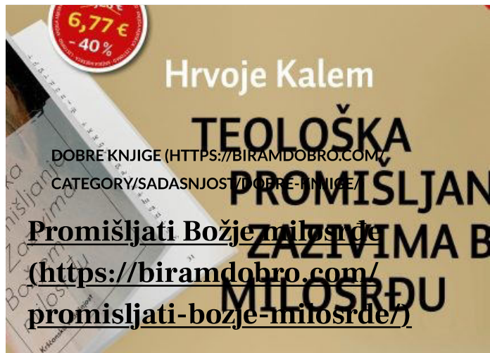
Biram DOBRO (https://biramdobro.com/author/aaa/) (https://biramdobro.com/promisljati-bozje-milosrde/) 3. listopada 2025.