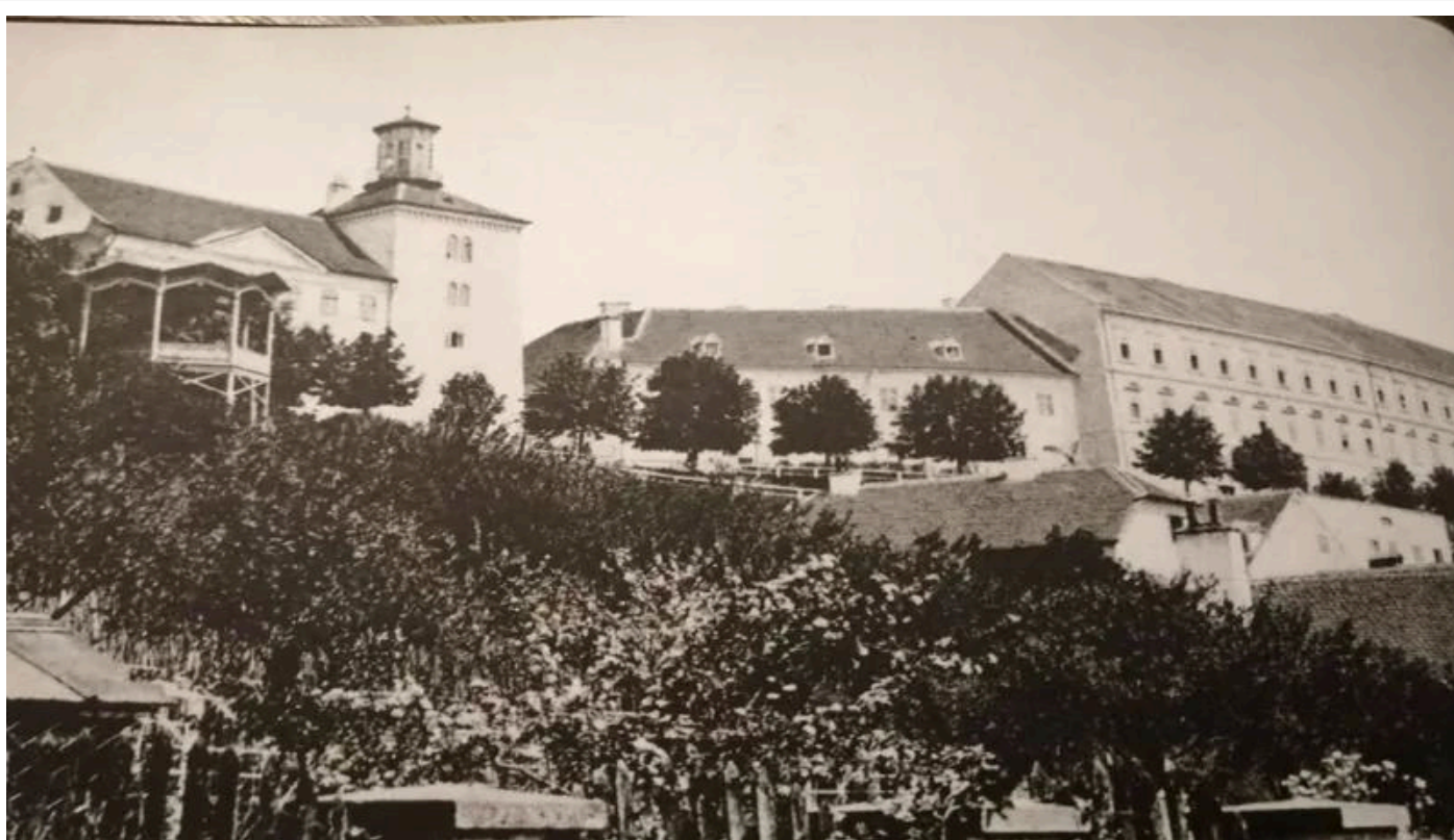
Strossmayerovo šetalište, 1892. godine i pogled na kulu Lotrščak

Top kalibra 76 milimetara proizveden je 1943. godine u Sjedinjenim Američkim Državama. Streljivo za top proizvodi hrvatska tvrtka specijalizirana za eksplozive, a puni se barutom zalijepljenim u slijepljenim slojevima kartona, koji se nakon pucnja razleti i padne u listićima podno kule Lotrščak.