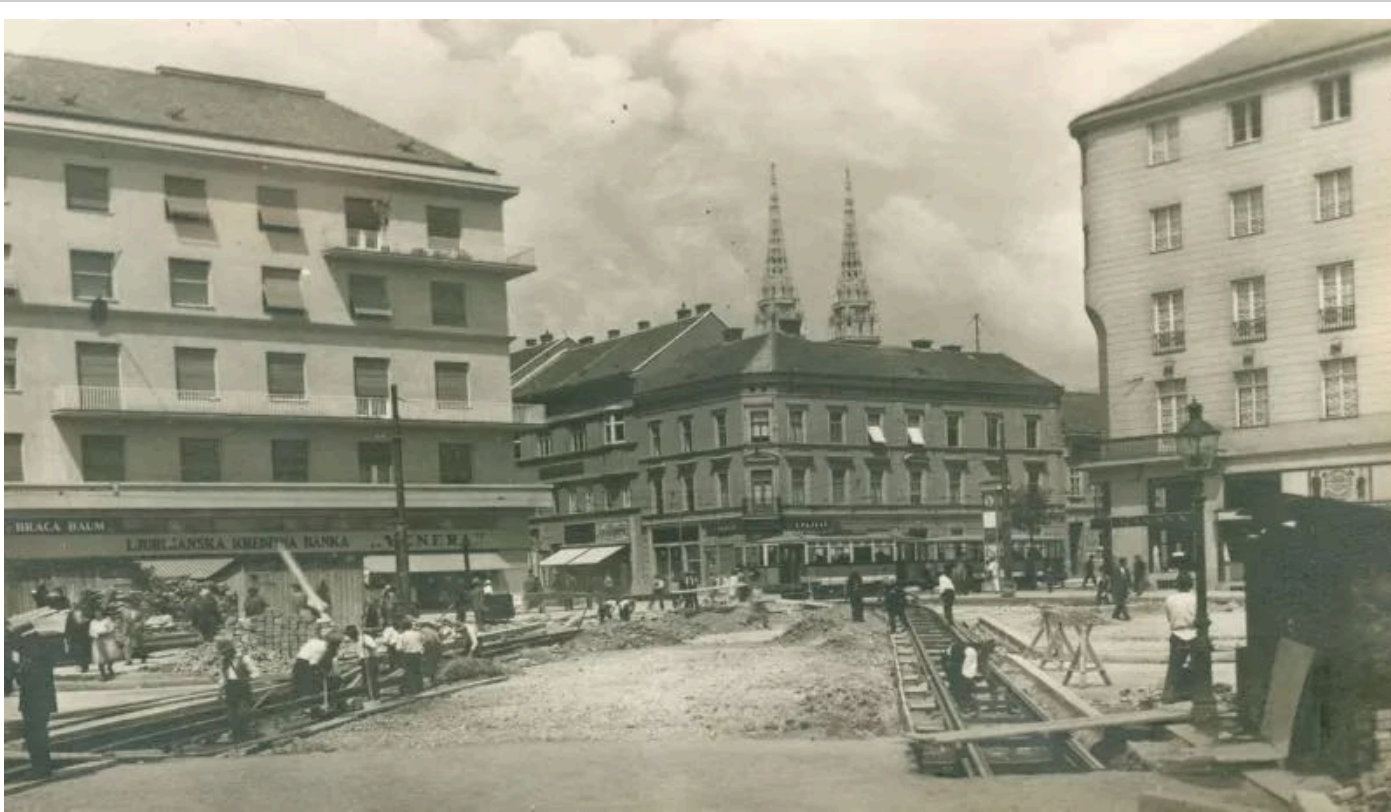
Zagreb je krajem 1920-tih godina prošlog stoljeća bio veliki grad, s više od 120.000 stanovnika

Podimo na današnje Strossmayerovo šetalište. Zastanimo na kratko kod Lotrščaka. Ako se približava podne, sačekajmo da se kazaljke poklope. Jer, tog će trenutka s otvorenog prozora vidilice na vrhu zagrmjeti top, koji svaki dan točno u podne obavještava građane Zagreba da je prošlo pola dana. O topu postoje brojne legende koje stari stanovnici Zagreba dobro znaju. Tako se priča da je top u grad Zagreb dospio kao turski plijen, da je nekad bio u turopoljskom utvrđenom gradu Lukavcu, da je 1593. godine pucao u bitci kod Siska na Turke, a po priči Augusta Šenoae, upravo je tom prilikom taj top opalio: probio i razbio najveći bubanj u turskoj vojsci, a onda je dopremljen u Zagreb i postavljen na Grič da pucnjavom podsjeća na taj veliki događaj.