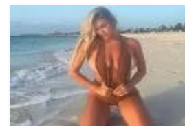
FOTO: "NAJ" ODBOJKAŠICA – Seksi Kayla Simmons ponovno u centru pažnje