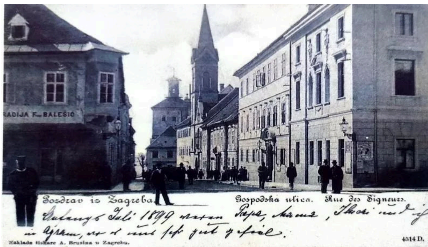
Pogled na kulu Lotrščak iz Gospodske ulice (danas Ćirilometodska)

Neki su stari Purgeri tvrdili da je grički top jedan od topova s Medvedgrada i da je upravo iz tog topa ispaljen hitac preko Save koji je raznio pečenog purana na stolu Hasan-age zulumčara. Bilo je svojedobno građana koji su tvrdili da je top pripadao vremenu kralja Bele IV. i da ga je on ostavio u znak spomena na svoj boravak u tvrdim zidinama Griča, građanima zapovjedavši da se svakog dana puca iz njega, kako ne bi zahrđao.