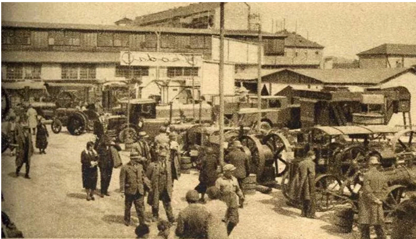
Povodom otvaranja Zagrebačkog zbora, top je pucao dan ranije, u ponoć, prestravivši usnule Zagrepčane

Topnici koji su pucali s Griča bili su redom školski podvornici. Krajem 19. stoljeća mali top zamijenjen je novim. Jedan od prvih topnika, Andrija Slukan, nepropisno je rukovao barutom i smrtno je stradao 2. studenoga 1903. godine. Nakon Slukanove nesreće, dok nije došao novi podvornik, top su naizmjenice ispaljivali kapetan Đuro pl. Čačković i poznati geofizičar Andrija Mohorovičić, upravitelj Meteorološkog opservatorija.