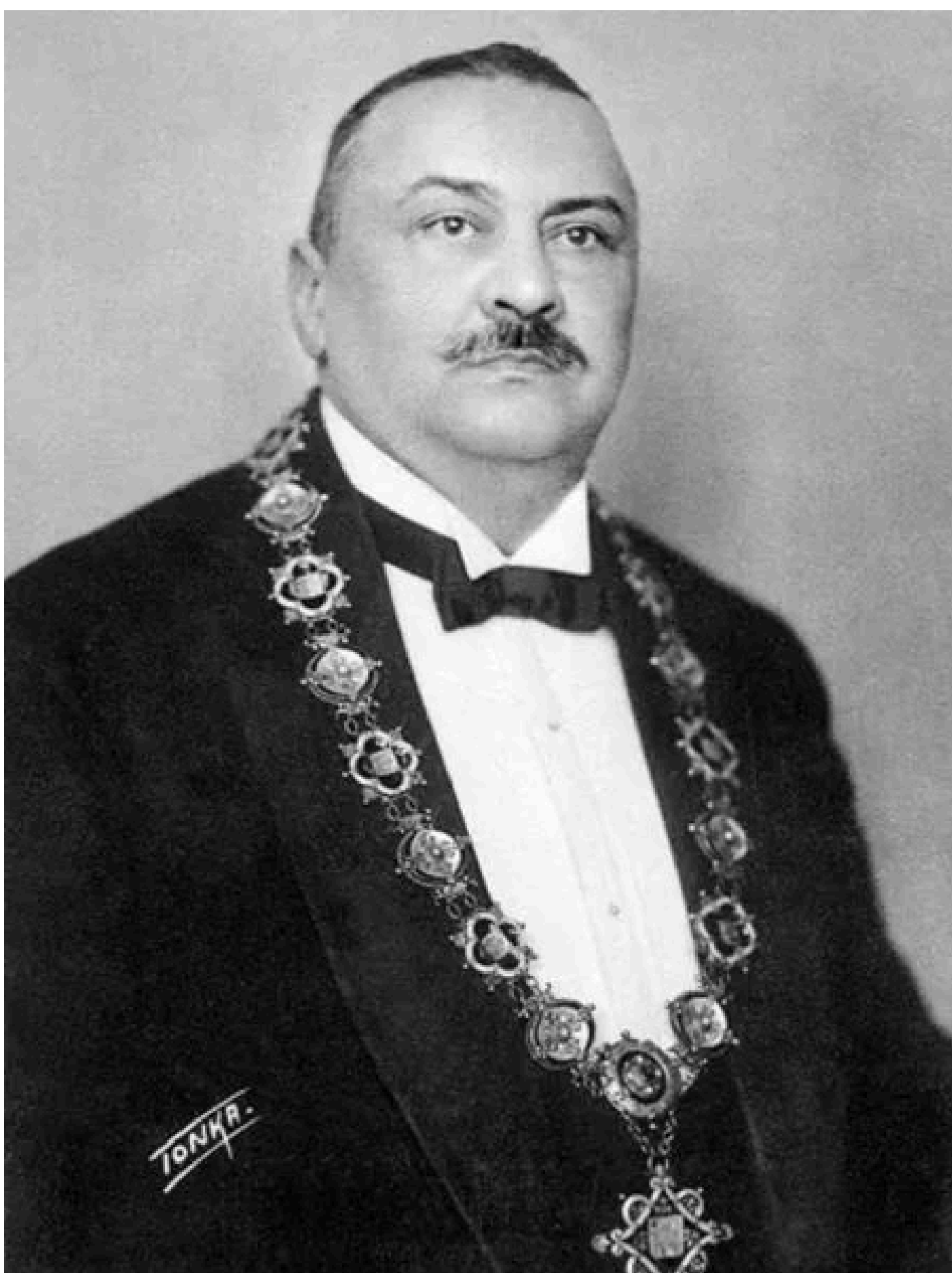
Prilikom izbora gradonačelnika Vjekoslava Heinzela, Grički top je svečano ispalio deset, umjesto jedanaest hitaca

Ta činjenica uključuje, naravno, tradiciju, običaje, ali i kulturnu baštinu, odno