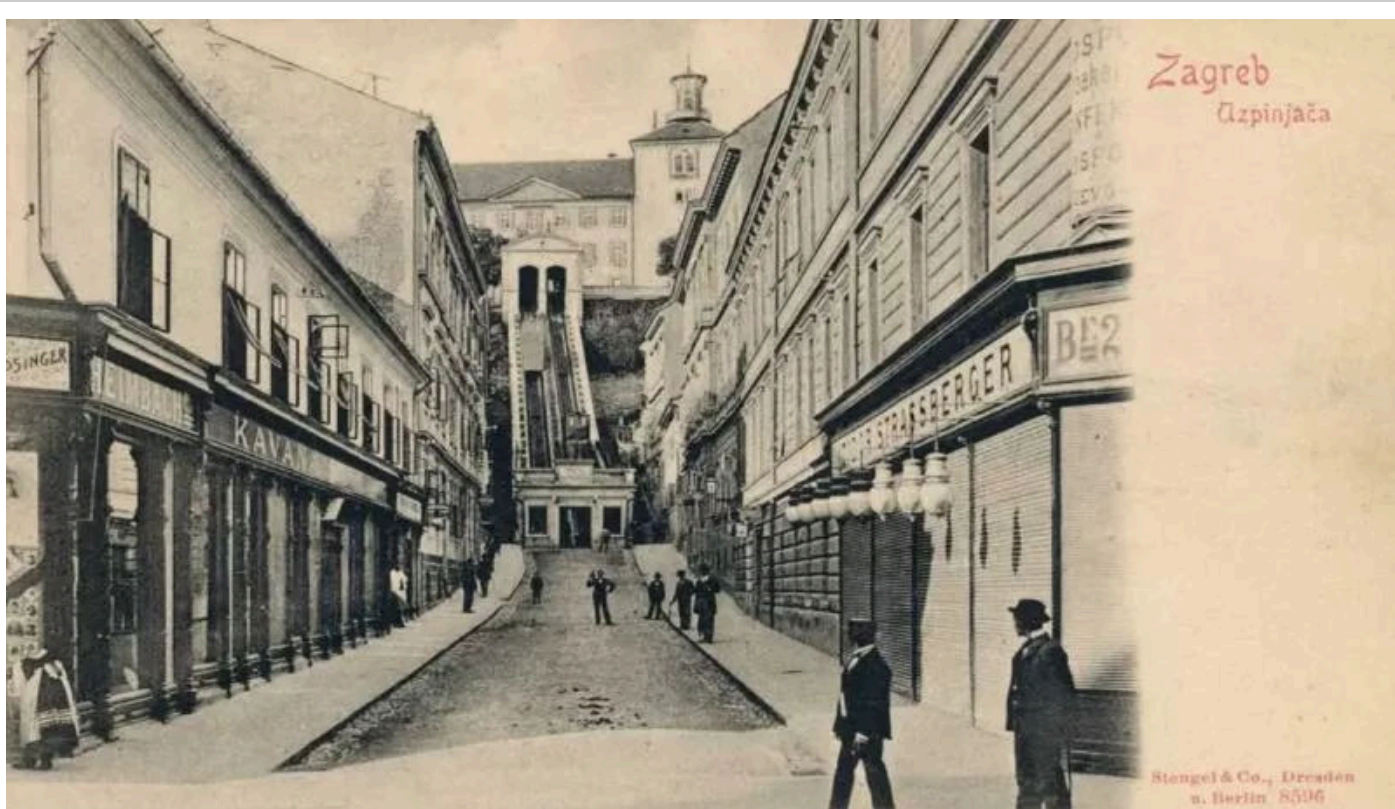
Uspinjača, Bregovita ulica, pogled na kulu Lotrščak, oko 1905. godine

Dakle, "podnevnik" se se ponovno oglasio plotunom s kule Lotrščak, 28. studenog 1926. godine, pod rukom poznatog pirotehničara Vjekoslava Fröbea, koji je dugi niz godina, sve do svoje smrti, svakodnevno objavljivao podne.