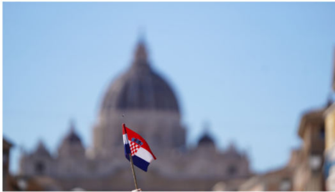
POGLED NA BAZILIKU SV. PETRA I HRVATSKA ZASTAVA