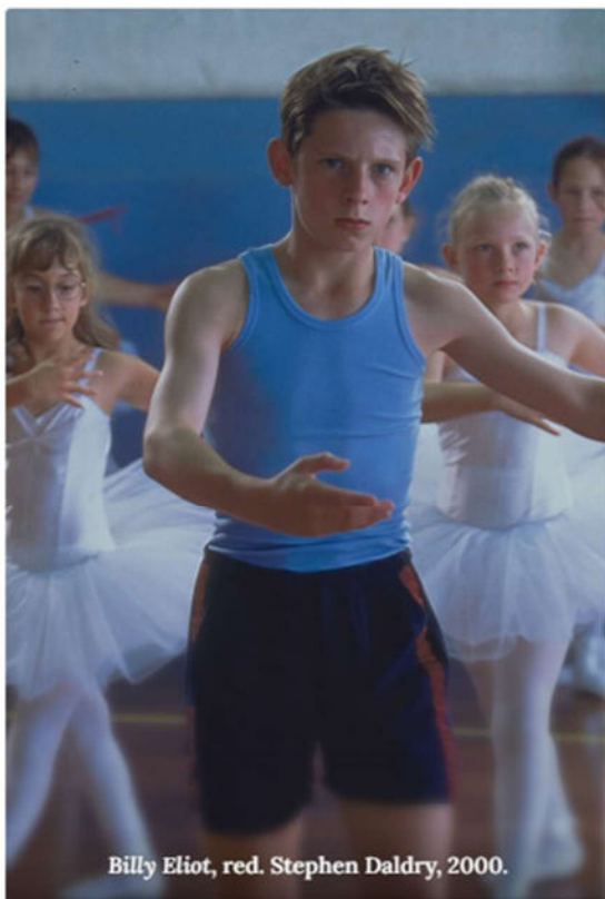
Billy Elliot, red. Stephen Daldry, 2000.