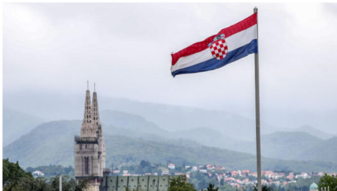
POGLED NA ZAGREBAČKU KATEDRALU I ZASTAVU HRVATSKE